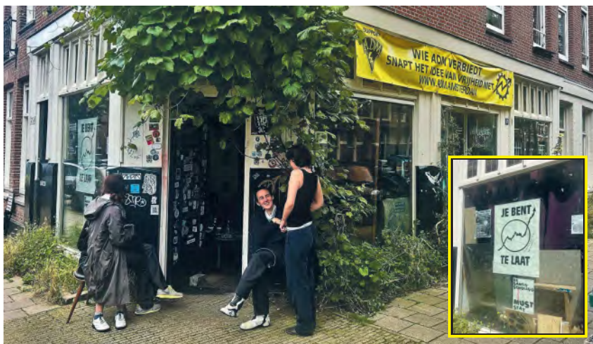
Beelden van Molli Chaoot - Foto: Céline van Daalen

Tussen de nieuwe horecagelegenheden en hippe winkeltjes in De Pijp vind je in de Van Ostadestraat achter een struikgewas een schijnbaar gesloten café: Molli Chaoot. Wat is dat voor een café?