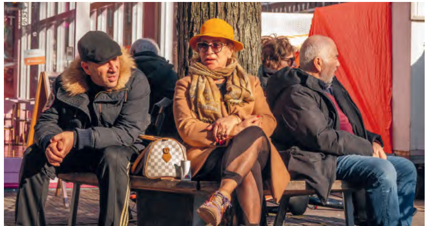
Het verdwenen bankje toen het nog in gebruik was

Het is de wens van het stadsdeel om het bankje te vervangen, echter niet op dezelfde plek. Huidige wet- en regelgeving biedt volgens het stadsdeel geen mogelijkheid tot het plaatsen van een vervangend bankje op deze plek. In het nieuwe beleid is namelijk vastgesteld hoeveel vrije doorloopruimte er voor voetgangers moet zijn om de openbare ruimte toegankelijk te houden voor iedereen, dus ook voor