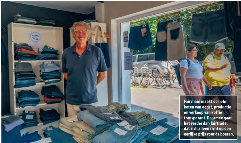
Rob in de winkel

Wat verkoopt The Blue Marble? Allereerst kleding voor vrouwen en mannen, met het label duurzaam. Zo zijn er circulaire jeans van Mud, Deense kleding van Mads Norgaard, een voorloper op het gebied van verduurzamde kleding en vintage kleding van POP18. Verder verkoopt de