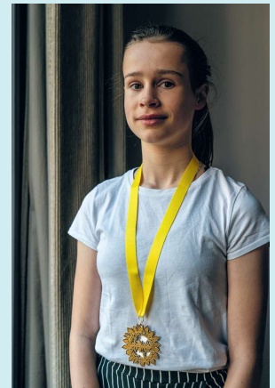
Tekst en Foto: Rob Godfried

Ik ben erfgoeddrager geworden omdat ik deel wil zijn van iets dat verschil kan maken. Ik wil helpen te zorgen dat het niet meer gebeurt. Dat er niet weer mensen worden buitengesloten. Dat kinderen dat al meekrijgen. Zo wil ik een heel klein steentje bijdragen, dat voelt als veel doen."