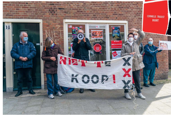
Niet te koop