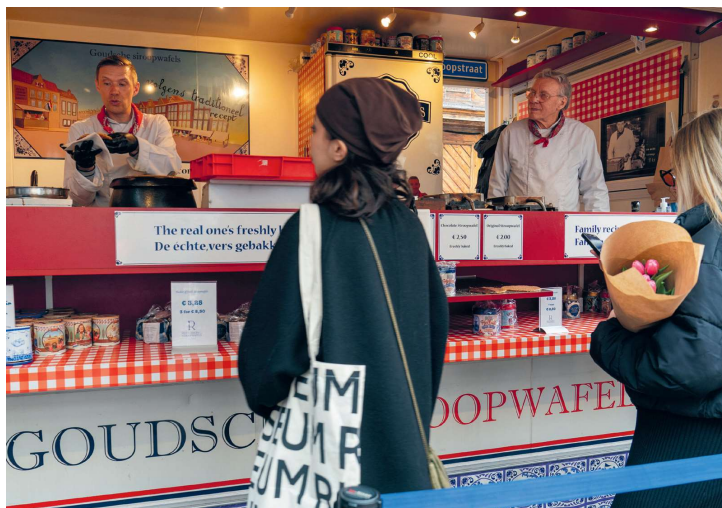
Vader en zoon aan het werk in de kraam

De stroopwafelbakkers hebben een zogenaamde 'Efteling-opstelling' gemaakt, hun klanten wachten in een slinger. "Mischien kennen ze ons in het buitenland nog wel beter dan hier", zegt vader Rudi. Hij is er meestal alleen nog op vrijdag