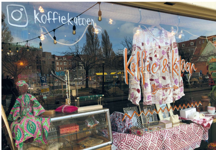
Koffie & Katoen

In Koffie & Katoen , een winkel waar koffie wordt geserveerd en katoenen kleding wordt verkocht, praat ik met enkele vrouwen over hun Tellegenbuurt. Dat vrouwen van alle leeftijden hier bij Koffie & Katoen op het Henrick de Keijserplein een koffietje doen en natuurlijk havermelk prefereren, zegt al iets over de buurt. Het is een veranderende buurt. Ik wil graag weten hoe oudere buurtgenoten in de huurwoningen zich opstellen tegenover nieuwelingen, bijvoorbeeld yuppen in de koopwoningen. Al is zo'n 70% van de woningen anno 2022 nog een huur/corporatiewoning, door de verkoop van etages wonen er nu veel nieuwe buurtgenoten - met heel verschillende achtergronden - door elkaar. Dat is soms lastig, maar over het geheel toch positief, stellen de vrouwen.