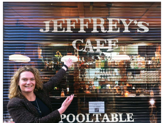
Tekst en Foto: Marnet Schoemaker

Jeffrey's café is al lang overgenomen. De rolluiken zijn verdwenen. De herinnering aan heel veel gezellige avonden met nog meer sterke verhalen blijft.