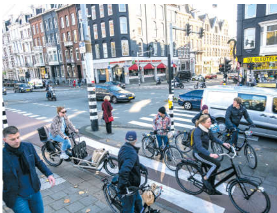
Beelden Stadhouderskade