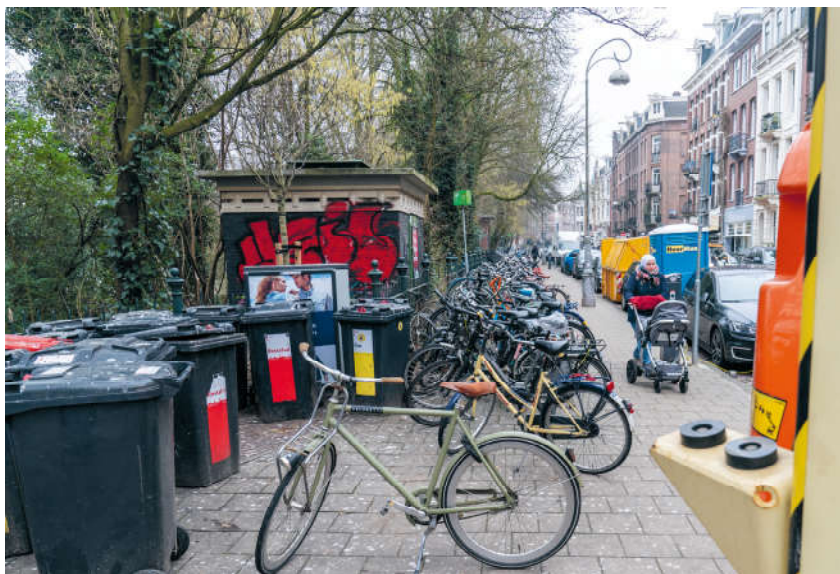
Hoek Van der Helststraat - Jan Steenstraat tegen het park aan

Veel oneffenheden en obstakels in de vaak té smalle bestrating zorgen voor onveilige situaties, ongemakken en valpartijen onder voetgangers. De situatie direct aan de buitenkant van het hek van het Sarphatipark vraagt bijzondere aandacht.