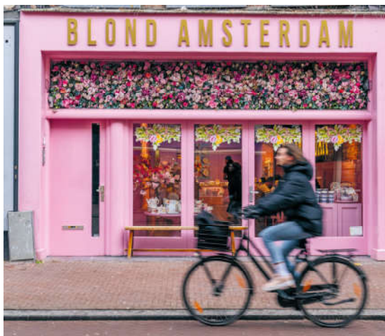
Hier was vroeger een van de uitgeverij in het artikel gevestigd.

Werden de dunne pornografische drukwerkjes anoniem of verhuuld tegen betaling verstuurd, sommige titels en illustraties laten weinig over aan de fantasie: Pomme d' amour, Liefdesappel, met zicht op een kloek getekende vagina. Gedrukt in Montreal, Canada in 1893, om vervolgens het Europese publiek te inspireren of vermaken. August Brancart tekende voor de druk en de distributie. Zijn naam komt terug als drukker en verkoper van titels als A story of a dildo. Een catalogus geeft ondubbelzinnige titels als: New Model Photos of Young Girls: 6 to 12 Years of age, in all positions imaginale of Sool-stirring Amusements of a White Woman with a brute African-Negro in 25 attitudes. We schrijven ongeveer 1890. Vanuit De Pijp worden deze titels aangeboden: meisjes tussen 6 en 12 jaar in alle denkbare houdingen, blanke vrouw