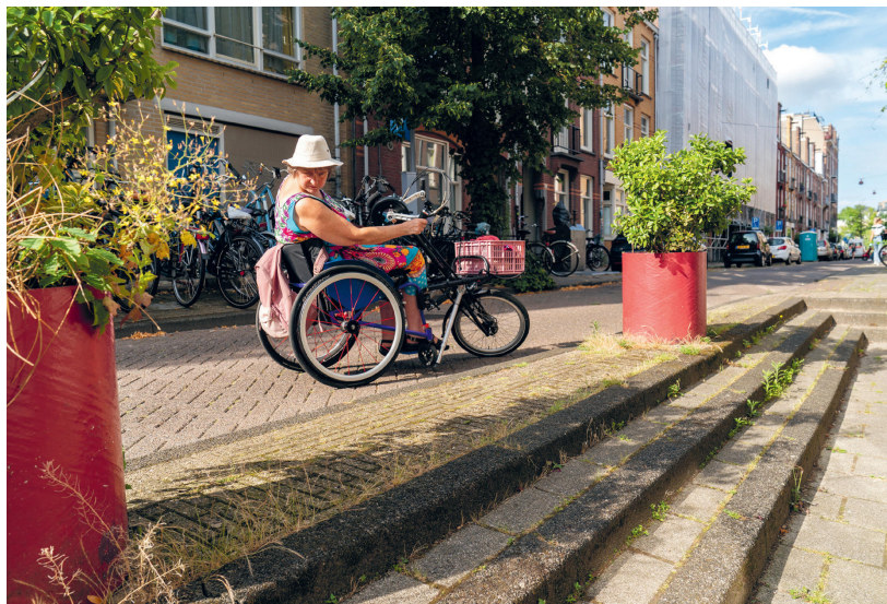
Marja en de Stoepen

Maar in 1896 wordt Nieuwer-Amstel uiteindelijk toch geannexeerd. Daarbij