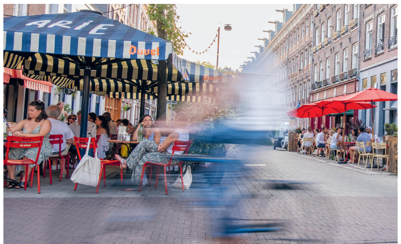
Terrassen Quellijnstraat

Zijn er voor bewoners ook positieve zaken te melden? Jawel, zo wil de gemeente in de toekomst vooraf bepalen wat voor impact een horecazaak mag hebben op de buurt. Of omwonenden daar een stem in