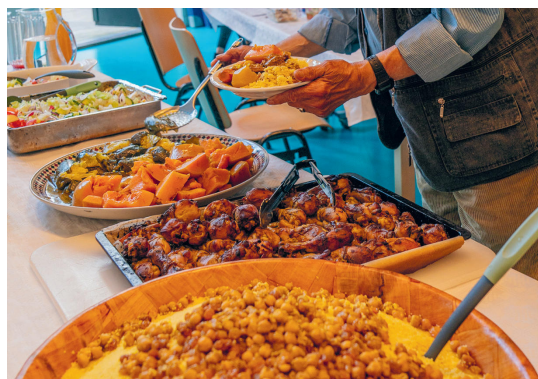
Couscous en meer!

Ik stel me voor hoe zij hebben genoten van het samen voorbereiden en hoe het even zoals thuis moet hebben gevoeld. Hoe zij niet alleen voor zichzelf een familie in de buurt bouwden, maar daarmee ook voor alle anderen. Omdat allerlei mensen hier aan tafel zitten, moslims en niet moslims, Nederlanders, Marokkanen, Ethiopiërs. Om elkaars cultuur te leren kennen, nieuwe mensen te ontmoeten. Het lijkt een grote familie, een familie die ze moeten missen, maar hier gemaakt hebben, in de Diamantbuurt.