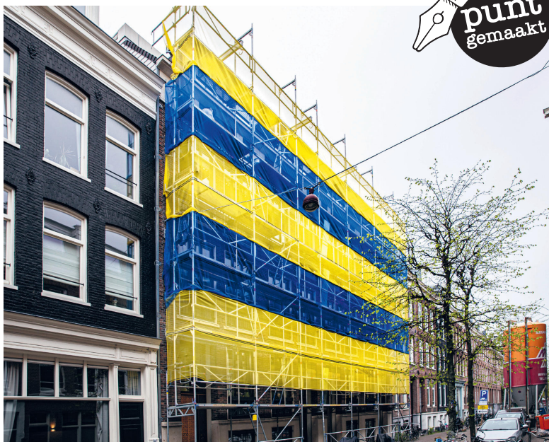
Goed statement in de Govert Flinckstraat

Fotograaf Henk Pouw signaleert opvallende gebeurtenissen en taferelen in De Pijp en maakt zijn punt in de krant.