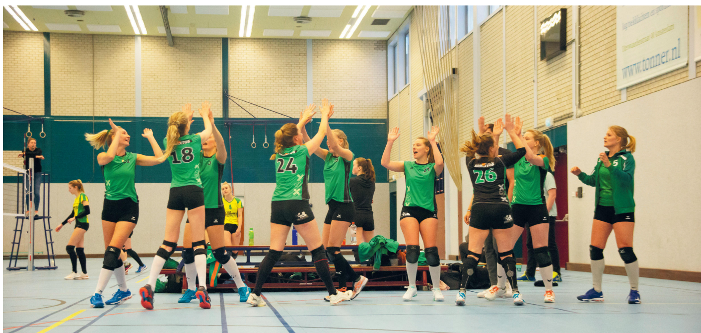
Spelers juichen elkaar toe voor de wedstrijd