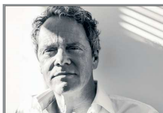
Kees BodyMind Coach

Maak nu een afspraak www.BodyMind.nl Frans Halsstraat 4