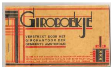
Giroboekje Gemeente Giro Amsterdam, ontworpen door Fré Cohen, ca. 1939

gelmatig opdrachten van gemeentelijke diensten, onder andere voor publicaties en exposities over Schiphol en de Amsterdamse haven.