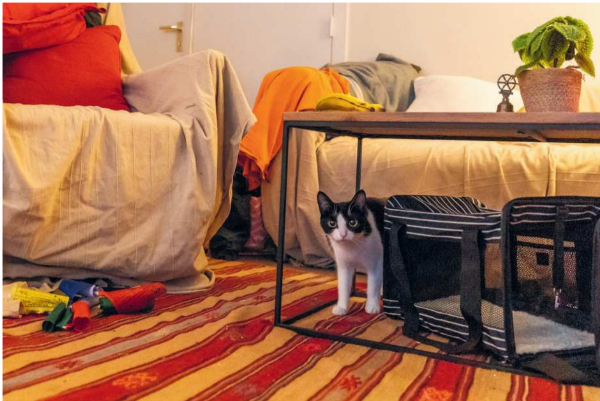
Poes bij bewoner in de kamer