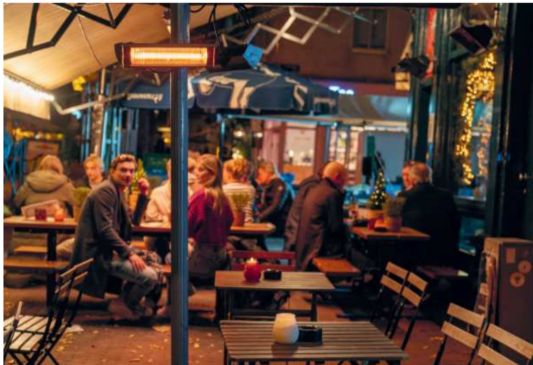
Terrasverwarming: rijp voor transitie?

Nu blijkt uit de Transitievisie Warmte (september 2020) van de gemeente dat er gekozen is om door middel van hybride verwarmingssystemen (gasketel in combinatie met een warmtepomp) en betere isolatie het aardgasgebruik in De Pijp te reduceren. De overgebleven behoefte aan aardgas kan volgens de gemeente op termijn worden opgevangen door duurzame alternatieven zoals groen gas of groene waterstof. Voorlopig blijft De Pijp dus op het huidige gasnet aangesloten. Want aansluiting op een warmtenet, vaak afkomstig van restwarmte van datacenters (ruimtes met grote computersystemen),