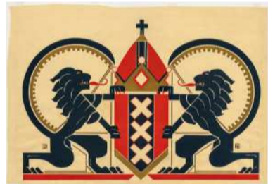
Stadswapen Amsterdam, ontworpen door Fré Cohen, ca. 1930