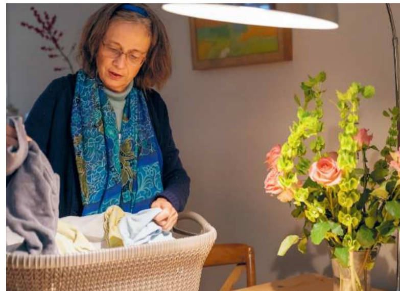
Wies met de was

Het kan daarbij goed zijn doodgaan te zien als een avontuur waarin je beslissingen neemt, boos bent, ontkent, accepteert, onderzoekt, relaties herstelt,