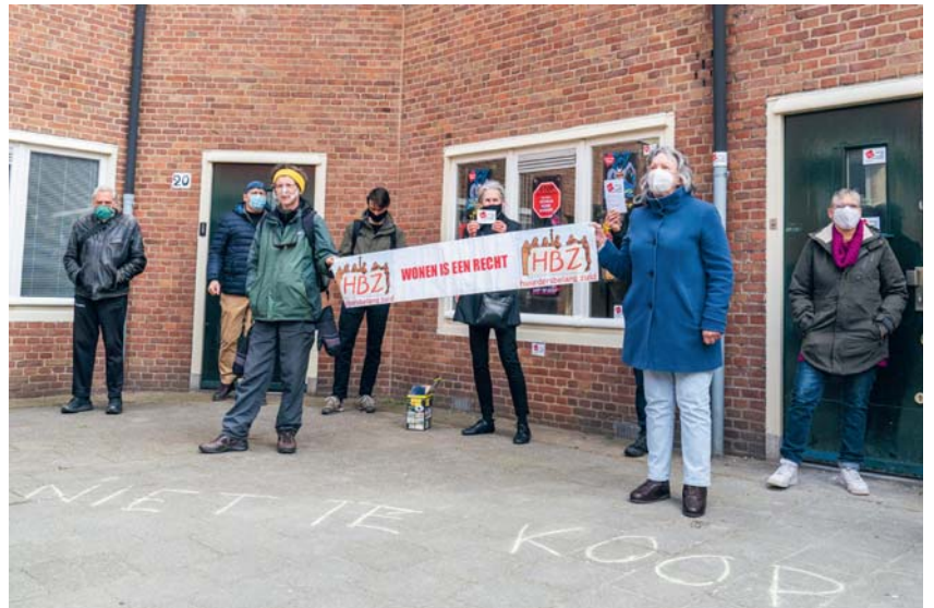
Actie tegen de verkoop van Coöperatiehof 18hs van de Corporatie de Key - Foto: Rob Godfried

Er komt vanuit de huurderswereld steeds meer opstand tegen de verkoop van cor-