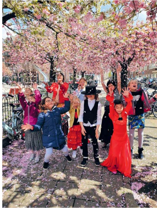
De dansers van Kidsflamenco zijn enthousiast over de talentenshow

Heb jij ook een leuk idee voor het festivalweekend op 13, 14 en 15 augustus, wil je je opgeven voor de talentenshow of wil je meehelpten als vrijwilliger? Stuur dan een mail naar: buurtgebouwhdk@gmail.com Updates kun je vinden op www.buurtgebouwhdk.nl en op de socialmediakanalen van De Pijp Krant.