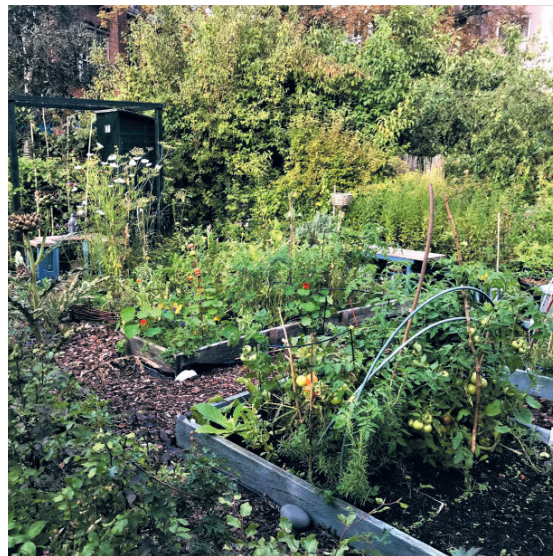
Van Frans Hals-tuinen

Een verzoek van bewoners om alternatieven te bespreken die eveneens rust en voldoende privacy en veiligheid konden garanderen kreeg geen kans. Tekeningen of foto's van alternatieve plannen, zoals van de Frans-Halstuinen, mochten van het projectteam niet worden getoond. Alleen tekeningen van het projectteam vormden uitgangspunt van gesprek. Zo was er geen wezenlijke afweging van