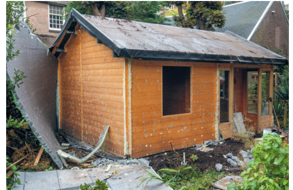
Het tuinhuis in staat van afbraak.

Wij herkennen ons niet in dit artikel. Er is hier een zorgvuldige afweging gemaakt van alle belangen, waarbij de argumenten van de bewoners zeer serieus zijn genomen. Wij begrijpen de emoties rond dit onderwerp, echter wogen andere argumenten (zoals hierboven genoemd), zwaarder. De belangen van onze huurders staan centraal bij alles wat we doen. Wij staan voor het huisvesten van mensen die een steuntje in de rug nodig hebben, voor zo lang dat nodig is. Dit doen we zonder selectie aan de poort, in alle delen van Amsterdam.