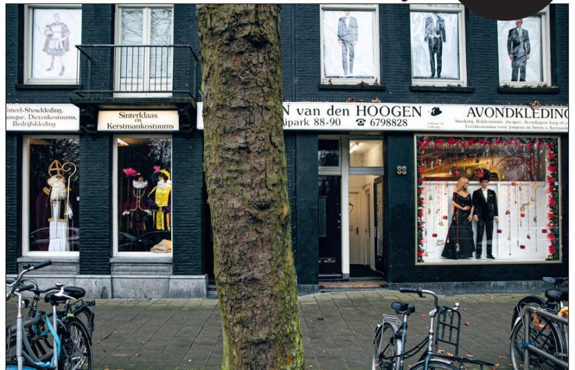
Het oude normaal gaat sluiten