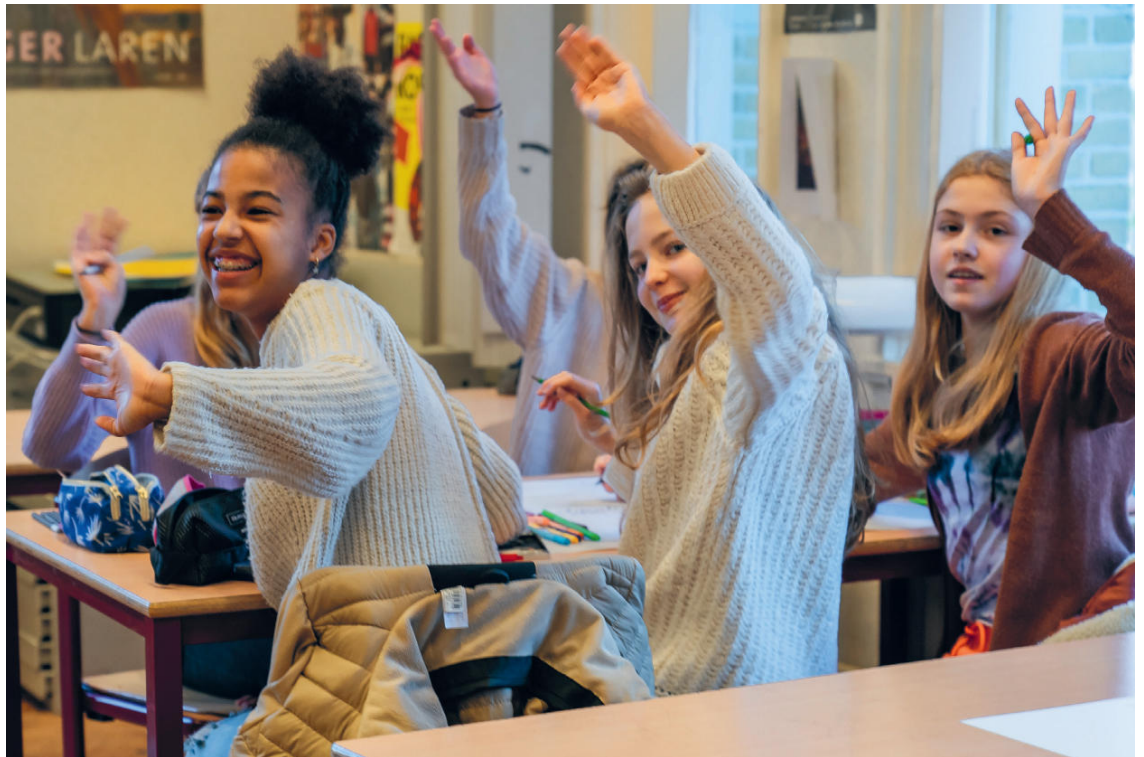
Leerlingen van de Berlageschool zwaaien Keniaanse leerlingen uit na hun contact via internet

We kregen de opdracht om in groepjes een poster te maken. Daarop moesten we in het midden een tekening maken van een zelfgekozen probleem (groot of klein) dat ons bezighoudt (in het Engels omdat wij een tweetalige school zijn). Klimaatverandering was ons onderwerp en daar omheen maakten we kleine tekeningetjes met de gevolgen van klimaatverandering. Daarna gingen we bellen