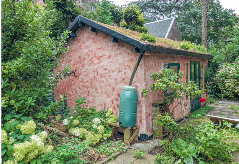
Het tuinhuis toen het er nog mooi bij stond.

Het begon toen huurder en bouwer van een ecologisch tuinhuis ging verhuizen. Jarenlang had hij aan het tuinhuis gewerkt en buurtbewoners waren er verukt over. Een voorbeeld-tuinhuis: ecologisch verantwoord, met grasdak, goede isolatie en herbruikbaar opgevangen regenwater. Geschilderd in de kleuren van de omliggende woningen. Kortom: een juweel voor de buurt.