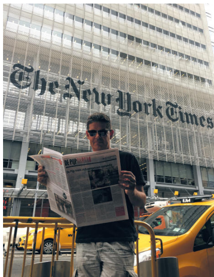
8th Avenue, augustus 2018

Een geruststellend contrast dan, zo'n groepje Tweede Kamerleden dat politici aan de tand voelt over de kindertoeslagaffaire. Af en toe streng, maar vooral pogend om processen te begrijpen, tot in detail. Saai is goed! De pers was belangrijk bij het naar boven halen van het toeslagenschandaal en recentelijk het complotdenken binnen een partij die door veel aanhangers tot voor kort nog acceptabel kneiterrechts werd gevonden. Als de geschiedenis iets leert, dan wel dat extreem gedachtengoed ons nooit verder heeft gebracht.