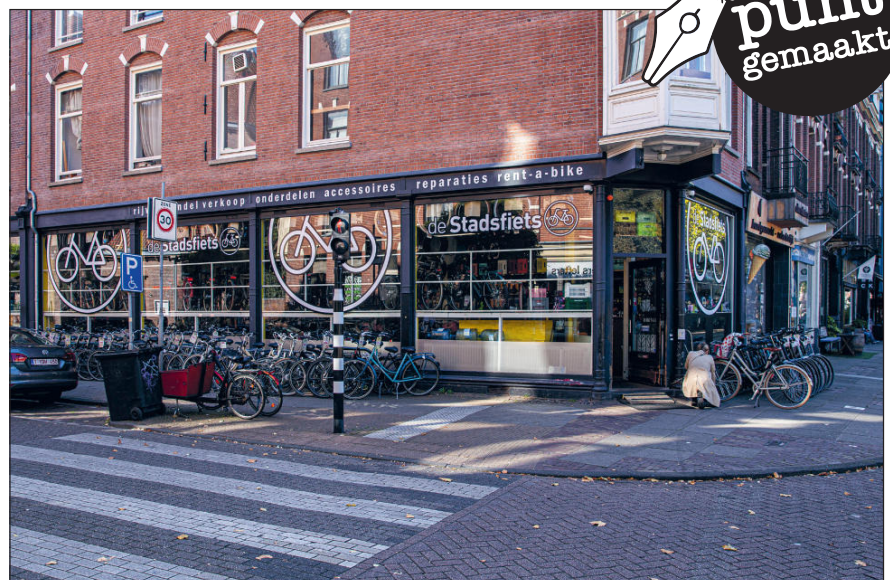
Ceintuurbaan 354, in 1972 wijkcentrum Ceintuur

Fotograaf Henk Pouw signaleert opvallende gebeurtenissen en taferelen in De Pijp en maakt zijn punt in de krant.