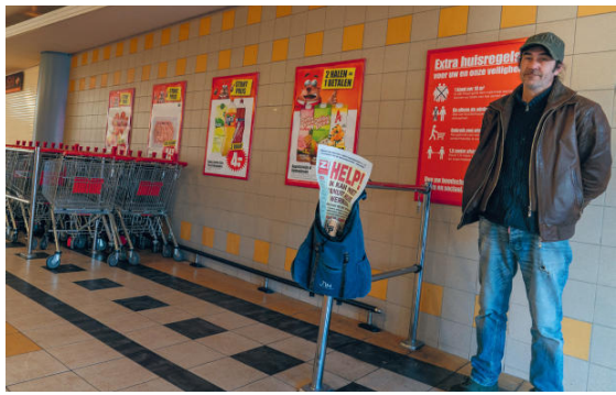
Z!-verkoop kan niet thuis werken.

Niet eerder zagen we zoveel mensen in onze buurt die verdoemd leken, in de war en onverzorgd. Niet eerder werd ons zo snel en vaak achter elkaar gevraagd om wat kleingeld, als we lekker op een terrasje zaten. Het schijnt dat in de afgelopen tien jaar het aantal daklozen in Nederland is verdubbeld naar 40.000!