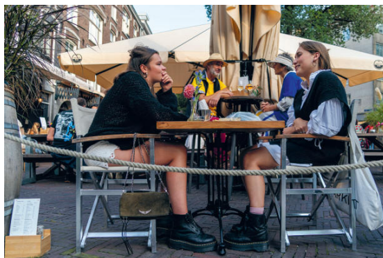
Met Dr. Martens op het Gerard Douplein

aan in combinatie met de wollen trui die mijn oma heeft gebreid. Jullie daarentegen paraderen in een soort uniform, een (on)afgesproken kledingoptreden. Deze zomer trending: lang los haar, een onschuldig jurkje en daaronder broeierige voeten in Dr. Martens of cowboyboots. Ik noem het de klederdracht van het Gerard Douplein. Die hangt natuurlijk ook af van het moment op de dag, moment van de week, de mood. Als je zelfspot en humor hebt, of je mega niet aangesproken voelt; blij vooral lezen.