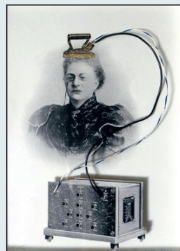
"Defrost" © Theo Jeuken Collage/object (2020)

zetten om de stem, ideeën en tijd van burens 'op te halen'? Nee, niet oké."