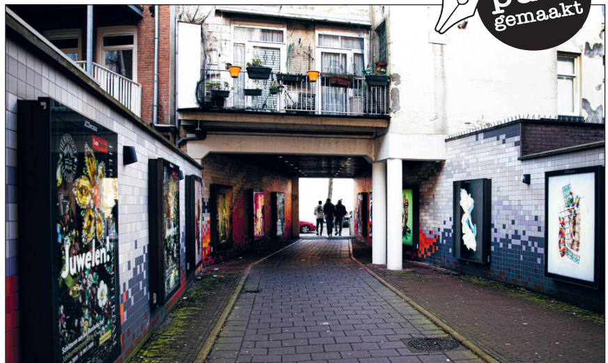
Ook de pijp heeft een fietstunnel

Fotograaf Henk Pouw signaleert opvallende gebeurtenissen en tafereel in De Pijp en maakt zijn punt in de krant.