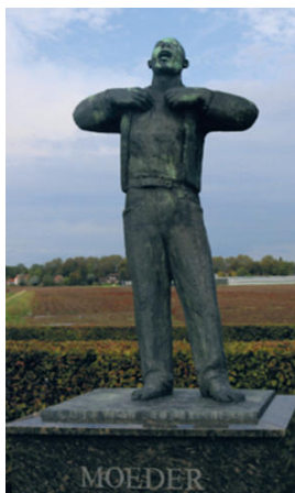
Monument Moeder. Ontworpen door Hubert C.M. van Lith.

We weten weinig van deze jongemannen. Ze besloten om in januari 1945 met de fiets uit Amsterdam te vertrekken en naar het bevrijde Brabant te gaan. Maar onderweg ging het mis en werden ze door de Duitsers opgepakt. De reden van hun arrestatie is niet bekend. De afloop