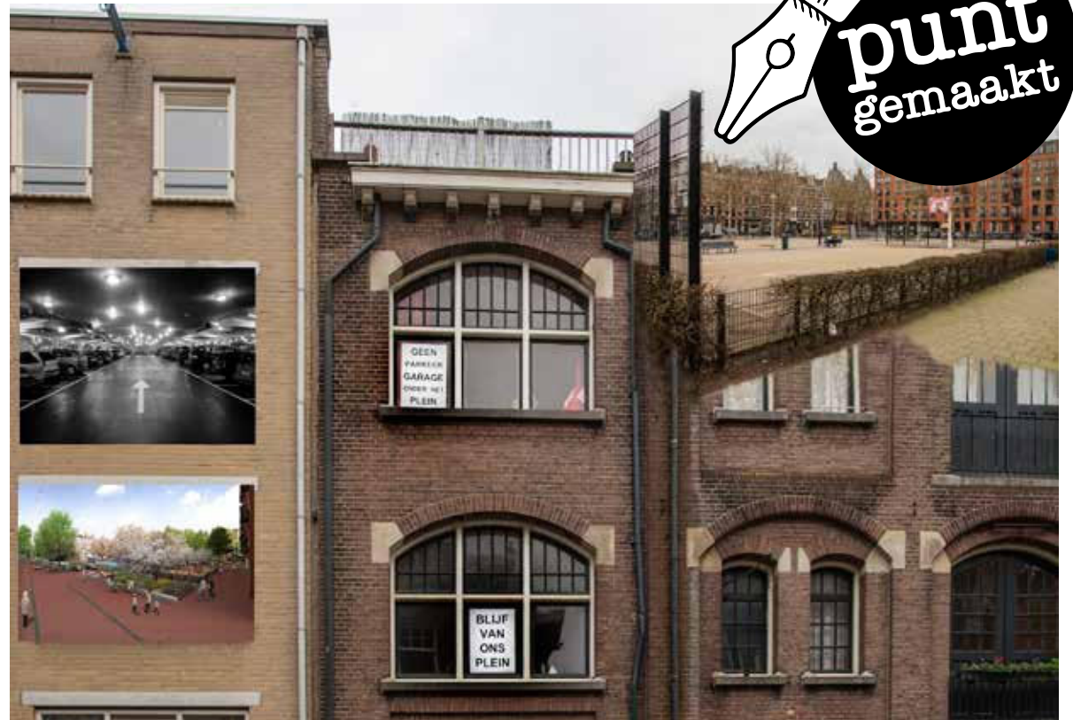
Protest en verzet lonen! De bouw van de Willibrordusgarage is uitgesteld.

Fotograaf Henk Pouw signaleert opvallende gebeurtenissen en taferelen in De Pijp en maakt zijn punt in de krant.