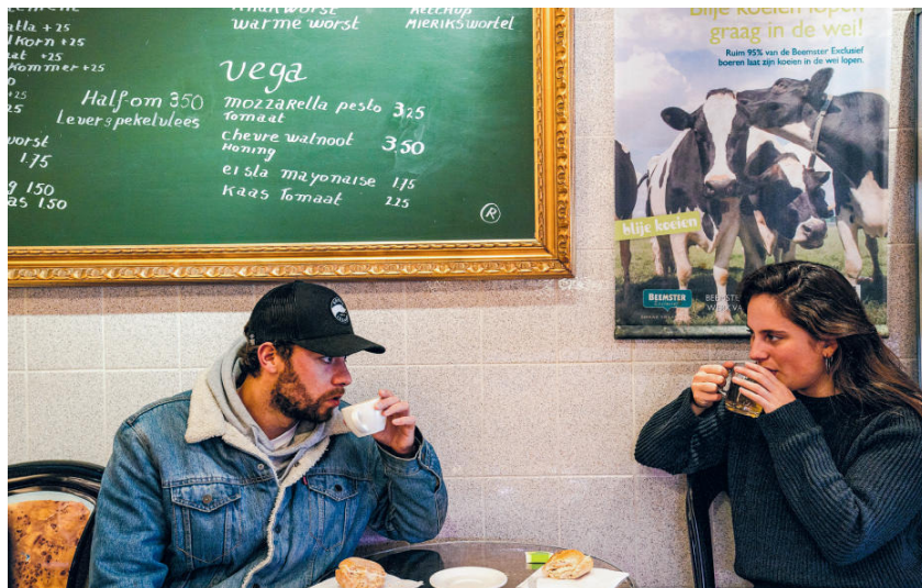
Doe-maar-normaal tentje ‘Kaassie Kaassie’ in de Eerste Sweelinckstraat sloot deze zomer haar deuren