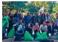
Werkgroep De Schone Pijp op 'World Cleanup Day'

Verder in deze krant ■ p3. Waving the British goodbye ■ p7. 50 Jaar Wijkcentrum