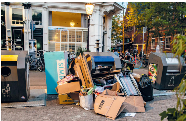
Hoek Gerard Doustraat en Eerste Sweelinckstraat - Foto: Henk Pouw

In een gezellige ruimte aan de Quellijnstraat zijn een 12-tal mensen levendig aan het vergaderen. De leden van de Werkgroep de Schone Pijp bestaande uit buurtbewoners, ondernemers en vertegenwoordigers van het stadsdeel, komen hier iedere eerste maand van de maand samen. Het Wijkcentrum zorgt sinds begin 2017 voor ondersteuning.