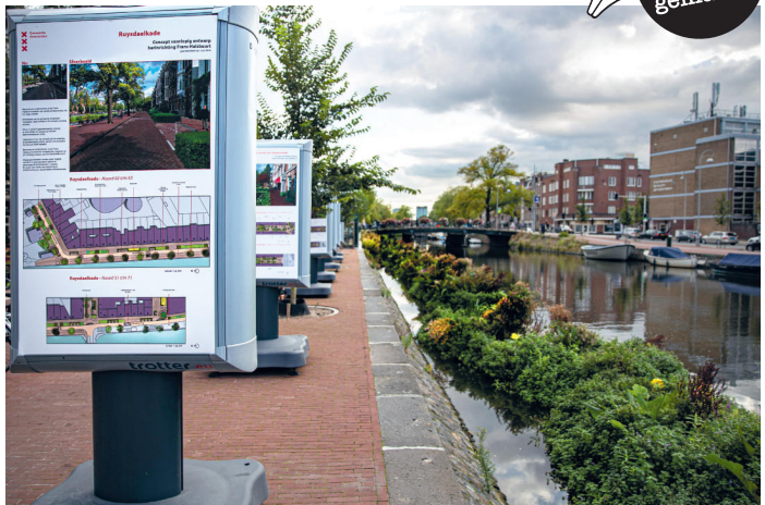
Herinrichting Boerenwetering meer dan geslaagd