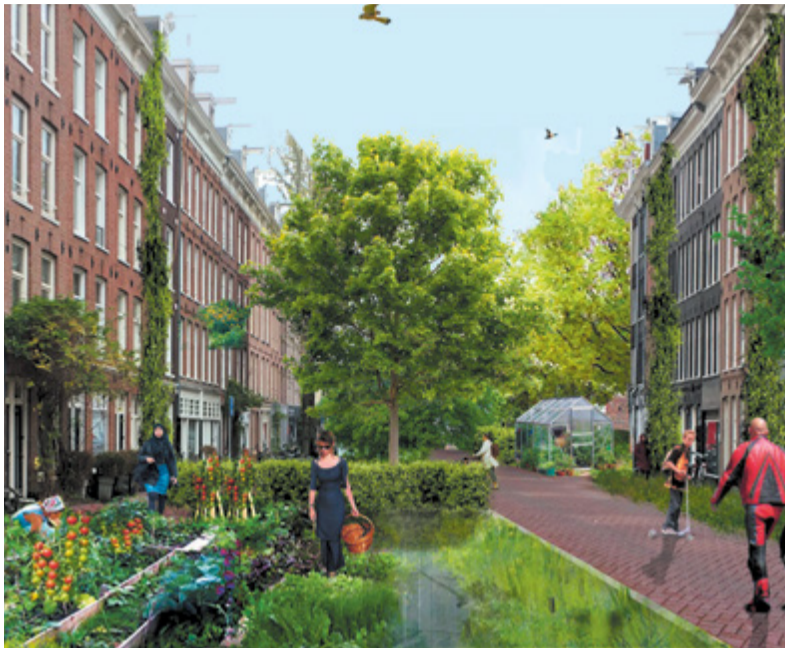
Artistieke impressie Frans Halsbuurt