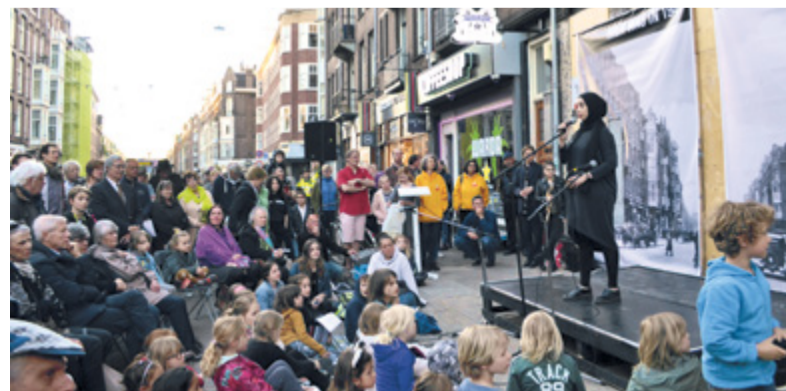
4 mei herdenking 2018 in de Van Woustraat

De jaarlijkse vrijheidsmaaltijd in de Pijp, georganiseerd door het 4 en 5 mei jongerencomité, vindt dit jaar plaats in clubhuis CC Amstel. Het doel van de maaltijd is om samen met de buurt de vrijheid te vieren en te waarderen. Er zijn verschillende optredens van Theater na de Dam van CC Amstel, van Autotonenkor Diamantbuurt, een voordracht van een van de winnende gedichten van de poëziewedstrijd voor kinderen en een verhaal uit de Tweede Wereldoorlog. Daarnaast is er een dialoog over vrijheid en een maaltijd gesponsord door verschillende ondernemers in de buurt.