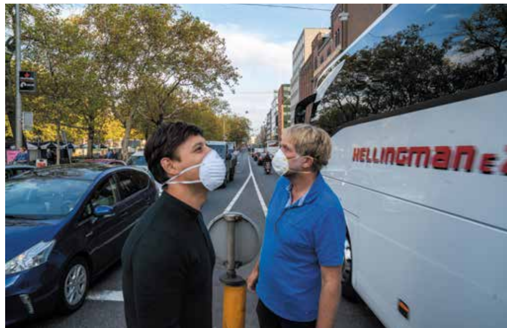
Zorgen over schadelijke uitlaatgassen op de Stadhouderskade

Dat kleine stappen die niet veel geld kosten prima kunnen helpen, is iets dat ook Aukje van Bezeij van Energiecoöperatie Zuiderlicht graag wil benadrukken. Zuiderlicht helpt eigenaren van grote daken, zoals scholen, sportverenigingen