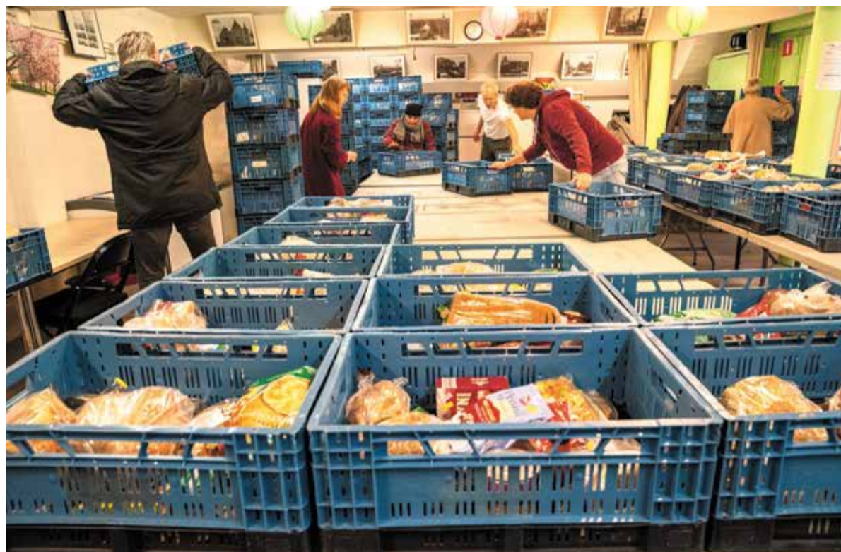
“Leven met een permanent tekort geeft een héél ander gevoel dan zuinig leven...”

Een goeie broek Leven met een permanent tekort geeft een héél ander gevoel dan zuinig leven om misschien wat over te kunnen houden, weet Mike Paschenegger. “Daarom organiseren we ook nog andere dingen om het leven een beetje te veraangena-