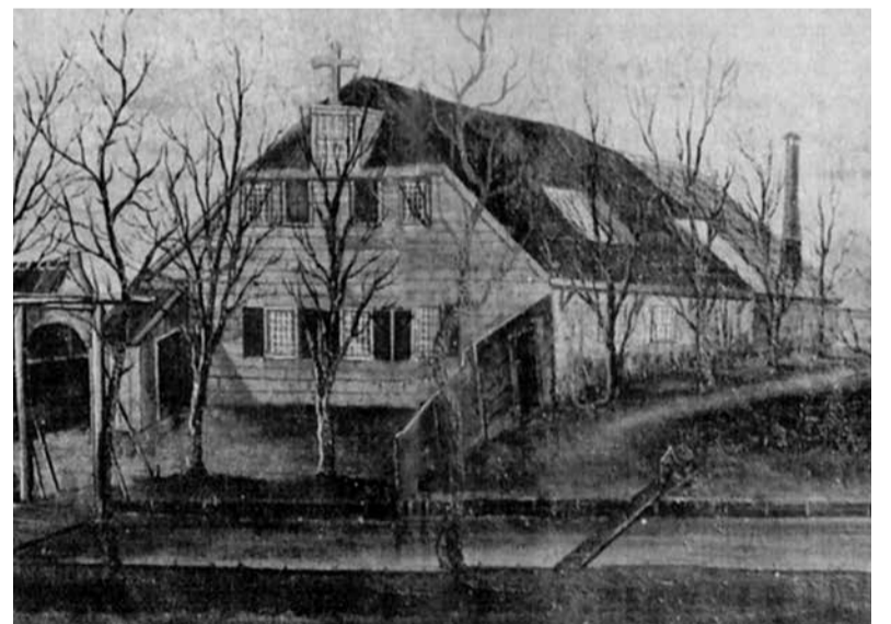
De Stal van Bethlehem