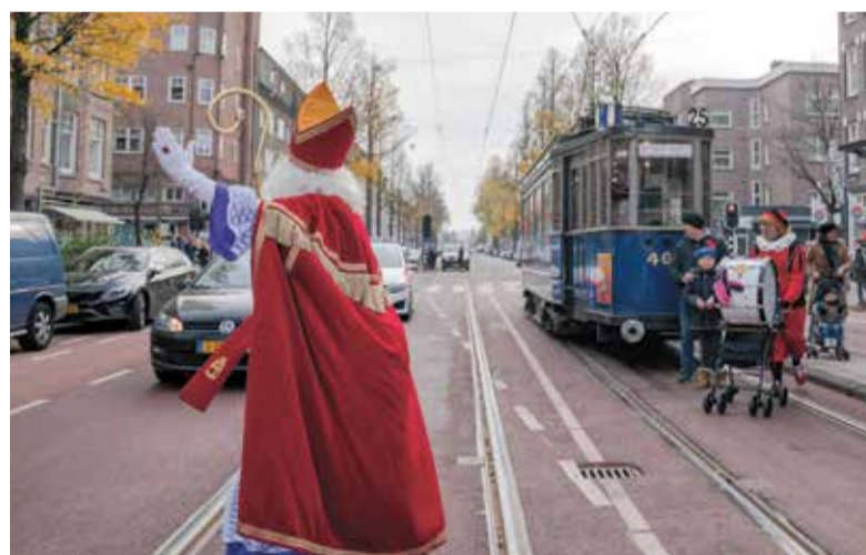
Sinterklaas arriveert per tram om de nieuwe Van Woustraat te openen

Het einde van de wegwerkzaamheden is dus voor iedereen een grote opluchting. Fietsers kunnen weer op het fietspad, voetgangers kunnen op de stoep lopen zonder dat ze per ongeluk op een tijdelijk fietspad worden aangereden en winke-