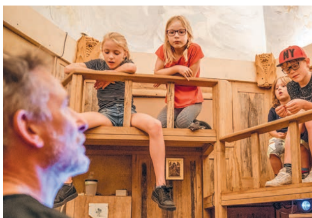
Verteltheater in het Bruggehuisje.

Voor liefhebbers van films uit verre landen vertoont het World Cinema Festival gratis drie wereldfilms, onder meer op het gezellige Marie Heineken Plein. In 'Loving' moet een gezin uit Rio de Janeiro een kind loslaten voor een voetbalcarrière. In 'Supa Modo' wordt een ongeneeslijk ziek meisje door het hele dorp aangemoedigd haar droom te verwezenlijken door even een superheld te zijn. De derde film is nog een verrassing. Zie voor data en locaties: www.worldcinemaamsterdam.nl