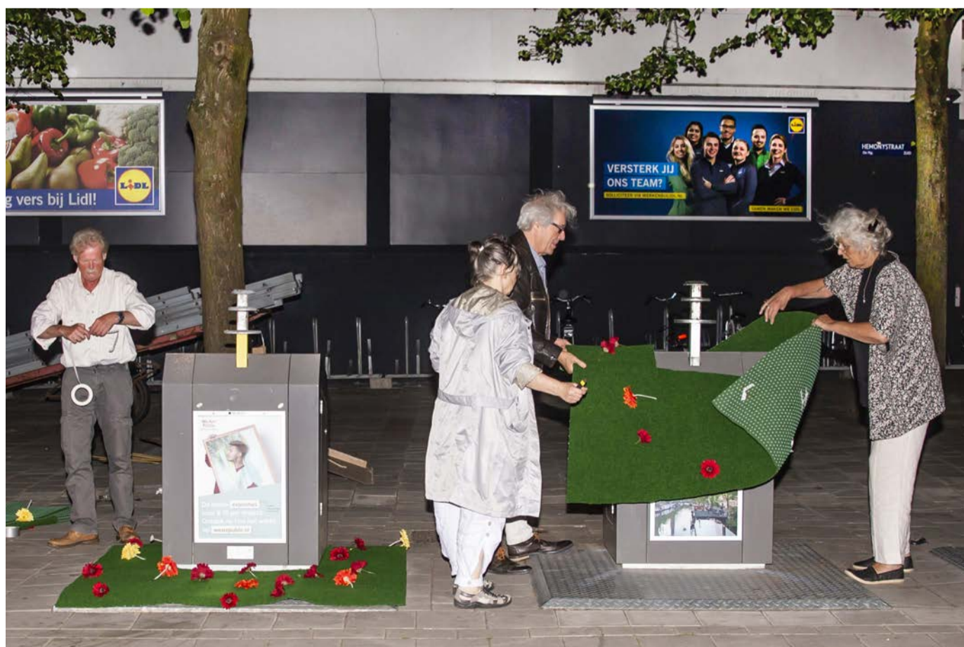
Actie in de avondschemering: het team van de Schone Pijp legt kunsttuinjes aan tegen de vervuiling rond de ondergrondse afvalcontainers