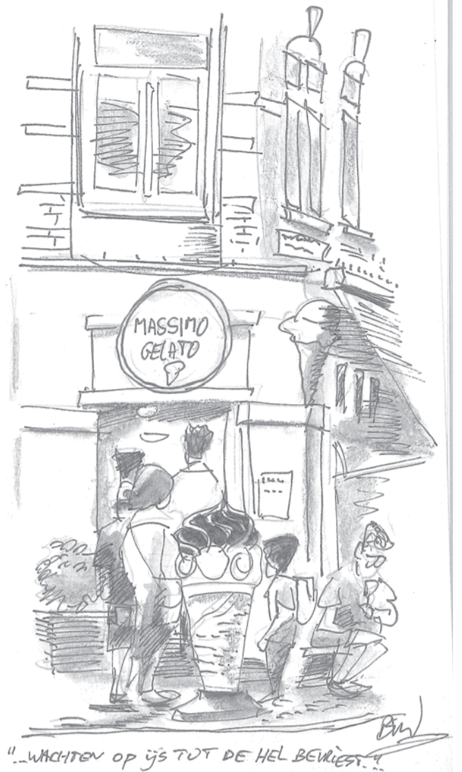
Ijssalon Massimo 2e v/d Helststraat (mei 2018)