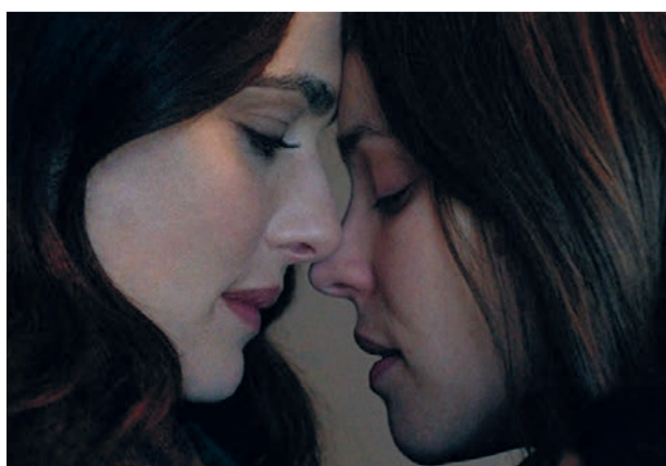
'Disobedience' in Rialto