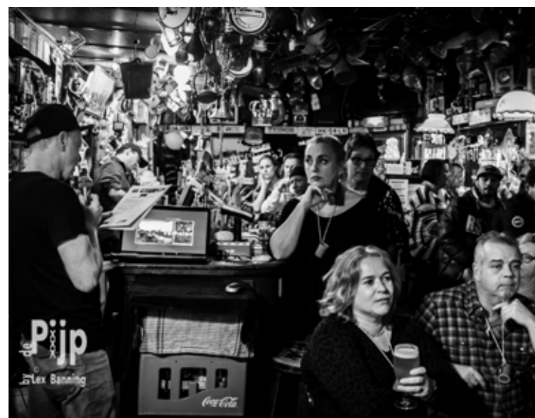
Opperste concentratie tijdens de pubquiz in café Hermes .

Vrijdag 23 maart 20:00 uur, café Hermes , Ceintuurbaan 55.