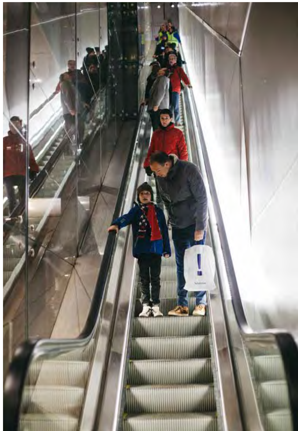
Foto midden en boven: metrostation De Pijp tijdens de open dag op 21 januari

Zesentwintig meter lager blinkt inmiddels het zo goed als klare metrostation De Pijp, dat op diezelfde dag in januari voor het laatst bezocht kon worden, voordat het deze zomer echt open gaat. 'Indrukwekkend', 'Wauwie' en 'Allemachtig wat een lange roltrap', waren de meest gehoorde kreten. Maar ook 'Grijs', 'Saai' en 'Wat weinig bankjes', want er moest wel wat te klagen overblijven. Wie ook stations als Rokin en Centraal Station bezocht, kon inderdaad vaststellen dat we er in De Pijp een beetje bekaaid afkomen. Maar dat heeft alles te maken met de omstandigheden in de bodem, daar beneden. De twee metrobuizen liggen door de palen onder de huizen immers onder elkaar in plaats van naast elkaar en dus is er nergens ruimte voor een beetje armslag in de breedte. Wat meer kleur,