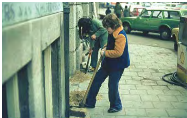
Links: de eerste tegellichters, 1975. Rechts: de eerste gevel'tuin'.

Ooit begon het met het lichten van een tegel. En toen nog een, en nog een. Dit staaltje van burgerlijke ongehoorzaamheid werd in het wijkcentrum opgepakt en ondersteund. In De Pijp was het percentage groen per bewoner het laagst van de stad. Dat groen werd door iedereen gemist, maar de smalle straten en de dichte bebouwing beperkten de mogelijkheden. Tot in de jaren zeventig een paar bewoners een klimplant tegen de gevel aanzetten. Een voorbeeld dat door velen gevolgd werd. Een aantal bakfietssteams heeft destijds De Pijp doorgefietst en op deze wijze geveltuinen aan helpen leggen. De geveltuinen zijn inmiddels ingeburgerd; er zijn er duizenden, alleen al in De Pijp.