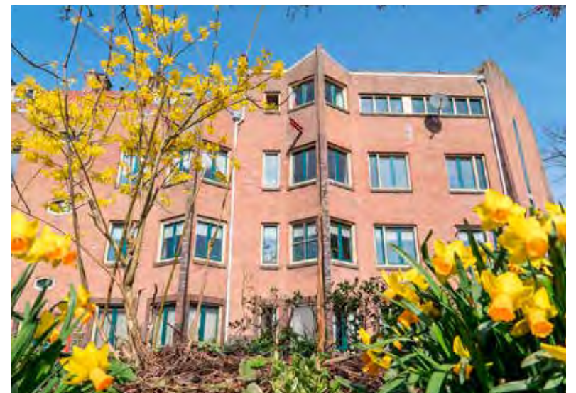
Voorjaar op de Jozef Israelskade.

Wijkcentrum De Pijp, Gerard Doustraat 133, 1073 VT Amsterdam | pijpkrant@wijkcentrumdepijp.nl | www.wijkcentrumdepijp.nl