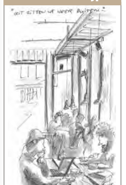
Coffee Company Van Woustraat (hoek Pieter Aertszstraat)