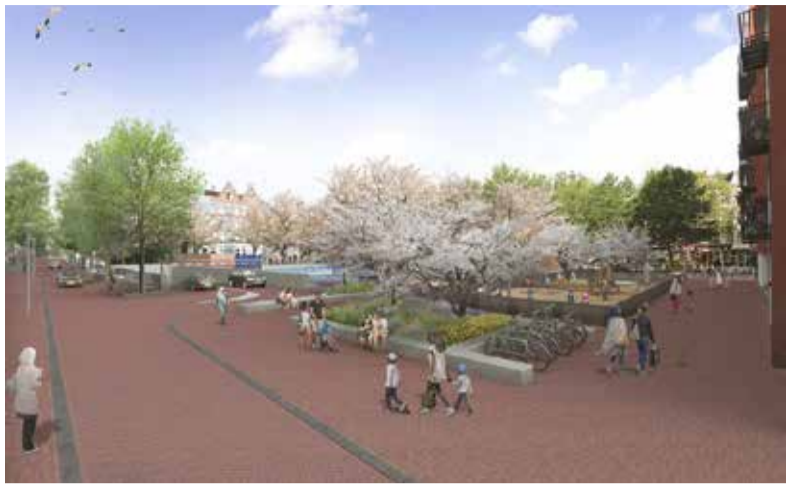
Boven en rechts: artist impressions van het Willibrordusplein na de bouw van de garage.