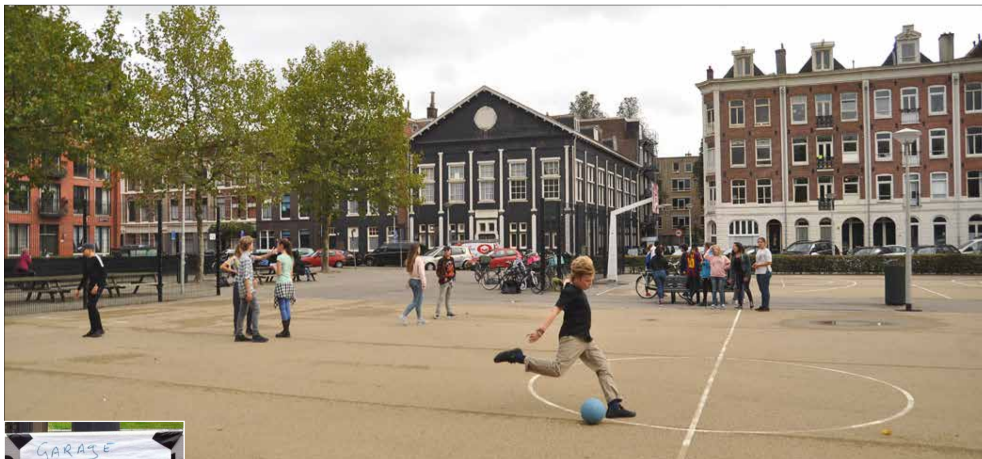
Boven: Het Willibrordusplein. Foto: Maarten Wesselink; onder: Storing bij een mechanische garage; daaronder: Het Willibrordusdwarstraatje waardoor de auto's zich doorheen moeten persen. Foto: M.W.