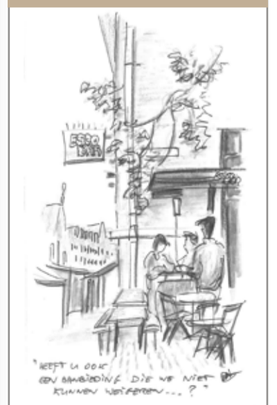
Escobar Eerste Sweelinkstraat