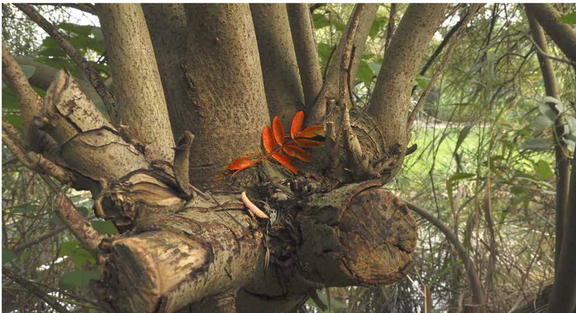
Sarphatipark, donderdagmiddag 12 oktober.