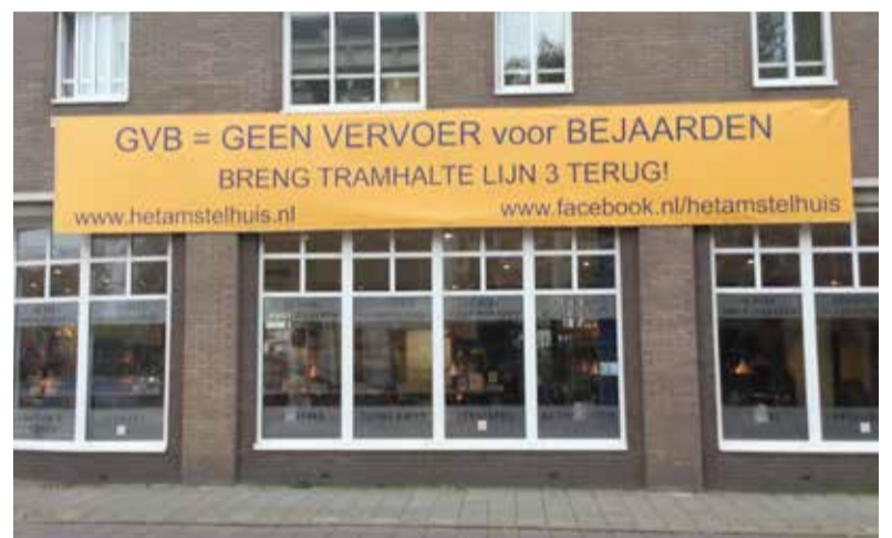
Ouderenwooncomplex het Amstelhuis aan de Ceintuurbaan wil de opgeheven tramhalte voor de deur terug. Bewoners moeten nu twee- tot driehonderd meter lopen naar de haltes aan de Van Woustraat.

Huurdersvereniging de Pijp | Wijkcentrum De Pijp | Gerard Doustraat 133 | info@hvdepijp.nl | www.hvdepijp.nl | 020 6621145 (maandags bereikbaar)