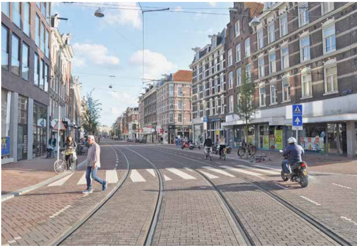
De vernieuwde Ferdinand Bolstraat.

In de vorige editie van De Pijp Krant stond een oproep waarin buurtbewoners en ondernemers werd gevraagd naar hun mening over de vernieuwde Ferdinand Bolstraat. Afgaand op de reacties houdt dit gedeelte van de Rode Loper de gemoederen flink bezig.