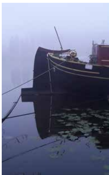
Mistige morgen aan de Amstel.