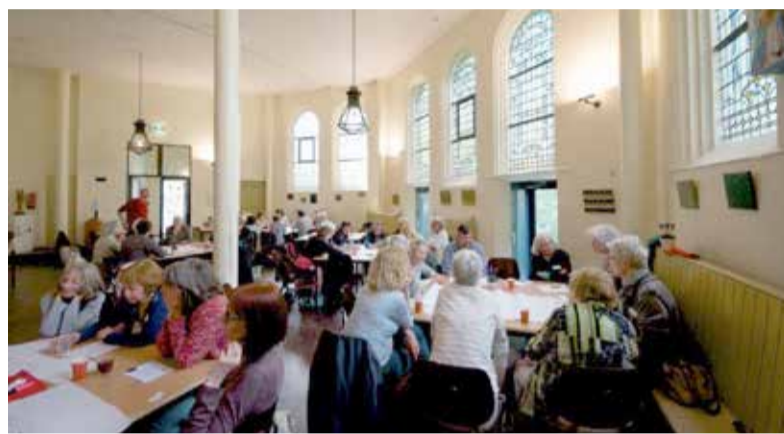
Informatiemiddag coöperatief wonen in de Oranjekerk op 11 mei