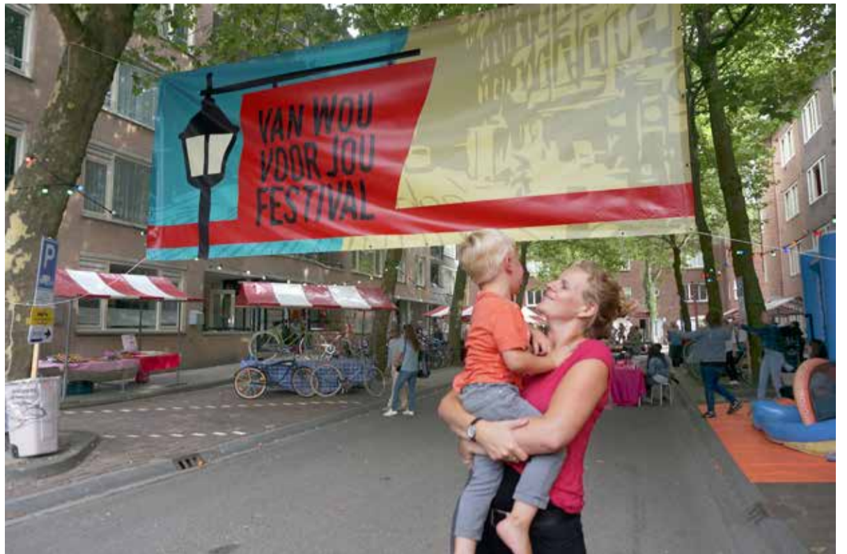
Impressies van het festival van afgelopen jaar.

Wat kunnen we verwachten als we ons een uurtje (of veel langer) willen vermaken in de Carillionstraat? Jordy: "Kraampjes met het lekkerste en leukste van wat de straat te bieden heeft, denk aan Surinaamse hapjes van Tjin's, wijn van Kok Op Stelten, ook Landmark is van de partij. Met daar tussenin lange tafels waaraan iedereen kan gaan zitten om te eten of te kletsen. Een podium is er natuurlijk ook, met live muziek. Nederlandstalig van Van Onder, Afrikaanse