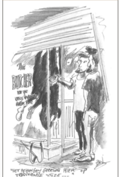
Hamburgerbar The Butcher Albert Cuyptstraat