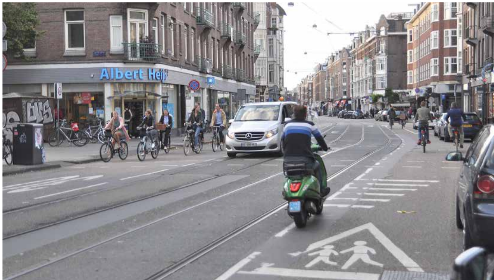
De rare 'knik' in de Van Woustraat die een rol gespeeld zou hebben bij het ongeluk.

De Van Woustraat speelde een hoofdrol in een strafzaak die in juli diende bij de Amsterdamse rechtbank. Het betrof de zaak tegen automobilist S.G., die op 5 mei 2014 daar een dodelijk ongeval veroorzaakte.