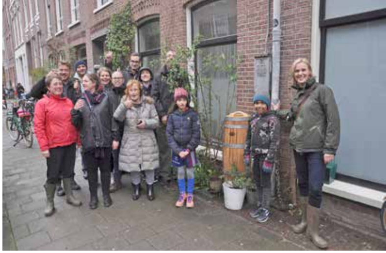
Plaatsing nieuwe regenton in de Quellijnstraat.

Wil jij ook een regenton in je (gevel)tuin? Doe dan mee met de regentonnen-actie van Natuur&Milieuteam Zuid. Je krijgt een fikse korting van 35% tot 40% op de prijs van de regentonnen.