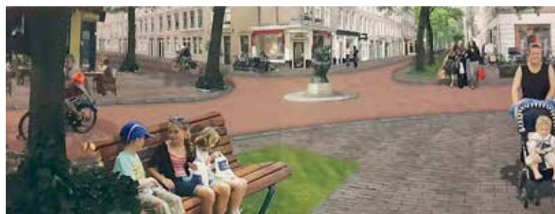
Impressie van hoe het is en hoe het zou kunnen worden in de Frans Halsbuurt.