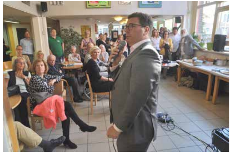
In het Huis van de Wijk was op donderdag 8 juni weer een bijeenkomst van de G250 Werkt! In werkgroepen zoeken bewoners, ondernemers, ambtenaren en politici samen naar oplossingen van problemen in De Pijp. Iedereen kijkt vanuit zijn eigen positie wat die kan bijdragen. Op hallodepip.nl zijn de resultaten te lezen van de verschillende werkgroepen: 'toegankelijkheid', 'duurzaamheid', 'de Pijp autoluw en laden & lossen', 'handhaving horeca-overlast en terrassen' en 'fietsparkeren'. De G250 is een initiatief van Wijkcentrum De Pijp in samenwerking met Stadsdeel Zuid.