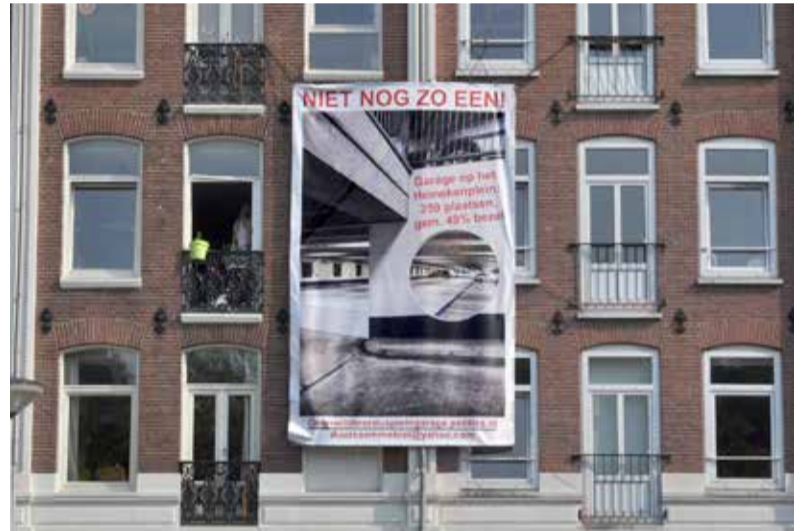
Nieuw spandoek van bewoners tegen de aanleg van een parkeergarage onder het plein. De vorige tekst 'Een parkeergarage onder het Willibrordusplein nergens voor nodig' is vervangen door 'Niet nog zo één'. Een verwijzing naar al bestaande leegstaande garages in de buurt.

Sebastiaan Capel Portefeuillehouder Kunst en Monumenten