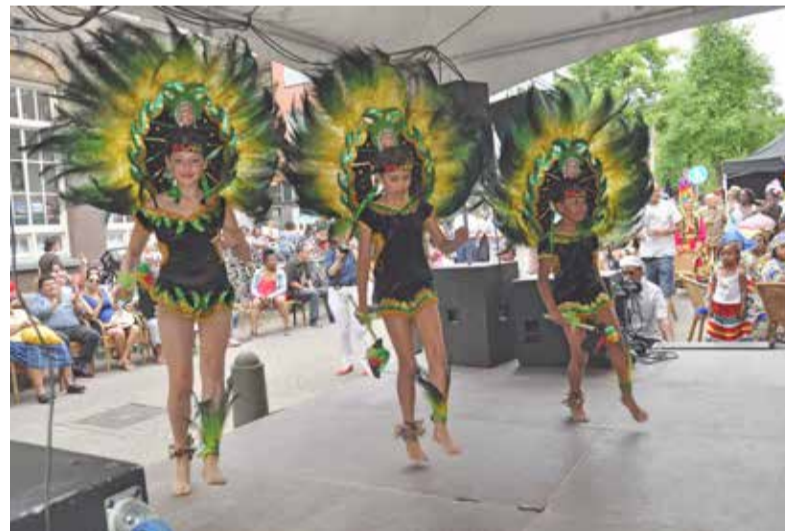
Keti Koti in De Pijp. Viering van de afschaffing van de slavernij op 10 juni bij Café Mansro in de Eerste Sweelinkstraat. Op 1 juli 1863 schafte Nederland de slavernij af in Suriname en op de Nederlandse Antillen. Keti Koti betekent Ketenen Gebroken.