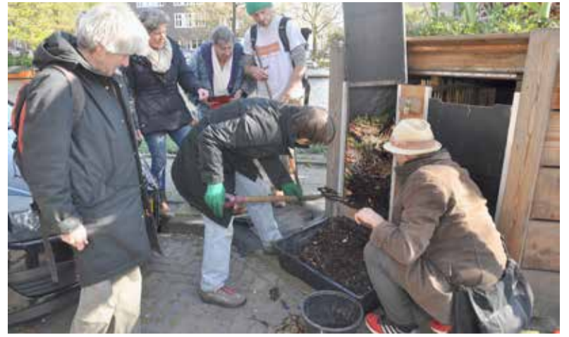
Buren rond de gemeenschappelijke compostbak in de Jozef Israëlskade.