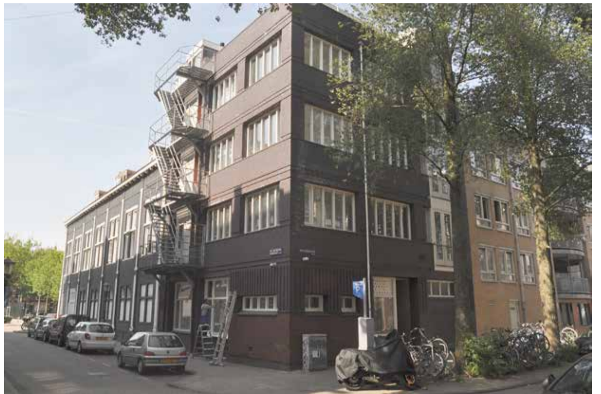
De Moskee Arrahman, Markez Dawat Tableegh in de Van Ostadestraat.

Voor de imam is de moskee geen debatclub. Hij besteedt geen aandacht aan