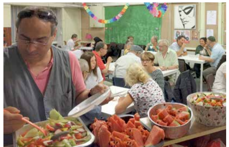
Wijkcentrum De Pijp en Encemo organiseerden een iftar-maaltijd voor Pijpbewoners op donderdag 22 juni in Buurtgebouw Henrick de Keijser. Vooraf sprak men met elkaar over de multiculturele Pijp.

Huurdersvereniging de Pijp | Wijkcentrum De Pijp | Gerard Doustraat 133 | info@hvdepijp.nl | www.hvdepijp.nl | 020 6621145 (maandags bereikbaar)