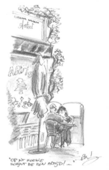
Libanees Restaurant Artist Tweede Jan Steenstraat