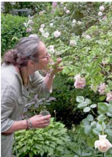
Opentuinendag De Pijp op 10 juni in een tuin aan de Eerste Jan van der Heijdenstraat.