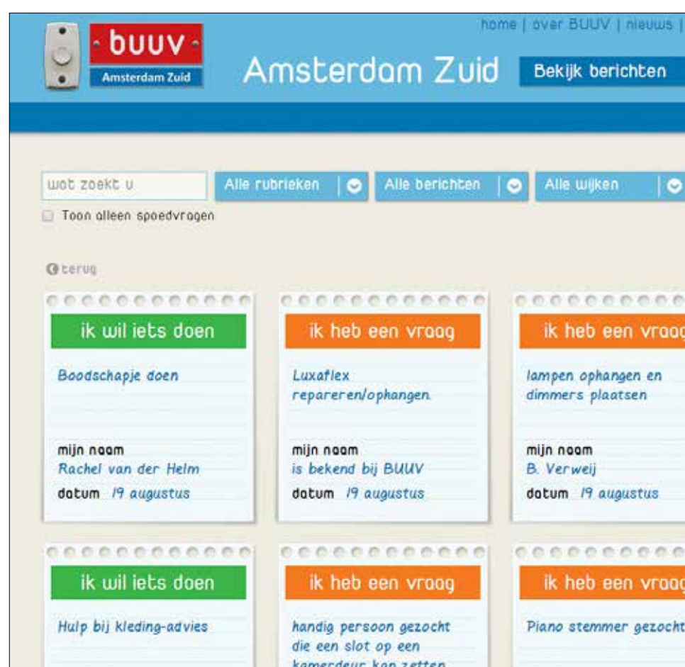
Boven: BUUV is een buurtmarktplaats voor vraag en aanbod van diensten voor bewoners in Amsterdam Zuid. Diensten als koken, gezelschap of boodschappen doen, onder het motto 'beter een goede BUUV dan een verre vriend' (www.buuv.nu). Rechts: De Gemeente Amsterdam heeft onder het motto 'pak je kans' een groot aantal extra's in petto voor Amsterdammers met een krappe beurs. Deze pagina op www.amsterdam.nl/werk-inkomen/pak-je-kans/ geeft info over het krijgen van lesgeld voor bijvoorbeeld een schildercursus voor een (schoolgaand) kind.