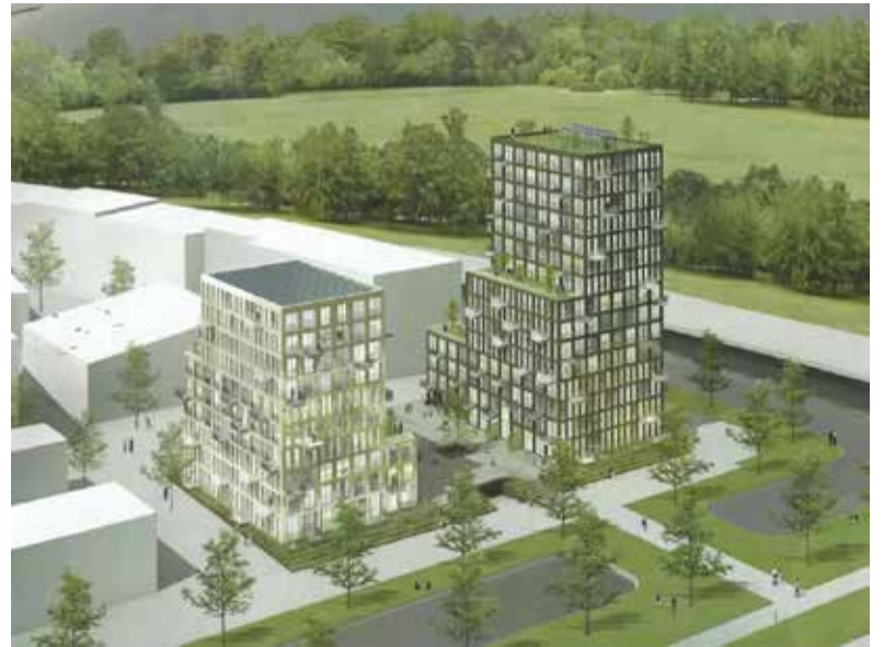
De Alliantie bouwt voor de Vereniging Akropolis Amsterdam een toren voor 55plussers met 86 'levensloopbestendige' huurwoningen (artist impression).

Kern van al deze vormen is het nemen van initiatief om meer regie op de eigen woningomgeving te krijgen. Tijdens Sa-