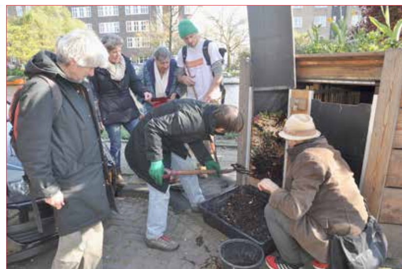
Buren oogsten compost.