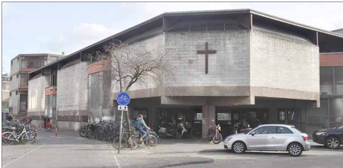
Het Afrikahuis.

Op ons artikel Wat te doen met het 'lelijke' Afrikahuis? zijn veel reacties binnengekomen. Het overgrote deel van de inzenders vindt het inderdaad een lelijk gebouw met een grauwe, koude buitenkant. Maar enkelen vinden het spannend of zelfs mooi. Iemand schrijft: Hou van het Afrikahuis.