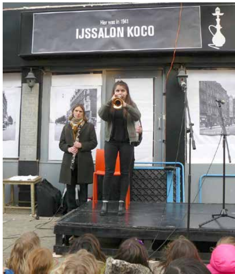
4 meiherdenking op de Van Woustraat verleden jaar.