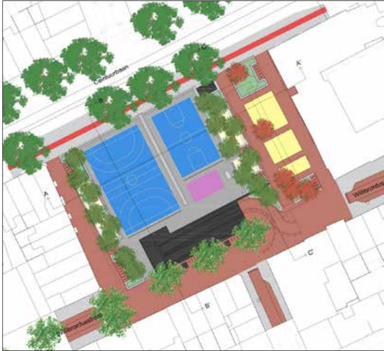
Schetsontwerp herinrichting Willibrordusplein na bouw ondergrondse parkeergarage