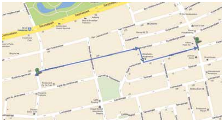
Route Stille Tocht: Van der Helstplein (start 19:40 uur) → Rustenburgerstraat → Korte Tolstraat → Pieter Aertszstraat → Van Woustraat 149 (voormalige IJssalon Koco)