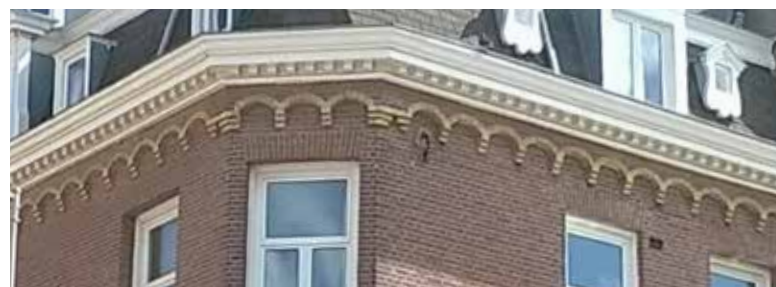
"Maar moet je die huizen verderop zien, die mooie boogjes. Die vind je overal in De Pijp."

Het ritme in de raampartijen is hetzelfde – alleen dan grootser. Er zijn vergelijkbare, mooie details in het metselwerk te vinden – alleen dan à la nu.