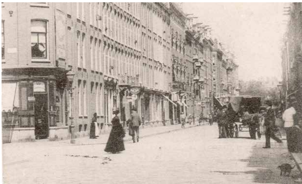
2 e Jan Steenstraat: uitsnede

Rond 1900 had Amsterdam een grote aantrekkingskracht op jonge kunstenaars. Velen vonden een onderkomen in De Pijp, een 'boheemsch' stukje Amsterdam met veel cafés, nachtgelegenheden en prostitutie. De schilder Leo Gestel was een van hen. "Hier voel je dat de wereld draait", zo verwoordde hij zijn keuze voor de stad.