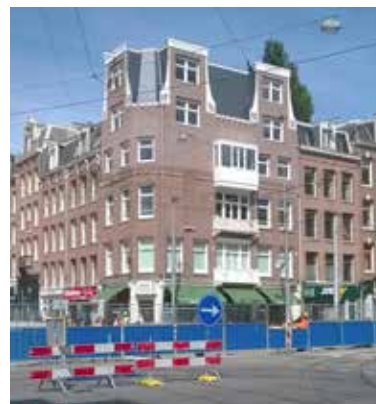
"Neem dat huis ertegenover (...) Dat is ook niet klein maar het heeft de menselijk maat."

'Mooie details in het metselwerk? Haha! Als je goed kijkt zie je alleen een paar stenen recht en een paar stenen averecht. Maar moet je die huizen verderop zien, die mooie boogjes en versieringen. Die vind je overal in De Pijp.