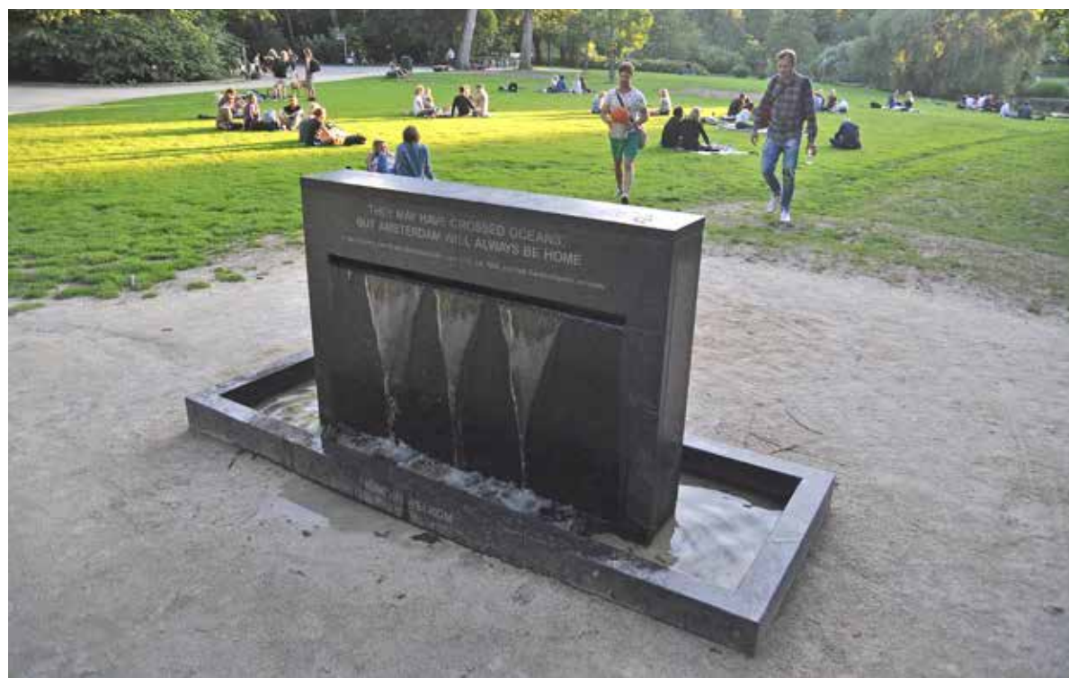
Gedenkstee in het Sarphatipark bij de ingang aan de 1e Sweelinkstraat. De steen is een monument ter ere van geëmigreerde Nederlanders en het is ook hondendrinkwaterplaats. Op 17 juni is het monument onthuld. De Pijp Krant komt er in de volgende editie op terug.