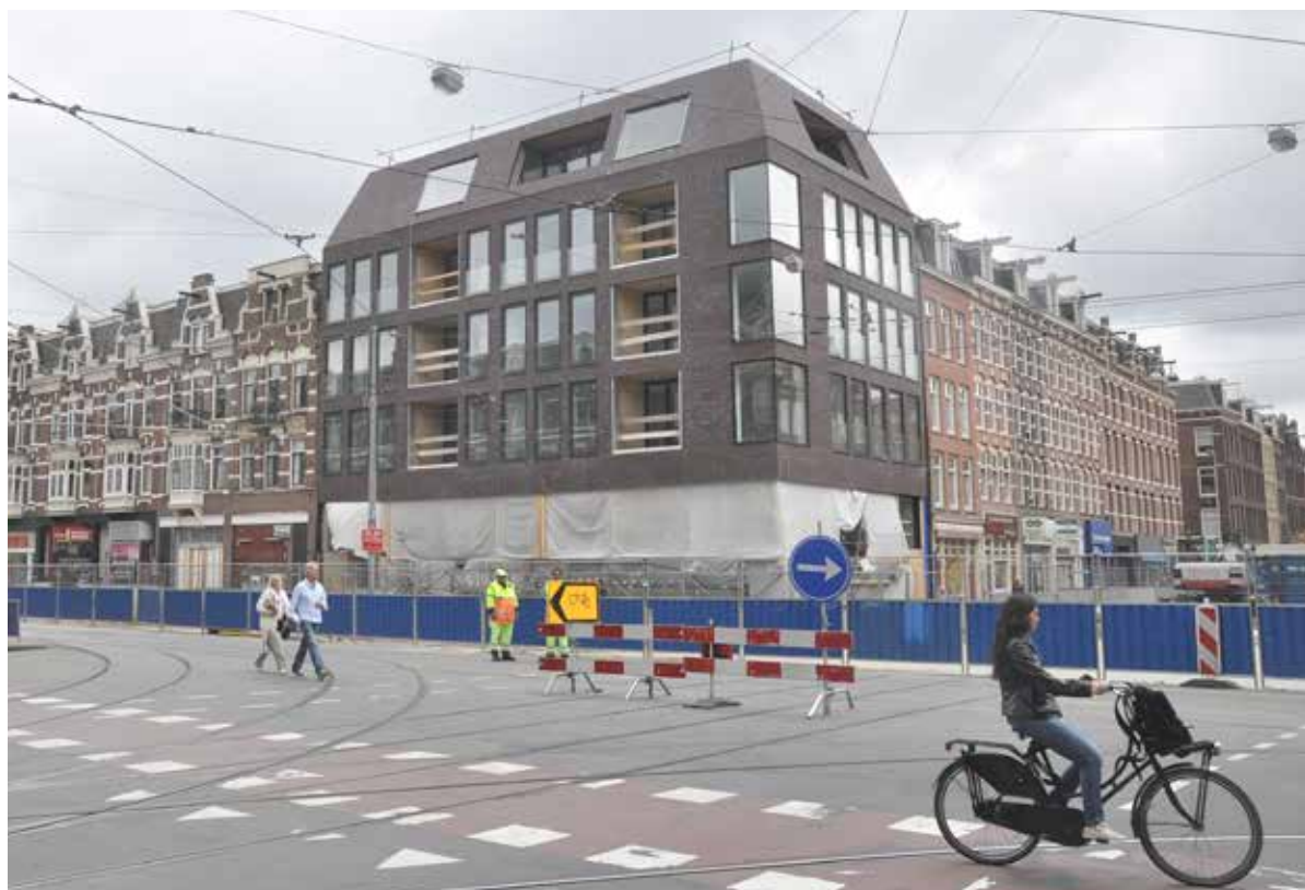
Het nieuwe metrostation op de hoek van de Ferdinand Bolstraat en de Ceintuurbaan.

Op de hoek van de Ceintuurbaan en de Ferdinand Bolstraat, schuin tegenover het nieuwe gebouw waarin de ingang van het Metrostation is, vraag ik een paar voorbijgangers naar hun mening over dit opvallende bouwwerk.