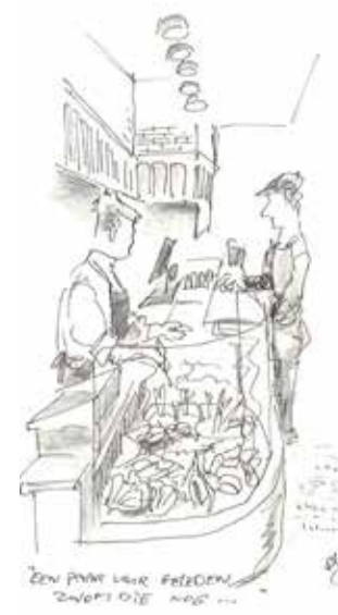
The Seafood Bar Ferdinand Bolstraat