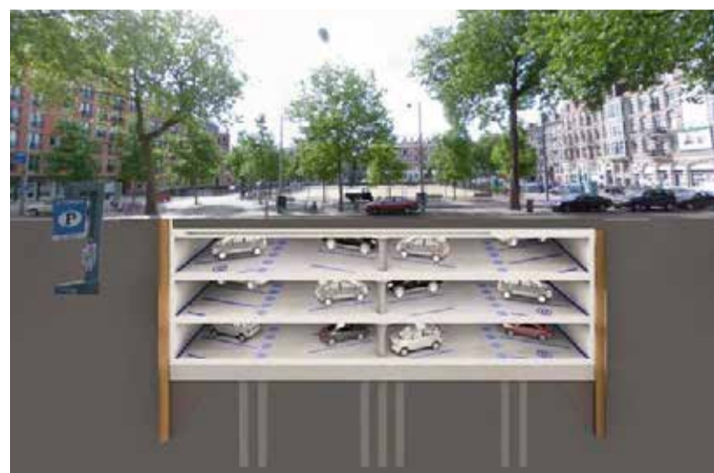
Artist impression van de parkeergarage onder het Willibrordusplein

Twaalf ondergrondse parkeergarages in Amsterdam. In het kader van de Uitvoeringsagenda Mobiliteit (UAM) is onderzoek gedaan naar de mogelijkheden voor nieuwe ondergrondse parkeervoorzieningen in negen gebieden in Amsterdam. Het hele project realiseert 2.520 ondergrondse parkeerplaatsen, samen zeven voetbalvelden aan ondergrondse parkeerruimte. De kosten zijn geraamd op 205,7 miljoen euro. De garage aan het Willibrordusplein wordt het meest kansrijk genoemd. De herinrichting van de Van Woustraat wordt verwacht in 2018. Daarbij verdwijnt een groot deel van de huidige parkeerplaatsen en daarom vindt de gemeente het wenselijk dat er zo snel mogelijk een nieuwe parkeervoorziening in de buurt wordt gerealiseerd. Meer informatie is te vinden in het Haalbaarheidsonderzoek https://www.amsterdam.nl/parkeren-verkeer/uitvoeringsagenda/actueel/locaties-parkeergara/