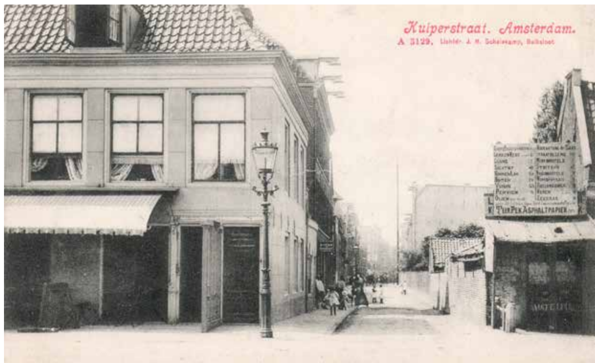
Tekst en prentencollectie: Ton van der Tas | Facebook/PrentenVanWeleer

De meeste mensen zullen niet direct zien dat dit de Kuipersstraat is en dat is niet zo gek, want de huizen links en rechts op de kaart staan er al lang niet meer. Deze kaart uit 1905 ademt nog een beetje de sfeer van de 19e eeuw, toen het hier Nieuwer Amstel heette maar de stad was aan het uitbreiden en steeds meer polderhuizen werden afgebroken om plaats te maken voor nieuwe woningen met twee of drie verdiepingen.