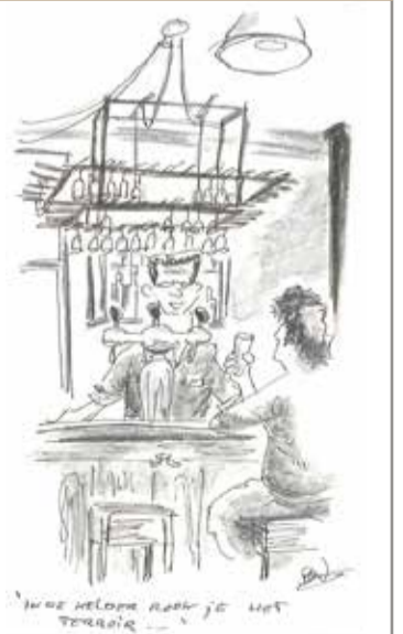
Wijnbar GlouGlou Tweede Van der Helstraat