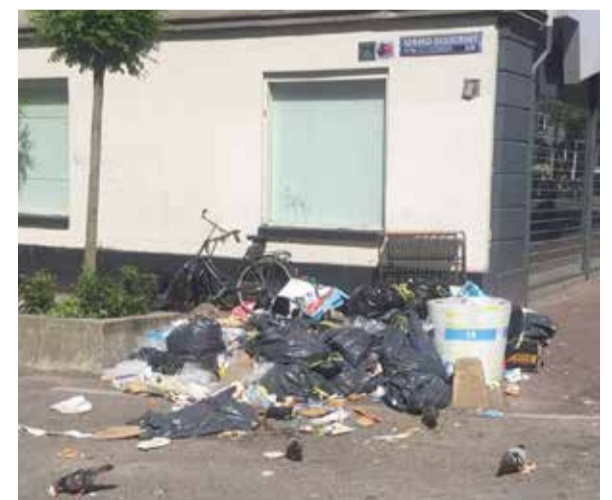
boven: Zaterdag 4 juni 2016: Gerard Doustraat.; rechtsboven: Maandag 16 mei 2016: Gerard Doustraat.; rechtsonder: Zaterdag 11 juni 2016: Gerard Doustraat.