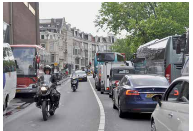
De Stadhouderskade spant de kroon wat vervuilde lucht betreft.