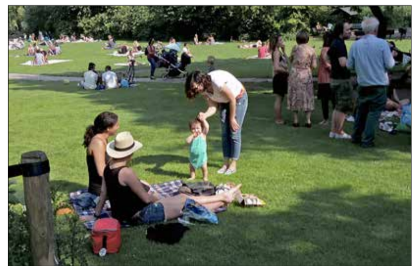
Sarphatipark: 4 juni om 17:08 uur.