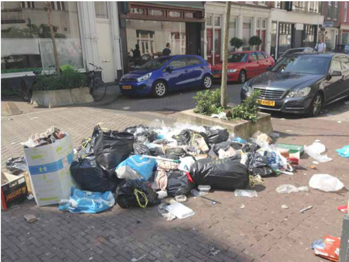
Zaterdag 4 juni 2016: Gerard Doustraat hoek Nicolaas Berchemstraat.