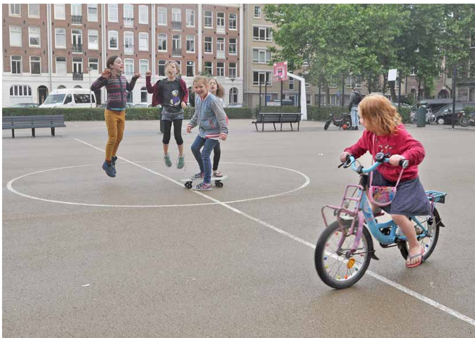
Willibrordusplein: spelen kinderen hier straks nog veilig?

De Willibrordusgarage moet het verlies aan (circa 130) parkeerplaatsen compenseren dat ontstaat bij de herinrichting van de Van Woustraat. Het plein waar kinderen dagelijks spelen gaat daarvoor op de schop. Buurtbewoners maken zich zorgen. Ton Damen: "Nu kan mijn oudste dochter zelfstandig met vriendinnetjes op het plein spelen. Dat kan straks niet meer als de garage wordt gebouwd. Andere speelplaatsen zijn te ver weg en bovendien kan ze de Van Woustraat niet zelfstandig oversteken."