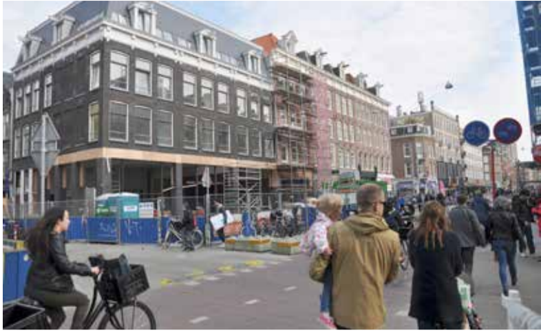
Zijn in de Ferdinand Bolstraat straks alleen nog vestigingen van grote winkelbedrijven?