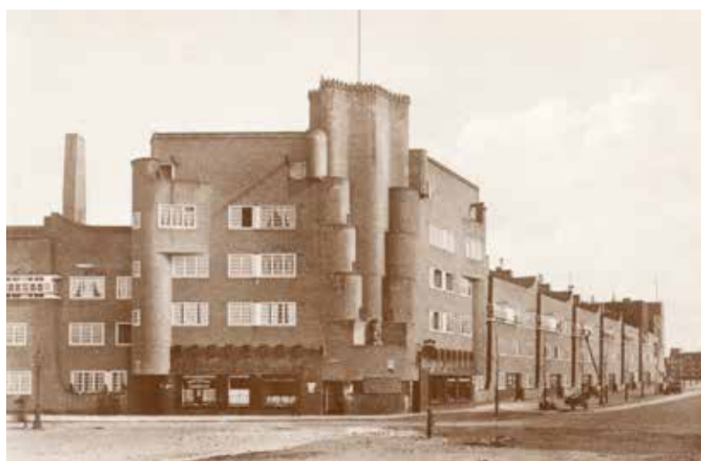
Links: Lente op het Henriette Ronnerplein. Boven: Het Dageraadcomplex direct na oplevering, ca 1925.

De Amsterdamse School, de bouwen ontwerpstyl uit de jaren tien en twintig van de vorige eeuw viert dit jaar haar 100-jarig jubileum.