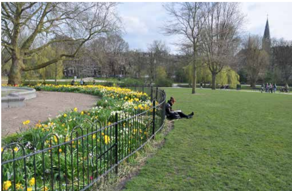
Lente in De Pijp.