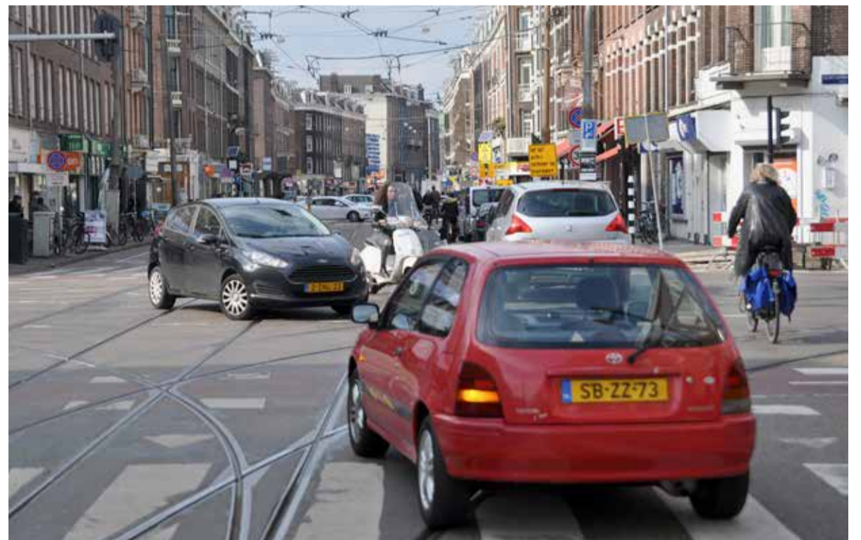
Kiest het stadsdeel in de Van Woustraat voor auto's of voor fietsers en voetgangers?

Als de nota wordt goedgekeurd komt er geen eenrichtingsverkeer, blijft de tram dubbelspoor en verdwijnen de parkeerstroken aan beide zijden van de straat. Wel blijven er plaatsen voor kort parkeren (winkelbezoek) en mogen auto's tot de parkeergarage klaar is op de stoep parkeren. Het zal van D66 afhangen of