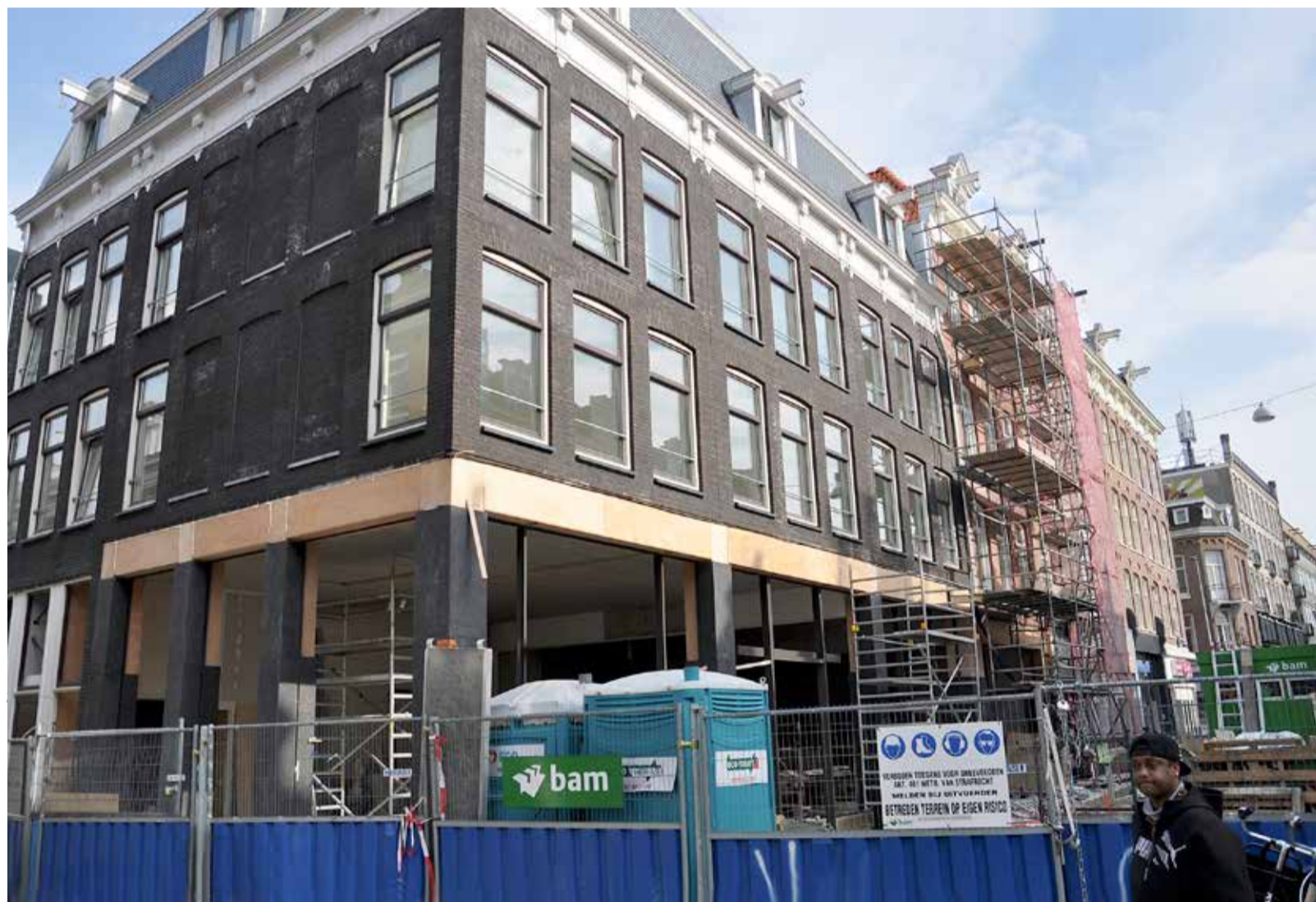
Kunnen in De Pijp straks drie winkelpanden en de etage erboven worden samengevoegd tot grote winkels zoals in de Kalverstraat?

Veel Pijpbewoners – tenminste zij die niet iets verkopen – zien die toeristen-