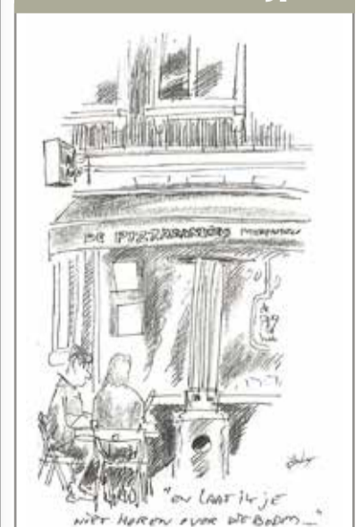
De Pizzabakkers 1e Sweelinkstraat