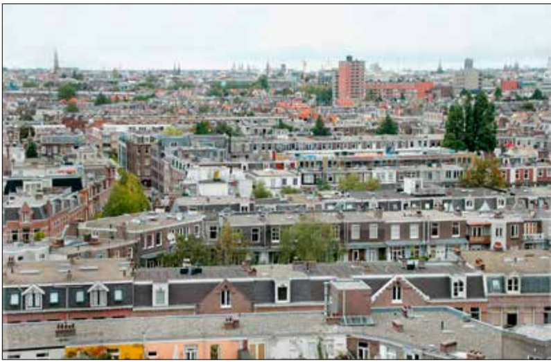
De Pijp in vogelvlucht.