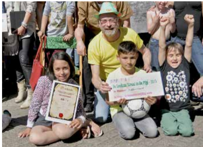
Bewoners Saffierstraat nemen de eerste prijs in ontvangst en wonen daarmee in 'de leukste straat van De Pijp'.

Donderdag 4 juni was het zo ver: de uitslag van de verkiezing Leukste Straat van De Pijp 2015, georganiseerd door deze krant.