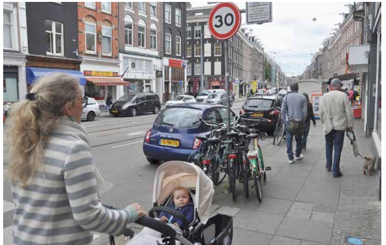
Stoep in de Van Woustraat gaat terug van 3,20 meter naar 2,20 meter.

Bij het opstellen van de conceptnota moet het stadsdeel rekening houden met gemeentelijk (verkeers)beleid. Dat bepaalt dat bij de herinrichting van de Van Woustraat fietsers en voetgangers prioriteit hebben boven tram en auto. Het stadsdeel heeft de belangen van alle gebruikers van de straat in kaart gebracht en ze tegen elkaar afgewogen. De voorkeur heeft de 30 km/u-variant waarin de stoep smaller wordt en de voetgangers er op achteruit gaan.