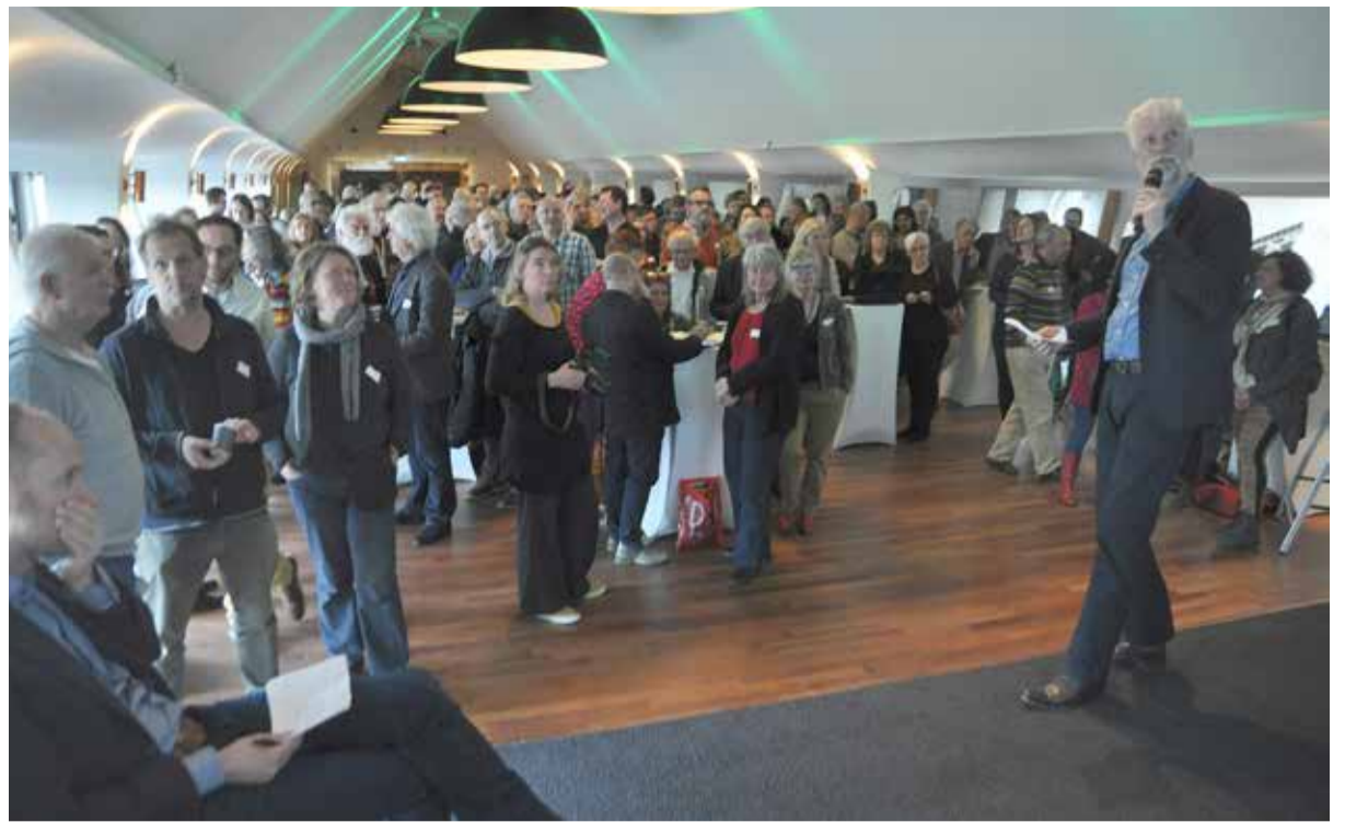
Inwoners en ondernemers uit De Pijp bijeen tijdens de Buurttop G250 in de voormalige Heineken Brouwerij.

De bestuurscommissie van Zuid, die heeft meegelopen deze Buurttop te organiseren, heeft beloofd met de resultaten van de Buurttop aan de slag te gaan. Maar er is ook actieve inzet nodig van bewoners en ondernemers om de gekozen voorstellen tot uitvoering te brengen. Samen maken we de buurt.