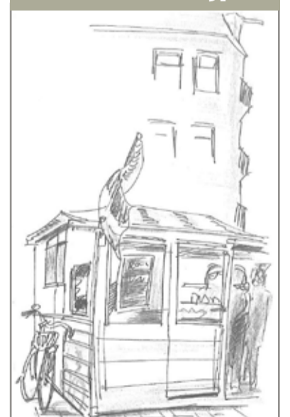
Haringstal Cornelis Troostplein