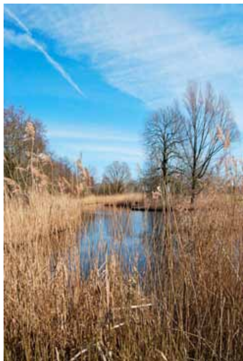
't Kleine Loopveld

Aan de rand van het riet bloeien paarse rietorchissen tussen margrietten en ratelaars. De rietkragen zelf vormen een ideale schuilplaats voor de kleine karekiet. Het icarusblauwtje fladdert over de hooilanden. Dit is een van de meest ecologische stukjes van het stadsdeel: 't Kleine Loopveld aan de Kalfjeslaan.