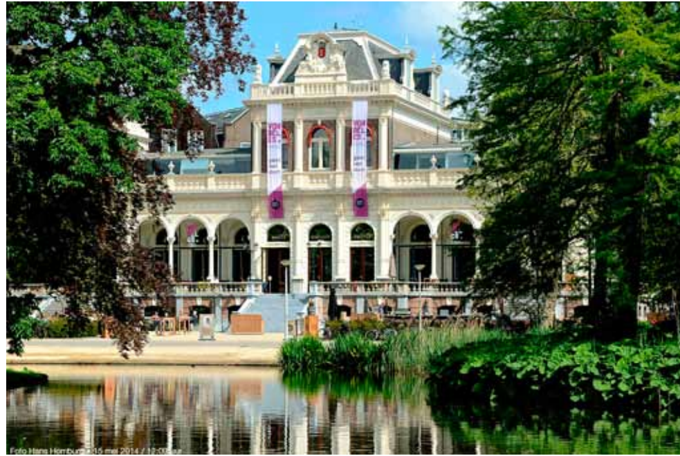
Toekomstige locatie van het Vondelpark Informatie Punt

Zo kan een donatie gekoppeld worden aan de plaatsing van een nieuwe parkbank of een romantisch rozenperk, eventueel met de naam van de schenker.