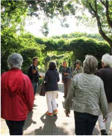
Vogelx excursie

Vrienden van het Gijsbrecht van Aemstelpark hebben eind 2014 een plan voor medebeheer en activiteiten ingediend bij de Bestuurscommissie Zuid.