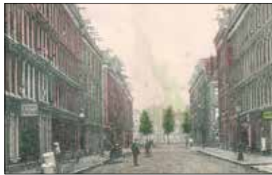
Prenten van weleer: Daniël Stalpertstraat. p07