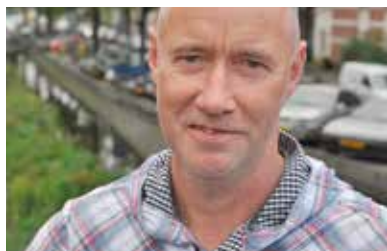
Klassen: 'Meer groen scheelt ook in kosten' p03