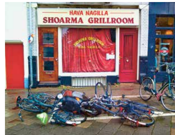
Vak die Fiets! 22 augustus 13.08 uur Cornelis Troostplein

Verder pagina 3: Vrijwilligers watertuinen gezocht | Repaircafé | Veel woningen in Amsterdam-Zuid nog steeds niet energiezuinig | Pagina 5: Rommelmarkt in Plan C | Gedicht voor overleden buurman | Column Edith Tulp Participeren in De Pijp | Pagina 6: Op het spreekuur... | Ten slotte: Miep Plug | DePijpFilippine | Pagina 7: 24uurs buurtlijn is er voor ouderen en kwetsbare bewoners in De Pijp | Pagina 8: Naschoolse activiteiten Combiwel | Wandelroute Ambacht In De Pijp | Bibliotheek Cinéto! programma september