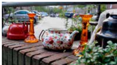
Nogmaals: De Leukste Straat van De Pijp. p08