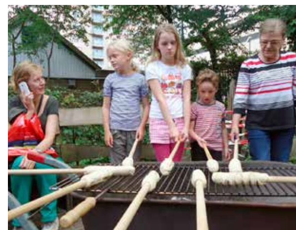
Stokbrood bakken 14 augustus 2014 14.20 uur Lizzy Ansinghstraat Kinderboerderij De Pijp

Deadlines Pijp Krant voor bewoners, instellingen en ondernemers: maandag 29 september en maandag 17 november 2014