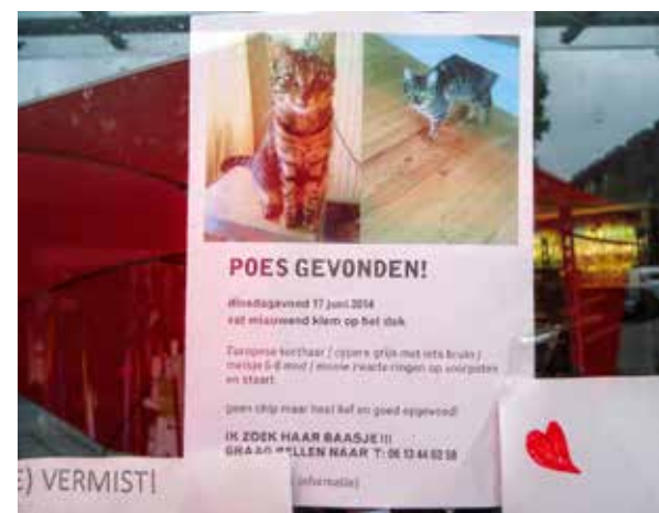
Gevonden! 17 augustus 2014 15.30 uur Henrick de Keijserplein