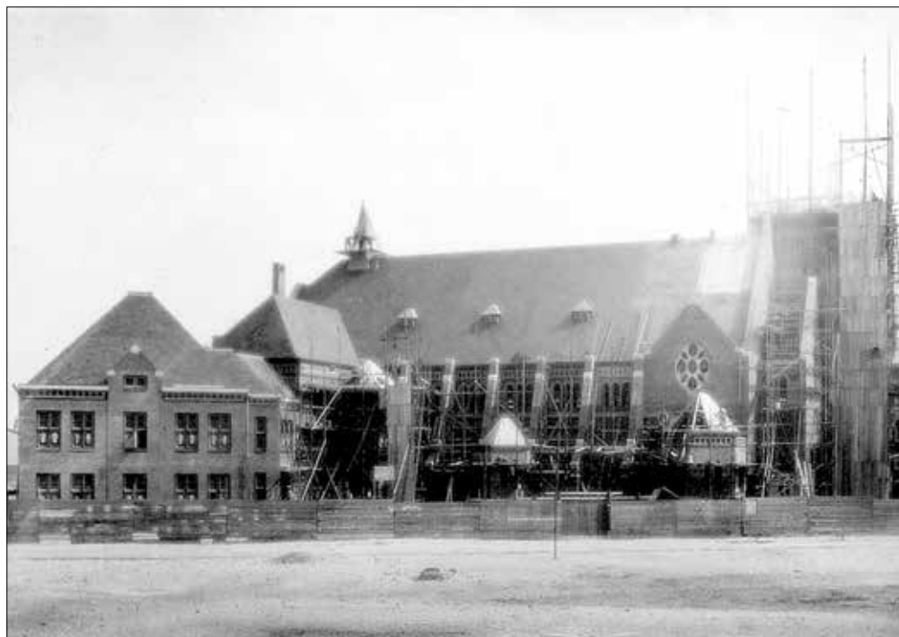
Boven: De Vredeskerk in aanbouw rond 1924; onder: de kerk anno nu.