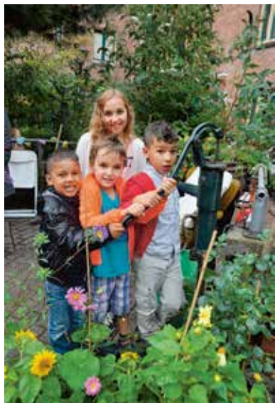
Saffierstraat: Leukste Straat van de De Pijp? p05