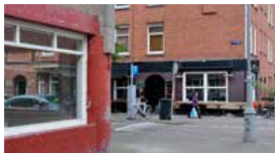
Reuring en ophef op Henrick de Keijserplein. p04