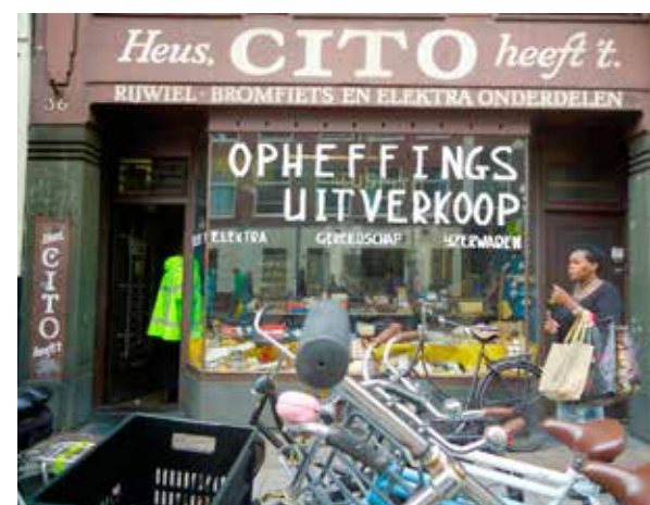
Opheffing 16 augustus 2014 14.48 uur Ferdinand Bolstraat