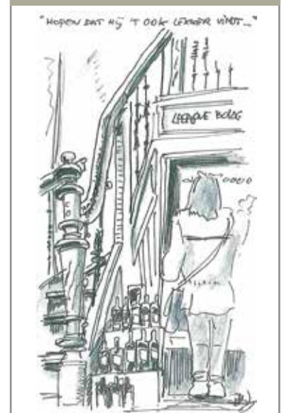
Traiteur Stach Van Woustraat

Stuur of mail uw oplossing naar Redactie Pijpkrant, Wijkcentrum Ceintuur, Gerard Doustraat 133, 1073 VT Amsterdam, o.v.v. oplossing filippine september 2014. Mail: pijpkrant@wijkcentrumceintuur.nl Onder de goede inzendingen worden 2 vrijkaartjes verloot voor Rialto. | Oplossing zomernummer wijkcentrum | Winnaar I.Djuly, Quellijnstraat De redactie van De Pijp Krant dankt Rialto voor het gratis beschikbaar stellen van deze kaartjes.