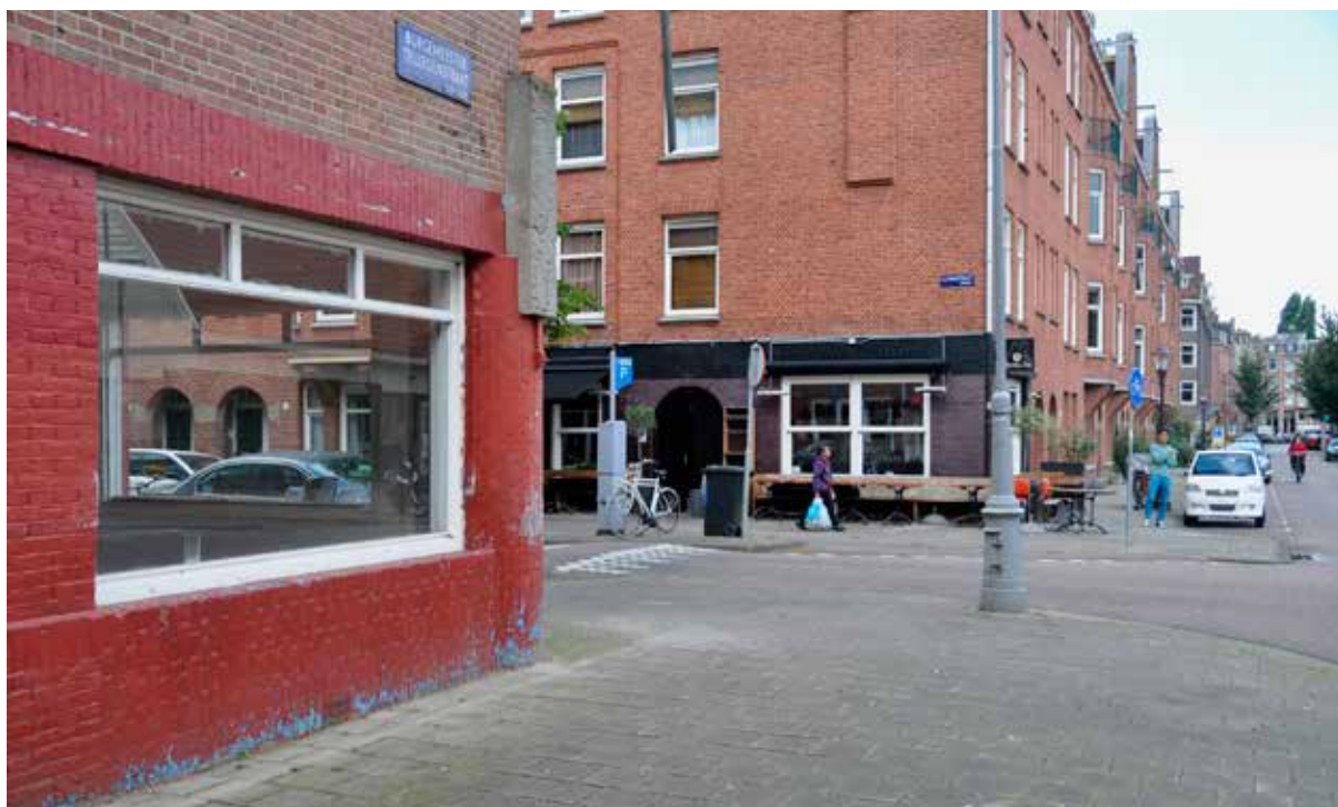
Buren vrezzen horecabestemming voor voormalige groentewinkel.

Het Stadsdeel heeft aangegeven de horeca in De Pijp meer te willen spreiden. Op dit moment zijn stukken van bijvoorbeeld de Van der Helststraten, de Van Wou en de Ferdinand Bol bijna onleefbaar geworden. Waar veel winkels en horeca uit de tussengelegen woonbuurten zijn verdwenen, moet opnieuw de mogelijkheid komen voor ondernemers om een zaak te beginnen. In de 'plint' van het Henrick de Keijserplein mogen twee horecagelegenheden komen. Het Stadsdeel heeft Reuring er zelf op gewezen, zegt Wouter: 'Veel bewoners willen het ook, een beetje meer leven in de buurt. Zeker als je er leegstand mee oplost.'