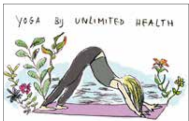
Gespot in De Pijp: Unlimited Health. p07