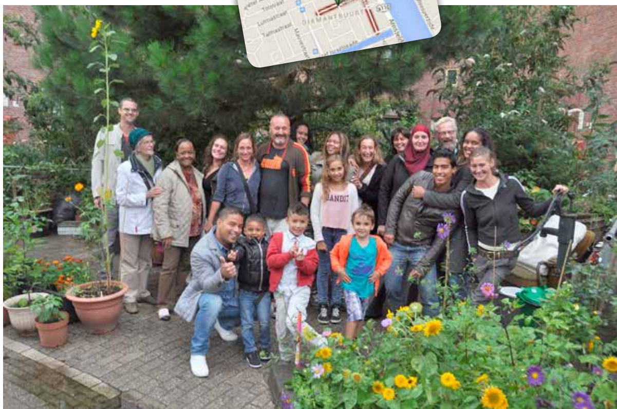
De trotse bewonersgroep van de Saffierstraat.

Van Maaren wil zijn buurt en straat duidelijk van een andere kant laten zien: "Ik hoef in de ochtend maar door de straat te roepen dat ik de barbecue neerzet en het is weer net zo druk als de vorige keer. De straattafel zorgt ervoor dat de drempel voor nieuwe bewoners om elkaar te ontmoeten laag is en geeft ze bovendien de gelegenheid om hulp te vragen of informatie uit te wisselen. Ook met oud en nieuw zetten we een tafel