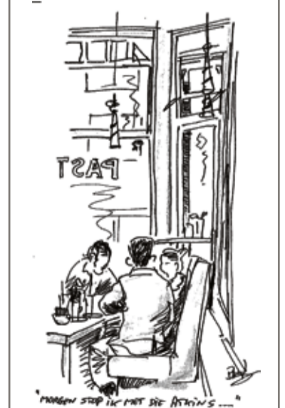
Koffiebar Pasticceria Van Woustraat