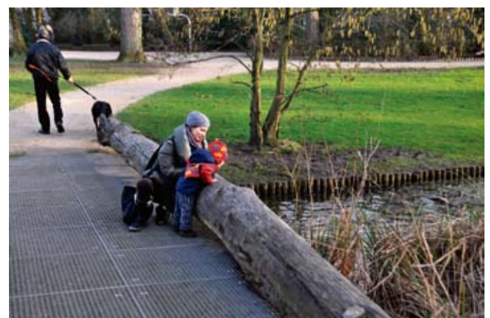
Lentetafereel in een (nog) niet winters Sarphatipark.