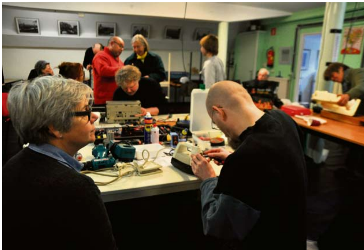
Reparateurs aan het werk in de vernieuwde ruimte van de Voedselbank aan de Lutmastraat.

Veel - vooral moderne - spullen lijken inderdaad een onneembare vesting. "Fabrikanten hebben liever dat we een nieuw apparaat kopen als er iets stuk gaat," weet één van de klussers. "Maar met een schroevendraaier en een dosis lef kom je overal in, hoor. Daarna is het natuurlijk wel de vraag of je ziet waar het defect zit. Een compleet doorgebrande motor, daar doe je niets meer aan. Maar meestal zit er alleen een draadje los of heeft een zekering het begeven. Of er zit gewoon een hoop viezigheid tussen de onderdelen."