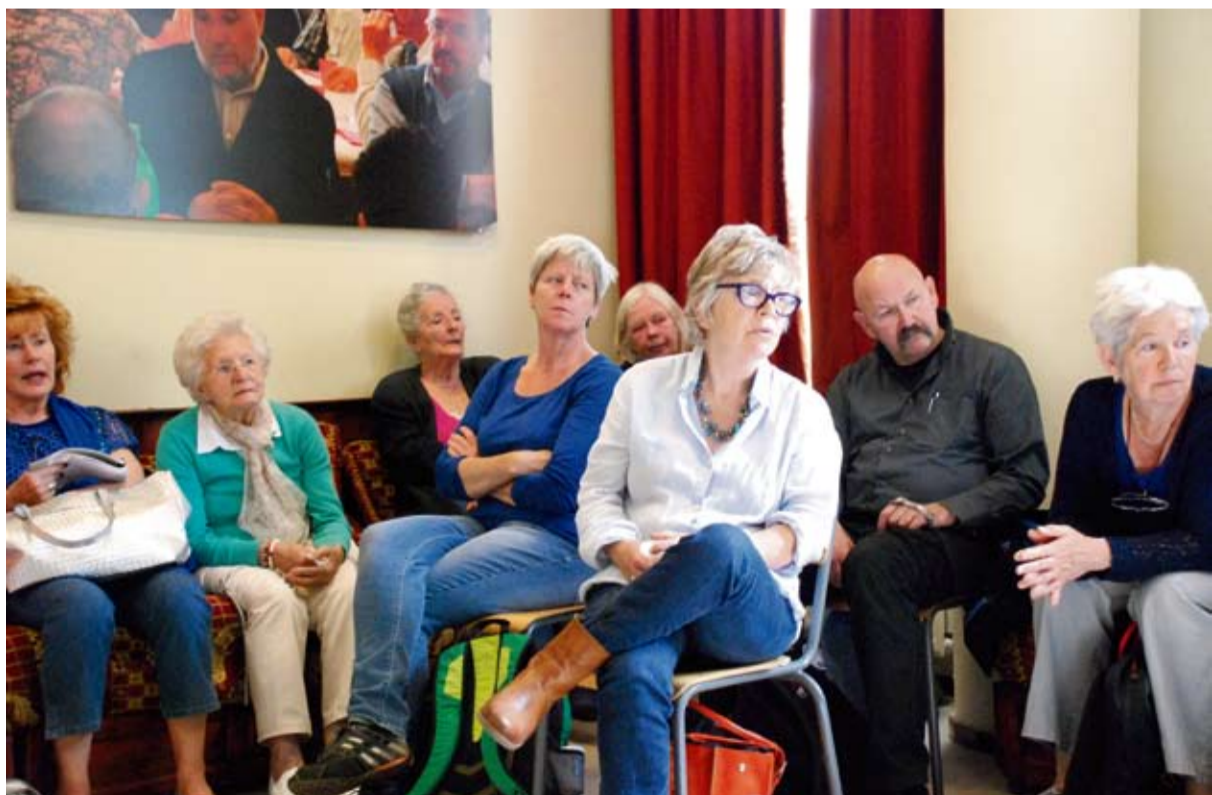
Belangstellenden tijdens een bijeenkomst van Stadsdorp De Pijp afgelopen jaar

Sinds juni 2013 is er al zeer veel tot stand gekomen. Er zijn elke maand Inloopavonden, stadsdorpers gaan nu maandelijks naar de film in Rialto en eten samen in