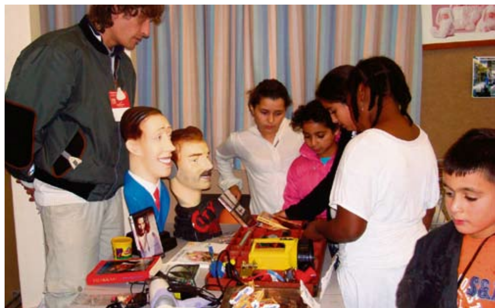
Burendag rondom het Henrick de Keijserplein in 2010.