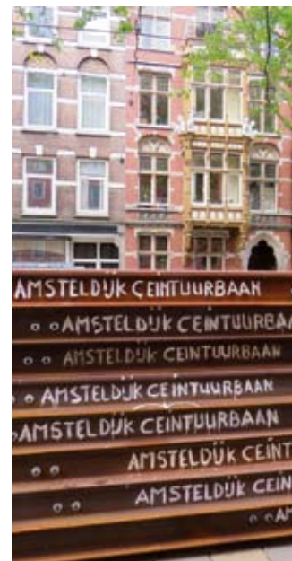
Drukke werkzaamheden op de Ceintuurbaan hoek Amsteldijk waar de tramrails worden vervangen en het wegdek vernieuwd.