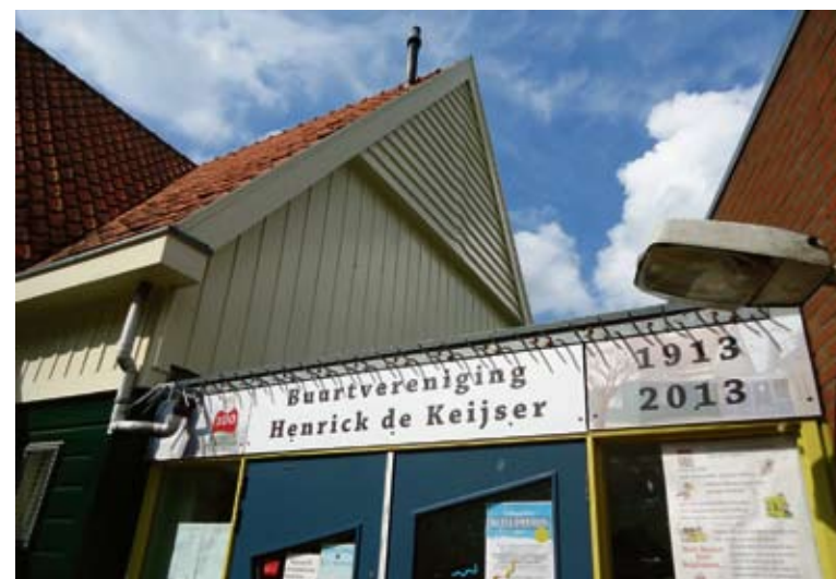
Buurtvereniging Henrick de Keijser bestaat 100 jaar.

Huurdersvereniging de Pijp | Wijkcentrum Ceintuur | Gerard Doustraat 133 | info@hvdepijp.nl | www.hvdepijp.nl | 020 6621145 (dinsdag bereikbaar, anders antwoordapparaat)