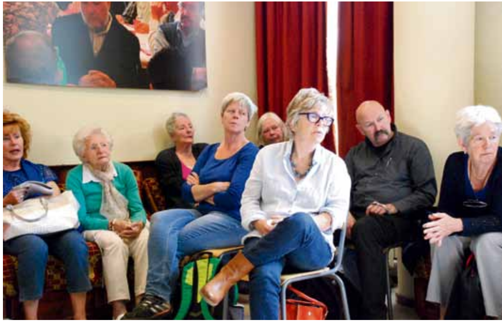
Belangstellenden tijdens de feestelijke bijeenkomst van Stadsdorp de Pijp