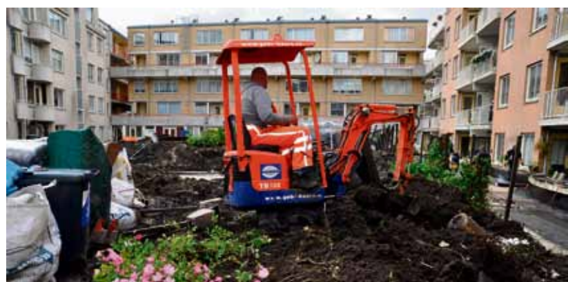
Tuin van het Huis van de Wijk De Pijp op de schop door lekkage in het dak van de parkeergarage.

'Goed', is altijd mijn antwoord op de vraag hoe het met me gaat. Maar ondertussen! Ik pieker me soms suf over veel technische klusjes die in huis blijven liggen. En ik ben al van een zekere leeftijd, wat nou als ik een lichamelijke makke krijg? Komt er dan een beroepsbetuttelaar? Groot was dan ook mijn opluchting toen een vriendin me vertelde dat er in Amsterdam stadsdorpen worden opgericht, ook in de Pijp. In een stadsdorp helpen buurtbewoners elkaar. Lees het hele artikel op pagina 3