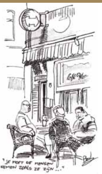
Café Mansro Eerste Sweelinckstraat