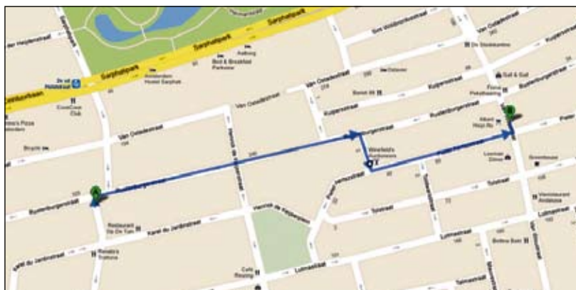
Route Stille Tocht: Van der Helstplein (start 19:45 uur) → Rustenburgerstraat → Korte Tolstraat → Pieter Aertszstraat → Van Woustraat 149 (voormalige IJssalon Koco)

Voor het project 'Oorlog in mijn Buurt' interviewden 78 kinderen uit De Pijp ouderen die tijdens de Tweede Wereldoorlog in De Pijp woonden. Twee kinderen lezen voor uit hun eigen interview (lees nu alvast