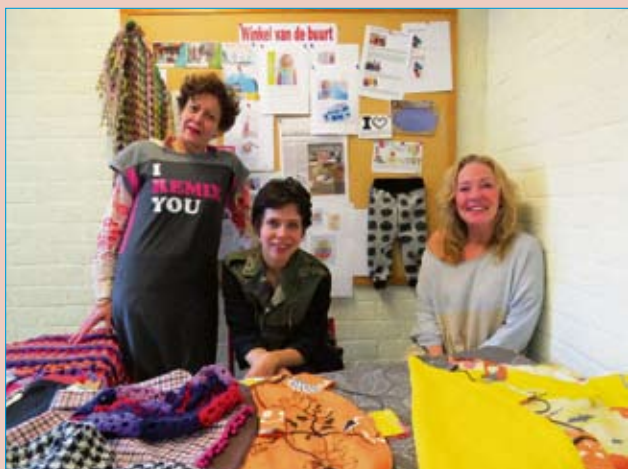
De initiatiefnemers van de Winkel van de Buurt de Pijp.