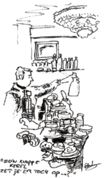
Deli 'Le Salonard' Eerste van der Helststraat