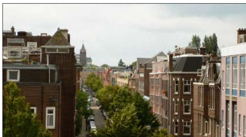
'Ik houd van de lengte van de Lutmastraat. Je hebt wel een stuk of vijf verschillende buurtjes in één straat.'

Oncko Grader is de redactionele spil namens Combiwel. Hij is de eerste die in 2X5 aan het woord komt. 2X5 is een portret aan de hand van twee maal vijf vragen: vijf over de persoon en vijf over het beroep.