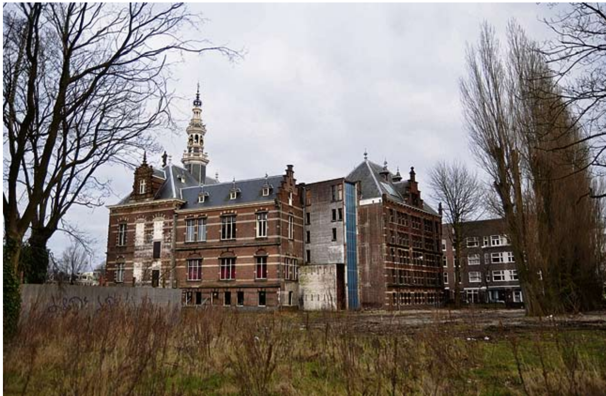
In het gebouw van het voormalig Gemeentearchief wordt een hotel met 150 kamers gerealiseerd.

Nadat het Gemeentearchief in 2007 uit het oude gebouw aan de Amsteldijk vertrok lag er een plan om het gebied opnieuw in te richten. Het moest een impuls geven aan de buurt, met een creatieve mix van wonen, cultuur, onderwijs en horeca. Als gevolg van de financiële- en woningmarktcrisis heeft het project lange tijd stilgelegen. Nu is er een nieuwe projectontwikkelaar gevonden. In het gebouw van de reeds op het terrein gerealiseerde IVKO-school, werd op 25 februari een volle zaal bijgepraat over de laatste ontwikkelingen.