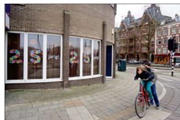
Woon- en zorgcentrum Amsteldijk, voorheen Tabitha, bestaat 25 jaar. Dit wordt het hele jaar door gevierd met tal van activiteiten.

Voor informatie en contact info@wijkcentrumceintuur.nl of tel. 6764800 en vraag naar Mayra Paula