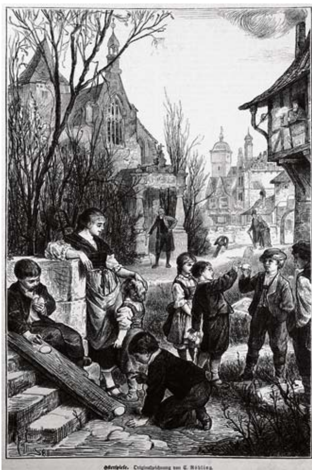
Paasspelletjes met eieren (C. Röhling, 1880)