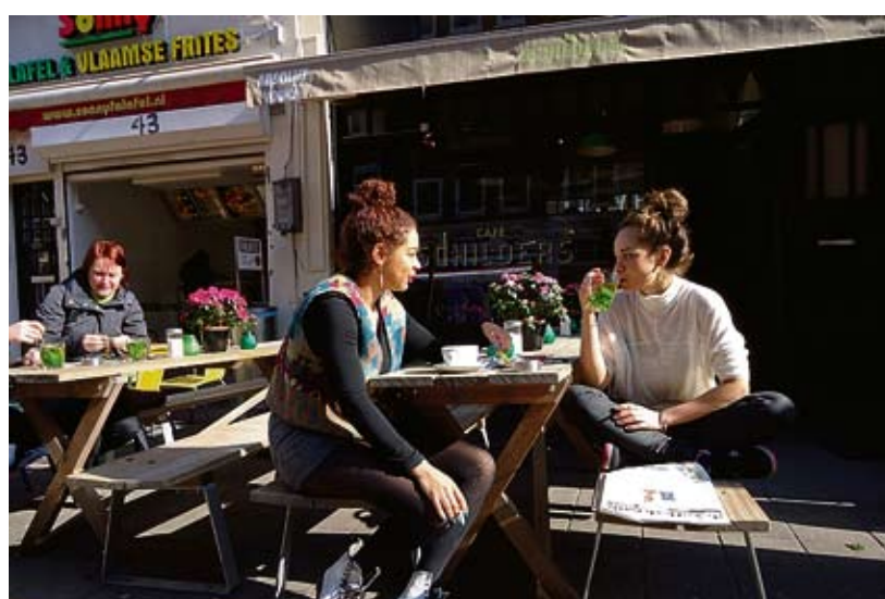
Dinsdag 5 maart was de warmste ooit gemeten! In De Bilt werd het 15,9 graden Celsius. Wie kon zat buiten en genoot – na een lange winter – van het weldadige lentezonnnetje. Hier in de Eerste van der Helststraat. Rechts: De Piet Kramerbrug - officieel 'Brug 400 Amsterdam' in renovatie. De brug ligt tussen de Jozef Israëlskade en de Amstelkade.