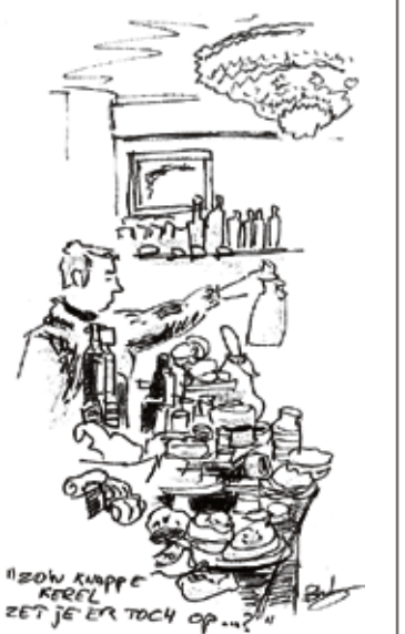
Deli 'Le Salonard' Eerste van der Helststraat