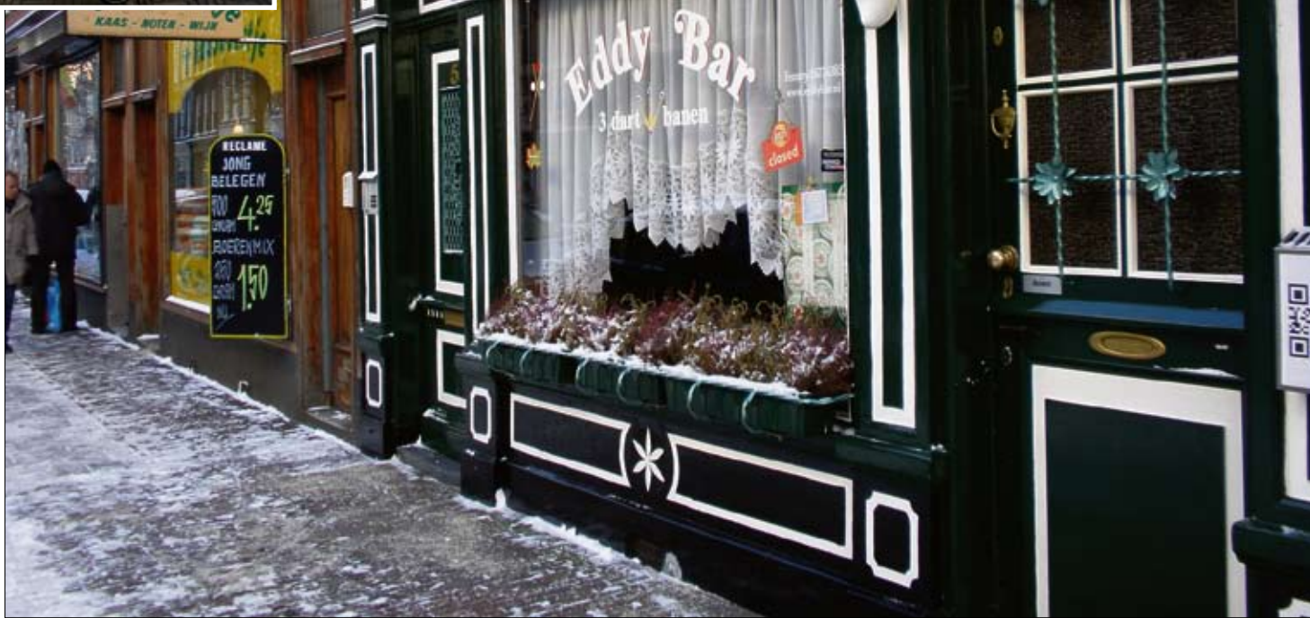
Eddy Bar en Fetch, bruin café en hip service bedrijf in de Oude Pijp. Een nieuwe generatie zorgt voor veranderingen in de buurt.

Iedereen kent het clichébeeld van de 'yup', strak in het pak, gehaast en luid bellend op straat. Sinds de stad vanaf de jaren negentig weer in trek is, hebben veel young urban professionals uit andere delen van het land zich in de Amsterdamse binnenstad gevestigd. Op de grachtengordel en de Jordaan hebben ze hun stempel al gedrukt en dat lijkt nu ook met De Pijp te gaan gebeuren. Hoe ervaren oudere buurtbewoners de veranderingen in de buurt, waarmee de sfeer van de volksbuurt met de tijd lijkt te verdwijnen?