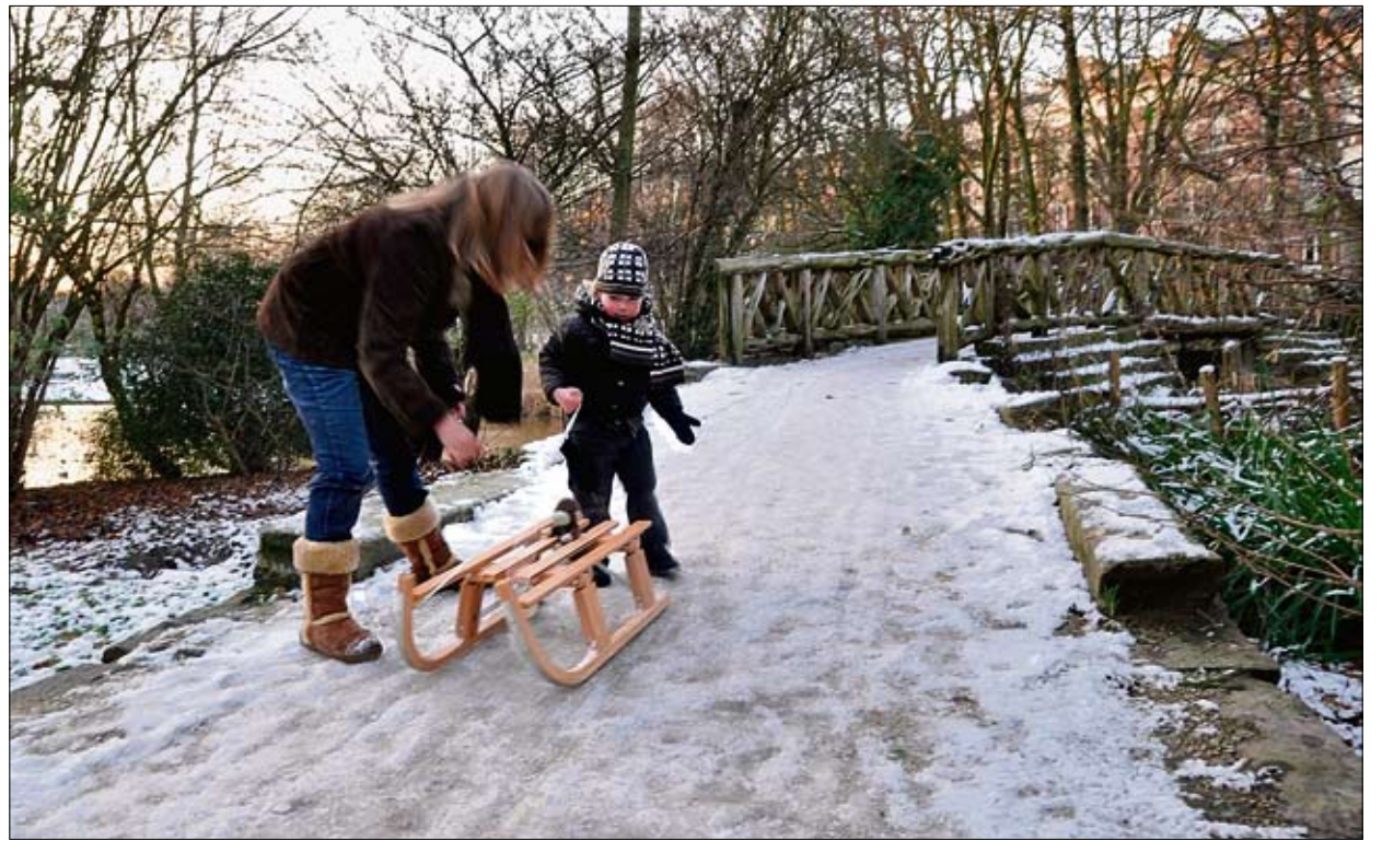
De slee voor de kerst al uit de kast. Sneeuwpret in het Sarphatipark.