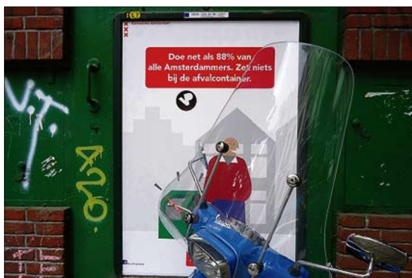
Links: In 2014 worden overal in De Pijp ondergrondse vuilcontainers geplaatst. Het stadsdeel denkt dat daarmee vuilniszakken en zwerfvuil uit het straatbeeld verdwijnen. Maar is dat ook zo? Rechts: De vijver in het Sarphatipark wordt uitgebaggerd. Daarom moesten de vissen verhuizen. Vrijwilligers van de Amsterdamse Hengelsportvereniging vingen ze, waaronder deze beschermde kroeskarper.