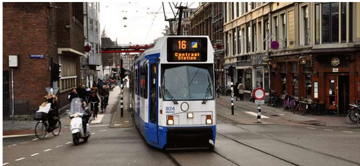
Past de 'Rode Loper' die vanuit het Centraal Station het traject van de Noord/Zuidlijn wordt uitgerold, wel in de Ferdinand Bolstraat?

Hoe gaat de Ferdinand Bolstraat er uitzien als de metro in 2017 klaar is? Het stadsdeel is al druk bezig met het voorbereiden van de herinrichting van de straat en heeft zijn 'verkeerskundig wensbeeld' al klaar. In januari gaat het de buurt raadplegen over de plannen en is er een 'bewoners inloopavond' in de Muziekcentrum de Badcuyp.