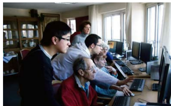
In het Huis van de Wijk en Amsta worden laagdrempelige computercursussen gegeven. (Zie ook artikel hierover op pagina 5.)

Open Huis op Zondag de Amsterdamse Vriendendienst bereidt alle zondagen van de maand (behalve de eerste) in het Huis van de Wijk de Pijp een drie-gangen menu voor € 5,00 ; Opgeven kan op telefoonnummer 020-6839260