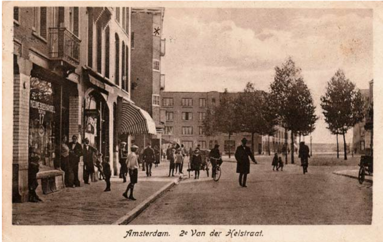
Amsterdam. 2e Van der Helststraat.