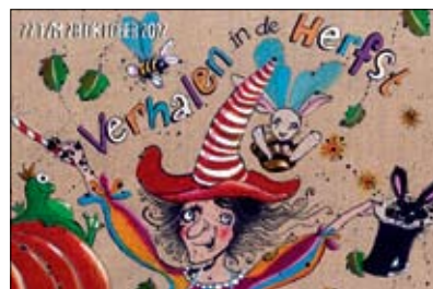
Jeugdfestival Verhalen in de Herfst

wo 21 november 15:00 uur en 20:00 uur; do 22 november 20:00 uur; Van Ostadestraat 233D