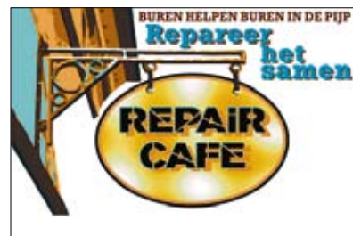
Repair Café De Pijp

Het volledige programma is te vinden op www.ostadetheater.nl (onder evenementen).