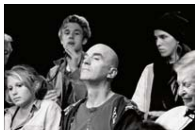
Ostadetheater: Mijn Buurt Mijn Stad

Vanaf 15 november in filmtheater Rialto, Ceintuurbaan 338