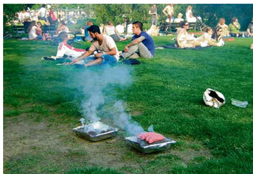
Wegwerpbarbecues funest voor Sarphatipark: na het warme pinksterweekend van verleden jaar zaten toen gelijk al 120 brandgaten in de voor 30.000 euro nieuw aangelegde grasmat.