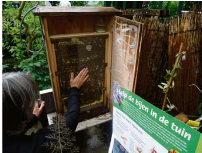
14 juli was de Open Imkerijdag in het Sarphatipark.

Het festival vind plaats in de Gerard Doustraat tussen de Ferdinand Bol en Frans Halsstraat. Op zondag 16 september 2012 van 12.30 tot 21.0 uur. www.gerarddouculinair.nl, www.facebook.com/GerardDouCulinair, Twitter@douculinair