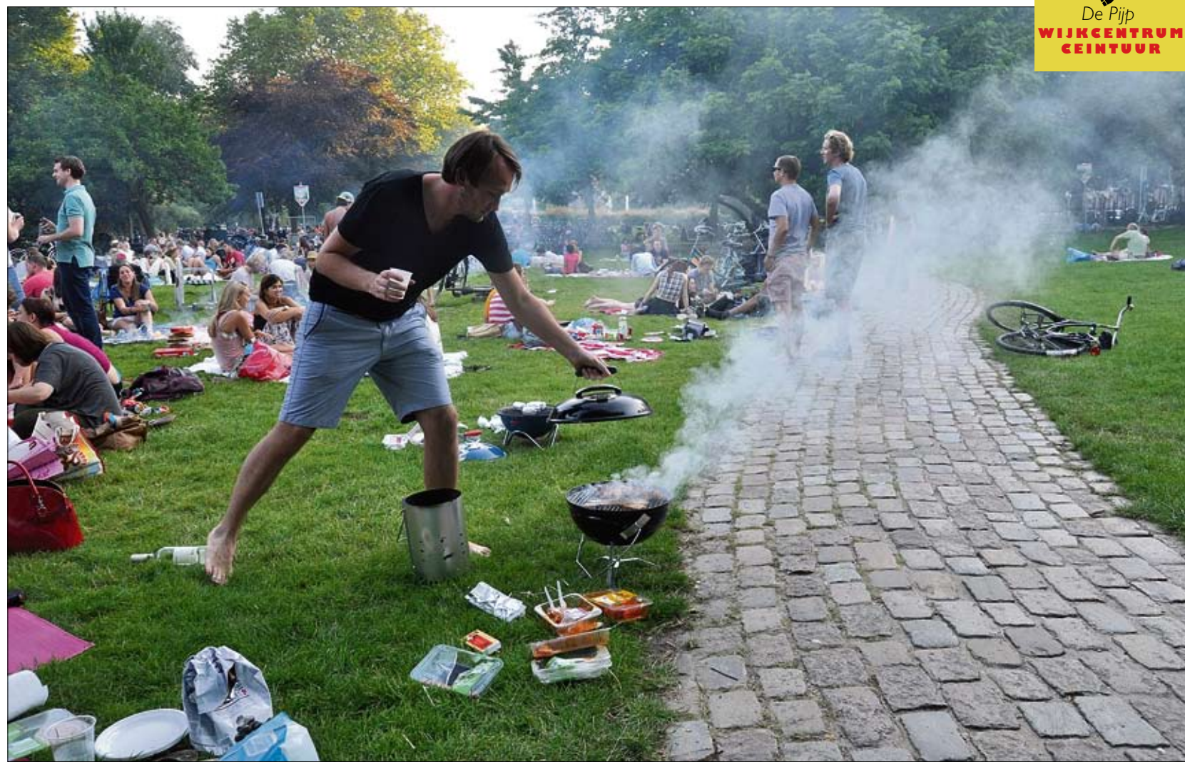
Met de barbecue en de blote voeten in het gras samen met vrienden zorgeloos genieten van een warme zomeravond in het Sarphatipark.

Henk Vrolijk is beheerder van het Groen Gemaaal, het ecologisch plantenruilcentrum in het park. "Dit park kan veel bezoekers aan. En ook de grasmat kan veel verduren. Maar vooral wegwerpbarbecues zijn funest. Ze staan in het gras en verbranden het met wortel en al. Regen spoelt de grond weg en er blijft een kuil achter. Dat herstelt niet meer. Het park staat blauw van de rook en burens kunnen hun ramen sluiten. En