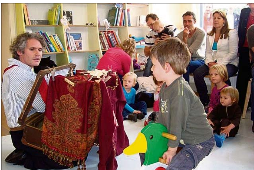
Poppenspel tijdens de feestelijke opening van kinderboekenwinkel Casperle.

'Tien, vijftien jaar geleden was een kinderboekenwinkel in De Pijp het slechtste idee dat je kon bedenken. Vroeger was De Pijp op zijn zachtst gezegd geen goede buurt. Maar het karakter van de wijk is veranderd. Mensen met kinderen trokken vroeger weg, want de woningen zijn relatief klein. Maar nu blijft iedereen en is De Pijp een kinderrijke buurt geworden.'