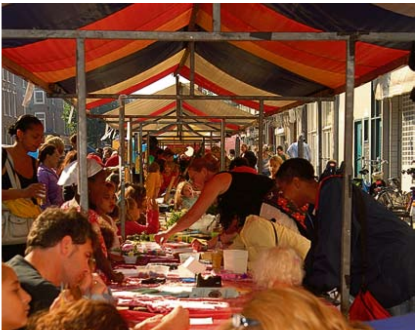
Vrijwilligersmarkt tijdens een vorig Nazomerfestival De Pijp

Meer dan ooit heeft het Nazomerfestival De Pijp de buurt nodig. Dit is een oproep aan bewoners en ondernemers om een creatieve bijdrage te leveren aan het jaarlijkse buurtfeest op de Albert Cuyp. Ondanks het zeer beperkte budget willen we laten zien dat we samen nog steeds een geweldig buurtfeest kunnen neerzetten. Hieronder een opsomming van activiteiten waar we ideeën, mensen of middelen voor zoeken.