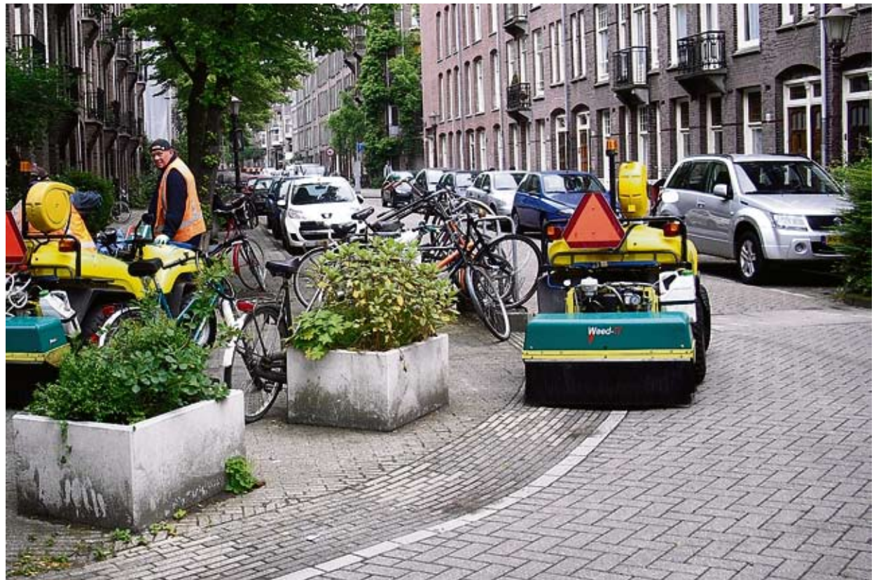
Onkruidbestrijding in de Pieter Aertszstraat met Roundup Evolution, de 'light' versie van het giftige en omstreden middel Roundup.

Het is opmerkelijk dat het stadsdeel zijn bewoners blootstelt aan een dergelijk gevaarlijk gif. De stof staat in Zuid-Amerika