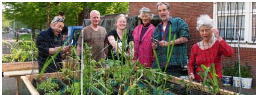
Links: Vrijwilligers Werkgroep Watertuinen blij met donatie Werkgroep Open Tuinendag. Rechts: Gierzwaluwkuikens in toren Oranjekerk