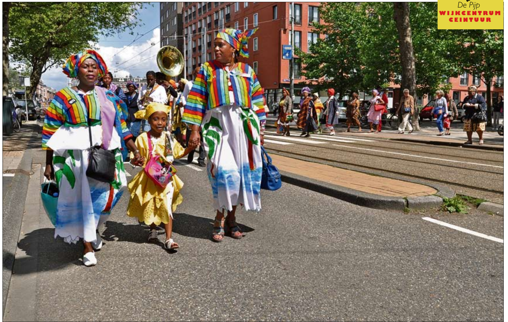
Prado Waka (Proud Walk) tijdens Ketikoti in De Pijp 2011 door de Surinaamse vereniging Soso Lobi (onvoorwaardelijke liefde). Een optocht met dans, muziek én pronken met je mooie uiterlijk.