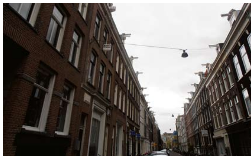
In de Govert Flinkckstraat zie je niet veel passanten

Tussen de Van Woustraat en de Hemonystraat is de Govert Flinkckstraat op zijn stilst. Enkele tientallen meters verderop raast het verkeer onophoudelijk door de Van Woustraat en om de andere hoek staat het bij Lidl bomvol met klanten. Maar in dit stukje Pijp is nu haast niemand op straat te bekennen. Italiaanse trattoria L'Angoletto is op zaterdag gesloten, zodat de tegenover gelegen coffeshop Ibiza vandaag voor de meeste reuring zorgt. Welgeteld twee klanten stappen er in een klein uurtje naar binnen: een man die zo te zien al aan zijn pensioen zit en haastig naar binnen schiet, om binnen een minuut weer buiten te staan. Maar ook een jonge vader die vrouw en kroost even aan de overkant van de straat laat wachten. Veel geparkeerde auto's en slordig weggezette fietsen in dit deel van de Govert Flinkck. Bewoners spot je vooral als ze van of naar hun auto lopen. Passanten