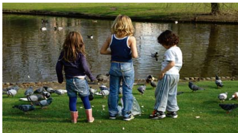
Lente in De Pijp. Links: niet alle eendjes zwemmen in het water; rechts: de Pijpbewoner vindt altijd wel de ruimte om gewoon te genieten.