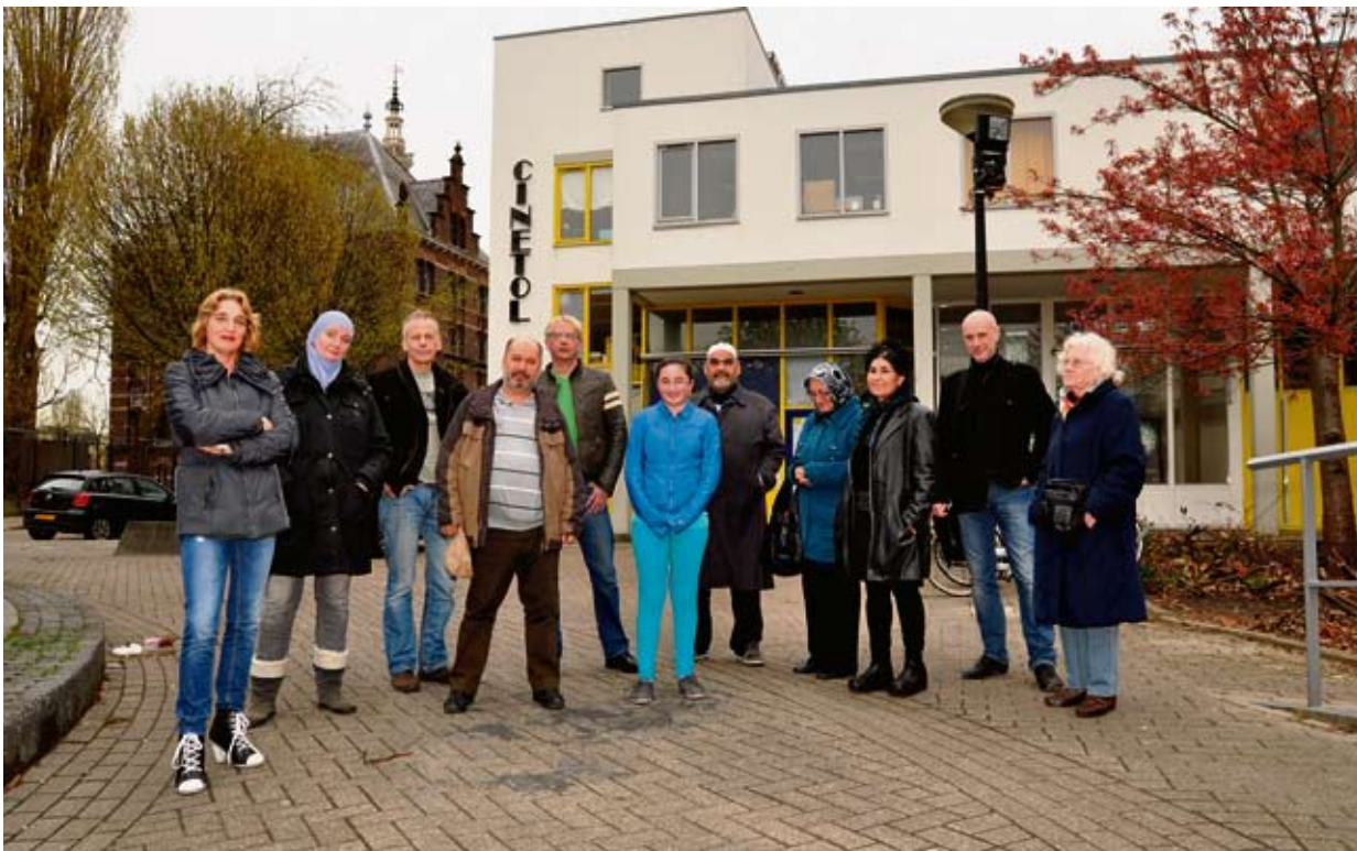
Vrijwilligers voor Cinetol, dat met Plan C een ontmoetingscentrum kan worden voor de buurt en een broedplaats voor nieuw vrijwilligerswerk.

Voormalig jongeren centrum Cinetol staat sinds de opening van multifunctioneel centrum de Edelsteen alweer twee jaar leeg. Vrijwilligers die wonen in de Diamantbuurt schreven een plan om van Cinetol opnieuw een buurthuis te maken. Plan C werd op 3 april uitvoerig behandeld door de Commissie Samenleving. Voor de vrijwilligers is de hoop nog niet verloren.