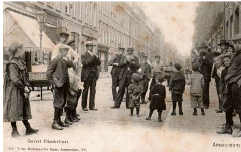
Govert Flinkckstraat 130

De Govert Flinkckstraat aan het begin van de vorige eeuw. Een clubje muzikanten trekt veel bekijks.