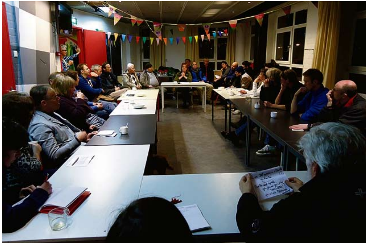
Het Breed Buurt Beraad op 9 februari in het Huis van de Wijk.

Dromen over de buurt: hoe wil je dat De Pijp er uit ziet in 2020. Zo'n veertig betrokken buurtgenoten lieten hun fantasie de vrije loop tijdens het Breed Buurt Beraad op 9 februari in het Huis van de Wijk.