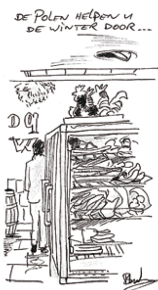
De Poolse winkel Van Woustraat