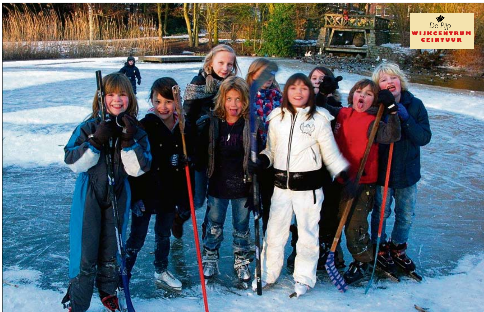
Hartje winter zijn de kids natuurlijk met zijn allen te vinden op het ijs. Hier in het Sarphatipark.

Hoe is het om als kind in De Pijp te wonen? Wat vinden kinderen leuk aan de buurt en wat missen ze?