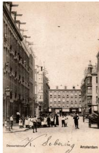
Dusartstraat rond 1900

Deze keer nemen we een kijkje in de Dusartstraat rond het jaar 1900.