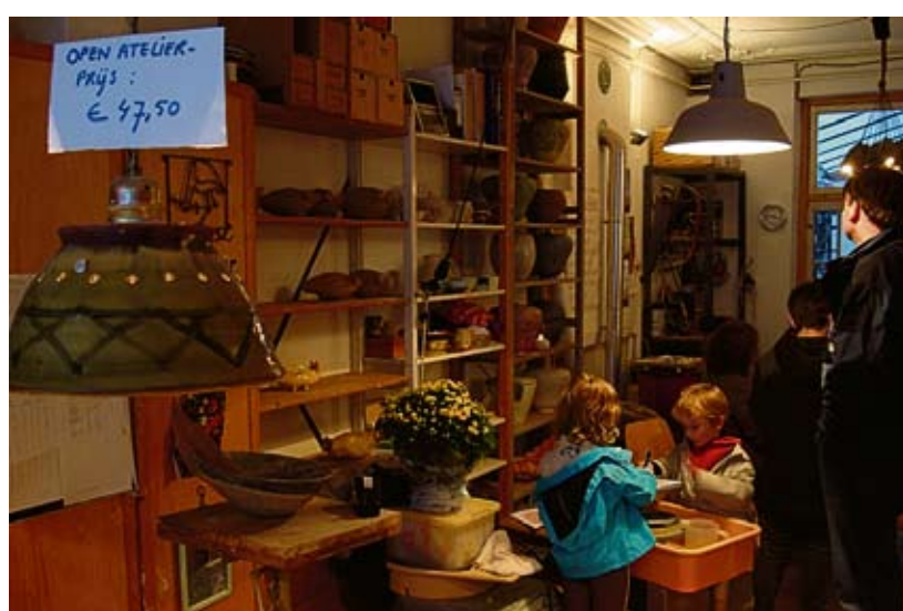
Links: Keramiek van Campen, één van de 72 deelnemers aan 'Open Ateliers De Pijp' op 29 en 30 oktober.; rechts: Kinderen tijdens een spontane schoonmaakactie van hun nieuwe speeltuintje in de Saenredamstraat.