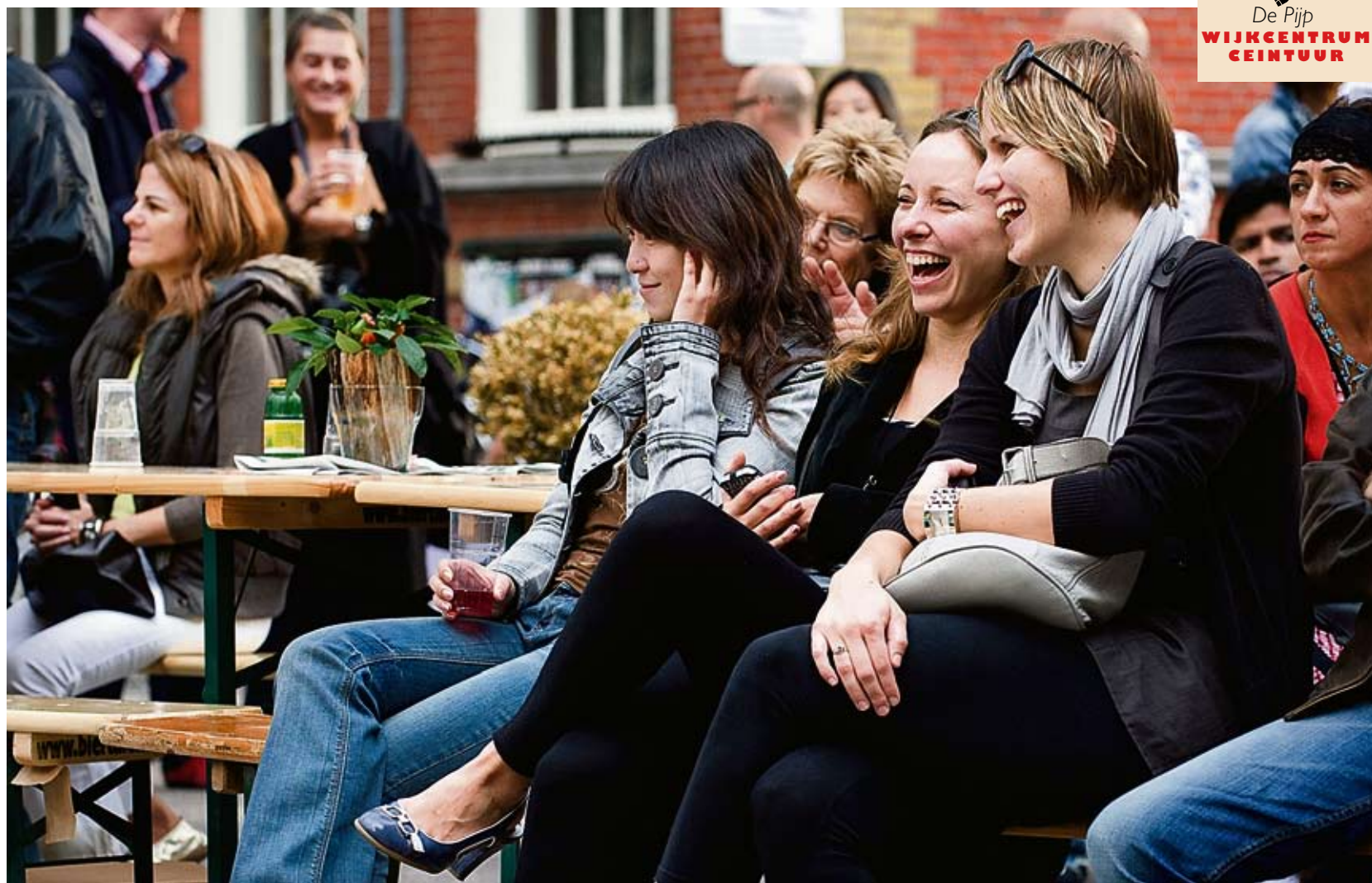
Publiek tijdens Nazomerfestival 2009.

Het Nazomerfestival in De Pijp begon in 1999 als kleinschalig straatevenement onder de naam Albert Cuypeest. In de laatste paar jaar groeide het uit tot een groot festival. Hierdoor dreigde het buurtkarakter verloren te gaan. Daarom wil de organisatie terug naar de oorsprong.