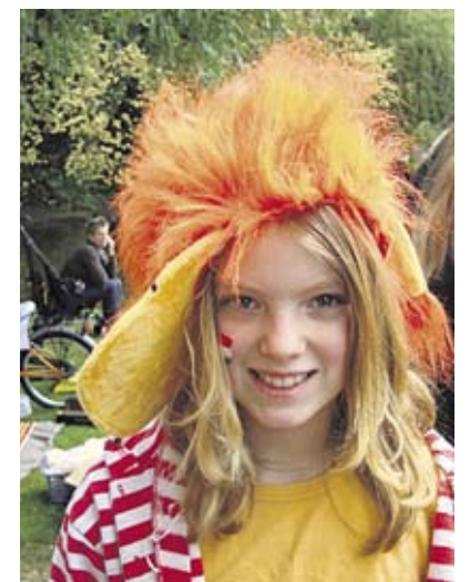
30 april is het weer zover: Koninginnedag. Oranje Boven! Alle Oranje-attributen kunnen weer voor één dag uit de kast. En Amsterdam staat op z'n kop. Hierboven een paar 'kopstukken' uit De Pijp, vorig jaar in het Sarphatipark.