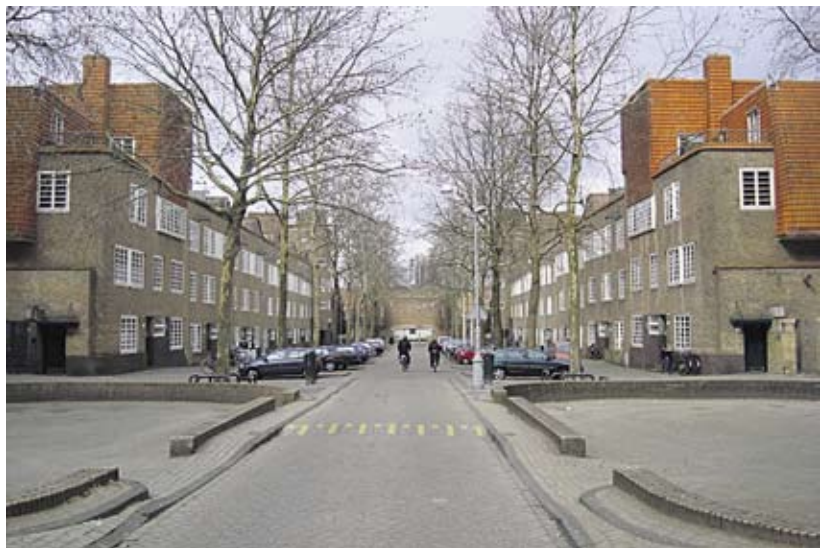
Veel woningen in de Tellegenbuurt hebben monumentenstatus.

Afgelopen week is er in de Burgemeester Tellegenbuurt een flyer huis-aan-huis verspreid. Bewoners, ondernemers en instellingen worden opgeroepen mee te doen aan een enquête in de buurt.