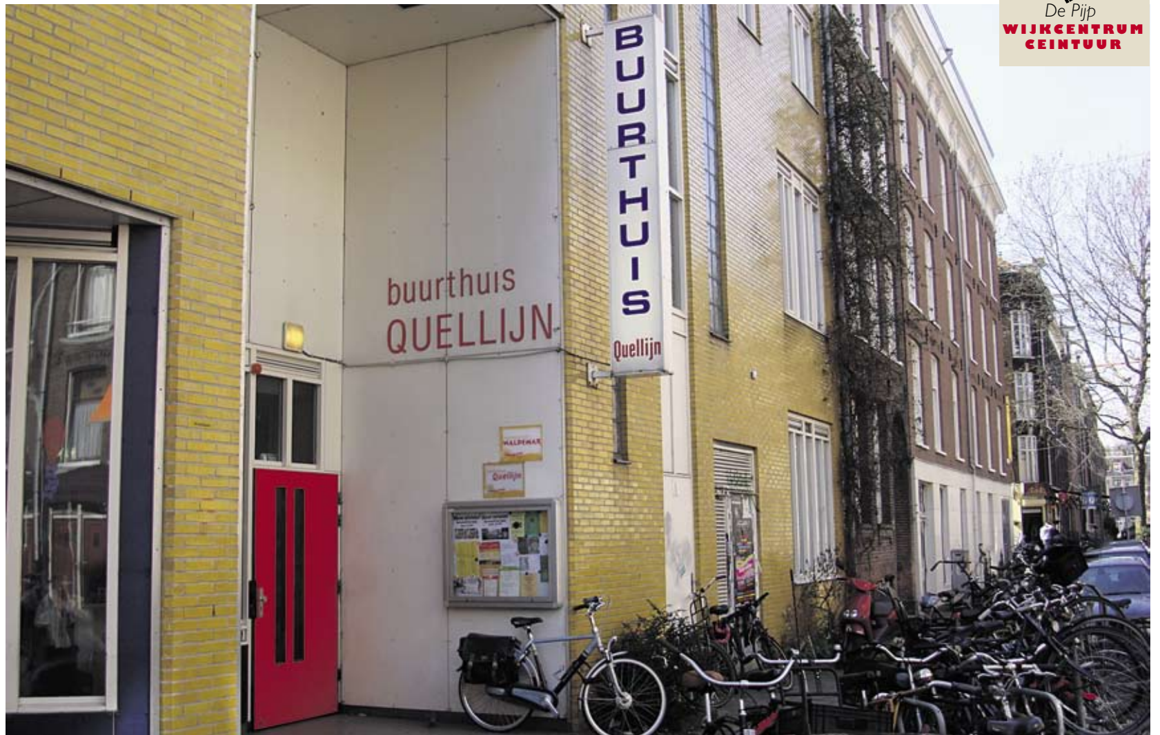
Buurtbewoonster: "Vooral ouderen en mindervaliden worden door de sluiting gedupeerd."

Op 1 juli sluit buurthuis Quellijn voorgoed zijn deuren. Geschiedenis en gevoelens van onmacht en onbegrip leggen het af tegen een zakelijke beslissing.