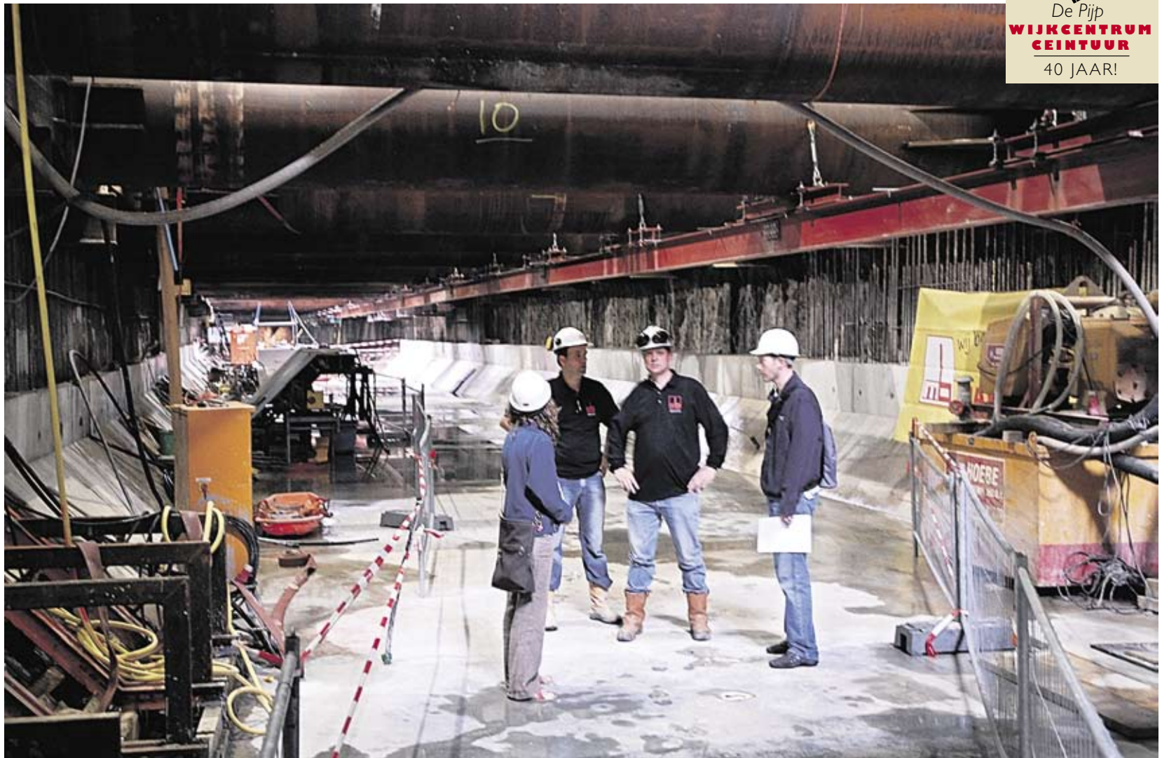
Bouwput Noord/Zuidlijn blijft winkeliers nog jaren hinderen.

De bewoners en winkeliers van de Ferdinand Bolstraat worden elke dag geconfronteerd met de overlast die de aanleg van de Noord/Zuidlijn oplevert. Pas als de bouwput dicht is, worden winkels weer bereikbaar. Tot die tijd is het voor veel winkeliers overleven. De gemeente mag wel eens meer betrokkenheid tonen.