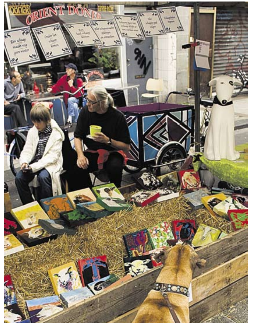
De presentatie van 'Goed Mis' op de Kunst- en CultuurCuyp.

De jury van de Prix d'Albert (de prijs voor de beste presentatie op de Kunst- en CultuurCuyp tijdens het jaarlijkse Nazomerfestival) heeft na uitvoerige beraadslaging haar waardering uitgesproken voor de volgende deelnemers: