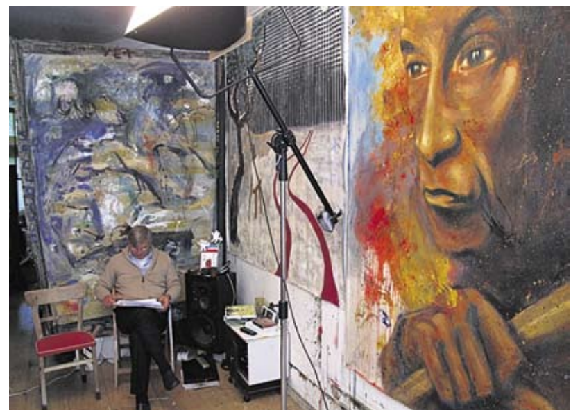
Impressies van 'Open Ateliers De Pijp' de tweejaarlijkse atelierroute die in het weekend van 3 en 4 oktober in De Pijp werd georganiseerd (zie ook pagina 2 en 7).