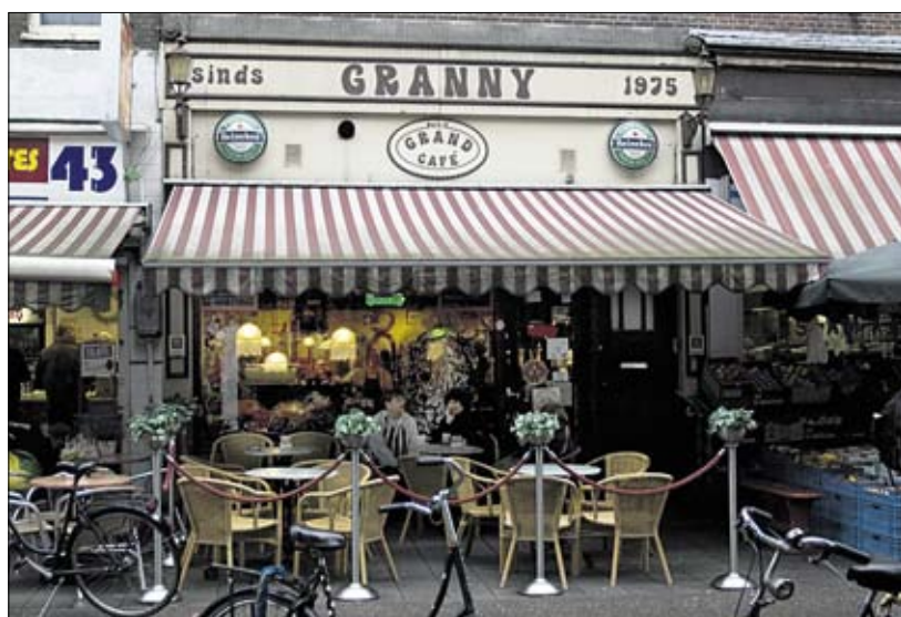
Petit Grand Café Granny.