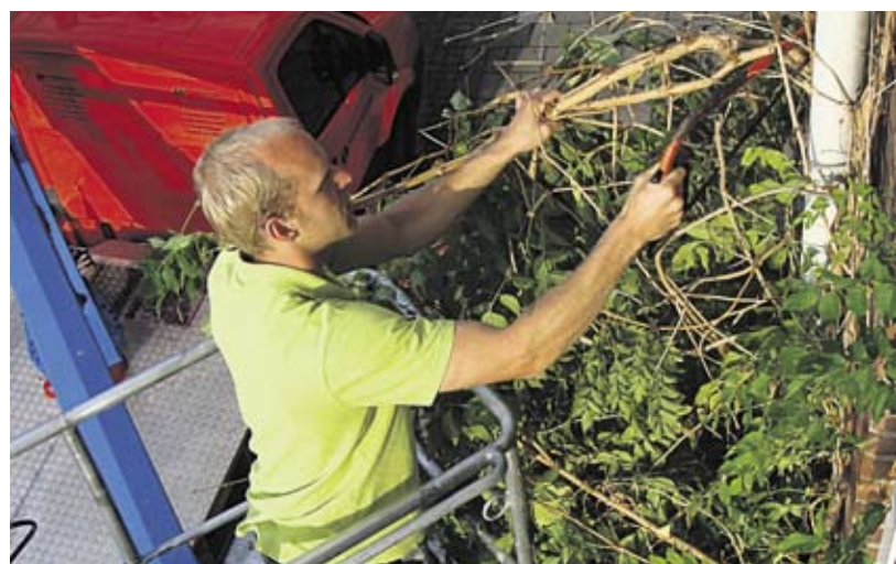
De 'serial-klimplantenkiller' in actie.

Vroeg in de ochtend word ik gewekt door een niet thuis te brengen geluid. Het komt uit de richting van de woonkamer, die aan de straatkant ligt. Maar ik woon 2-hoog en het is te vroeg voor de glazenwasser. Slaperig open ik de gordijnen en sta oog in oog met een man in een hoogwerker die fanatiek de 11 jaar oude trompetstruik van de gevel staat te rukken. Wat zullen we nu beleven? Ik ben ineens klaarwakker! Ik steek mijn modieuze