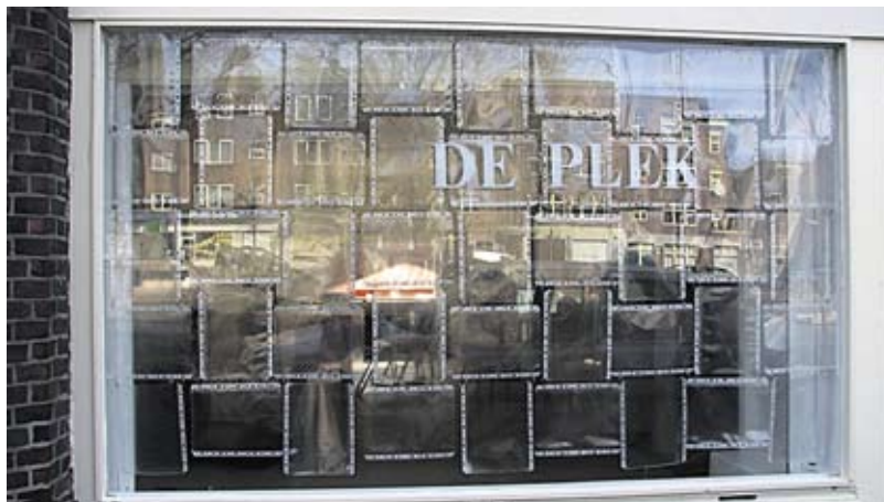
Komvanjeplek, kortweg 'De Plek'.

Niet in het wijkcentrum, maar in het Groen Gemaal, een prachtig monumentaal gebouwtje in het Sarphatipark. U kunt langs komen om planten, zaden en stekken te ruilen. Vrijwilligers geven hulp en advies bij het onderhoud van uw geveltuin. t 664 13 50 E-mail: groengemaal@wijkcentrumceintuur.nl