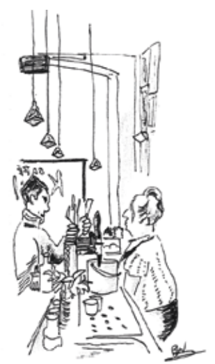
Café Krull Sarphatipark