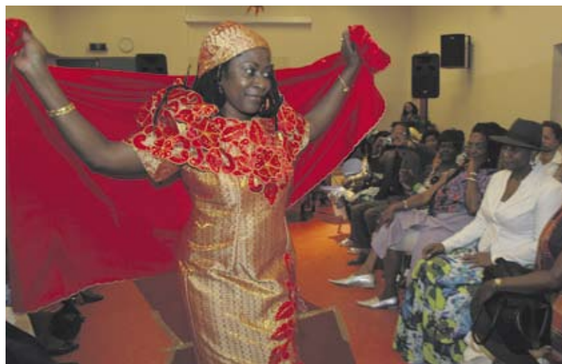
Leden van vereniging 'Soso Lobi' liepen op zondag 27 september in het Jan van der Heijdenhuis een mode- show tijdens een geldinzamelingsactie voor senioren met financiële problemen in Suriname.

Mail uw materiaal naar q.voorn@wijkcentrumceintuur.nl