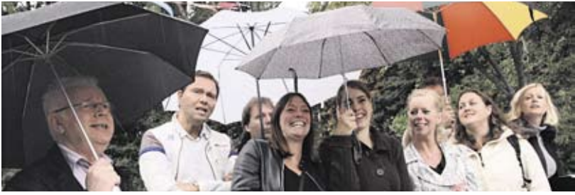
5 september: Gewapend met met paraplu's.