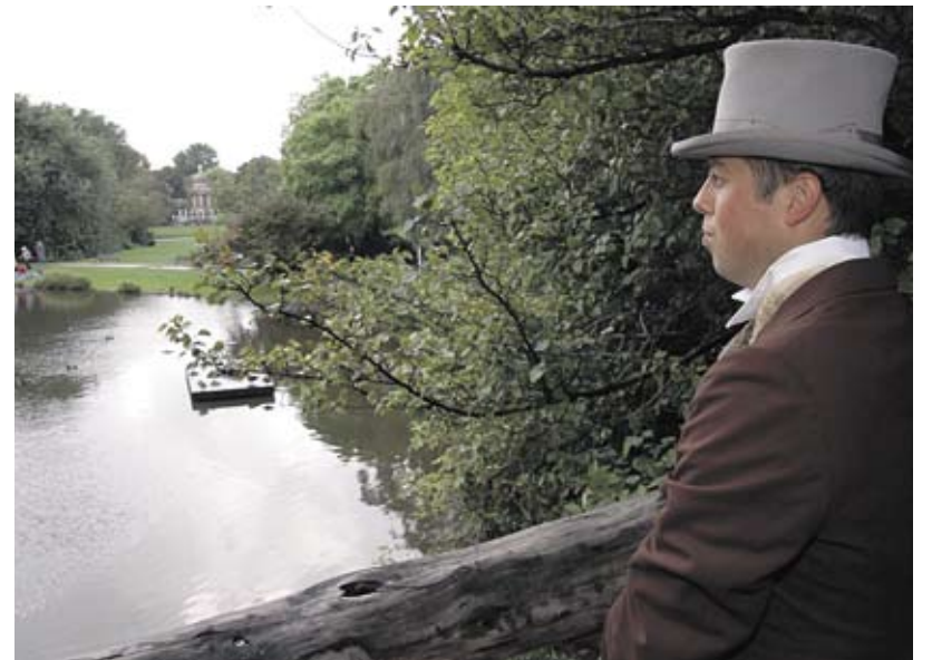
5 september: Een historisch overzicht vanaf het liefdesbruggetje.