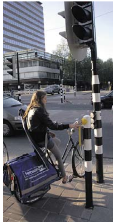
Het nieuwe stoplicht.

Wergroep Verkeer de Pijp wil iedereen danken die enkele maanden geleden een handtekening heeft gezet onder onze petitie aan de Gemeenteraad. Wij vroegen om een tweede stoplicht en een zebra aan de westkant (de "Lidlkant") van de kruising, zoals voor de herprofilering. De Centrale Stad heeft de onveiligheid onderkend, maar helaas niet voor onze oplossing gekozen. Tijdens de zomervakantie zijn aanpassingen gemaakt. Er ligt een nieuw een tweerichting-fietspad aan de oostkant van het kruispunt, dat sinds september wordt beveiligd door stoplichten. Veel ouders hopen dat dit dubbele fietspad een veilige oversteek voor de schoolkinderen mogelijk maakt. De Wergroep Verkeer is niet overtuigd dat de situatie nu veel veiliger is geworden. De westkant is voor de voetganger even onveilig gebleven; de oostkant is met elkaar kruisende verkeersstromen nu chaotischer en onoverzichtelijker dan ooit.