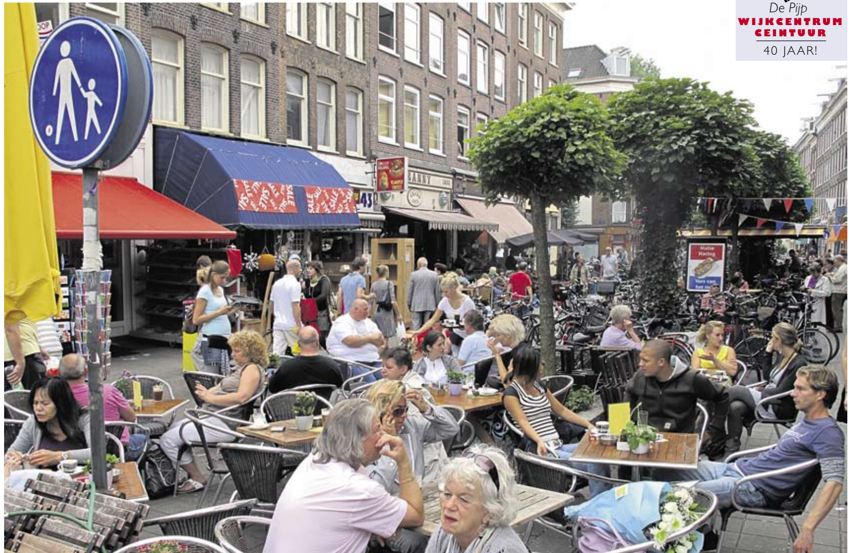
Het terras van de 'Groene Vlinder' op de hoek van de 1e van der Helststraat en de Albert Cuyppstraat.

Zo ontstond dit jaar het actiecomité Ai!Amsterdam. Via een intensieve straatcam- pagne maakte het duidelijk dat er burgers zijn die de overdaad aan regelgeving zat zijn en niet langer betutteld wilden worden. De knipoog naar de gemeentecampagne "I Amsterdam" ont- ging B&W niet. Vertegenwoordigers mochten bij Cohen aan tafel aanschuiven, op voorwaarde dat