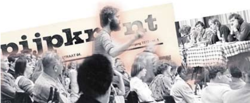
Actievoeren met het Wijkcentrum anno 1972.

Wijkcentrum Ceintuur bestaat veertig jaar in 2009. Een mijlpaal waarbij we niet alleen stil staan bij het verleden, maar vooral ook kijken naar de toekomst. Door te praten over de toekomst met betrokkenen en oudgedienden, met bewoners, beleidsmakers, politici en professionals.