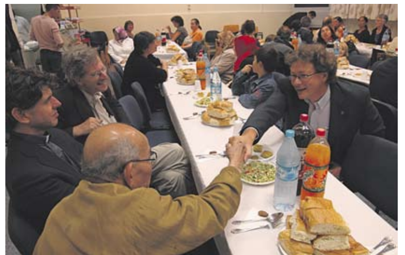
Iftarmaaltijd op woensdag 9 september in de Selimye Moskee. Buurtbewoners, uitgenodigd voor deze maaltijd na een dag vasten, luisterden naar de uitleg over Ramadan en genoten van een gastvrij onthaal.