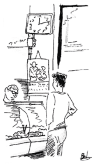
Tjin's Toko 1e van der Helststraat