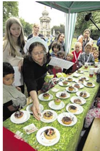
2 september: Cakejes versierwedstrijd.