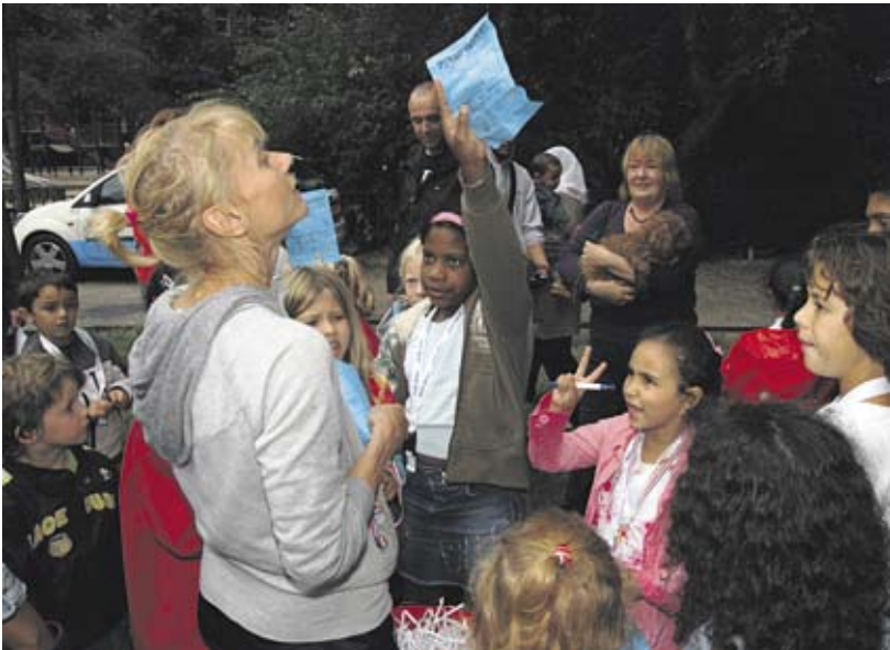
2 september: Grabbelton voor de kinderen.