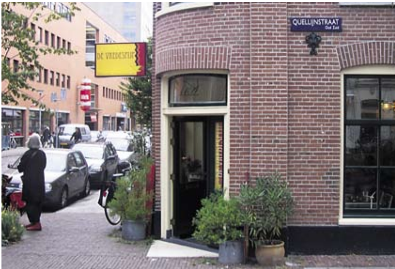
De Vredespijp