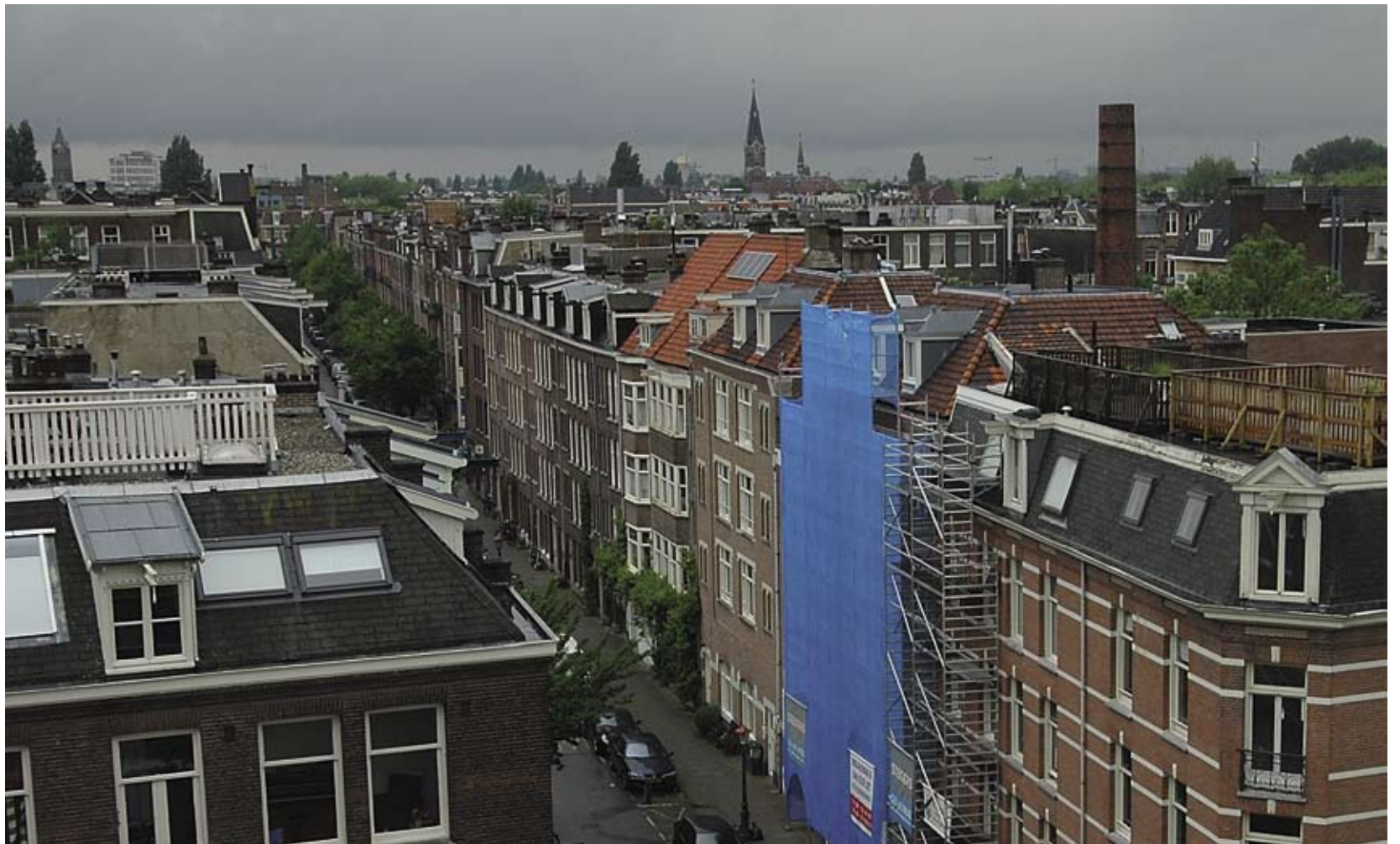
Opbouwwerk, de zichtbare kracht in het verbinden van de buurt en haar inwoners.

Of de twee bewoners van een plein in de Zuid-Pijp die zich al jaren ergerden aan een verwaar-