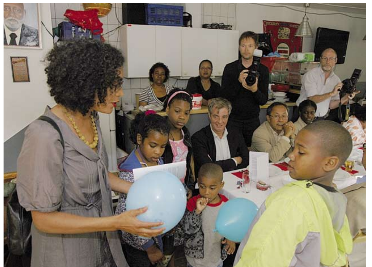
Kinderen prikken ballonnen door, een verwijzing naar de kanonschoten die op 1 juli 1863 in Paramaribo werden afgevuurd

020 6764800 di-wo kunstwerkgoep@gmail.com, www.nazomerfestival-depijp.nl