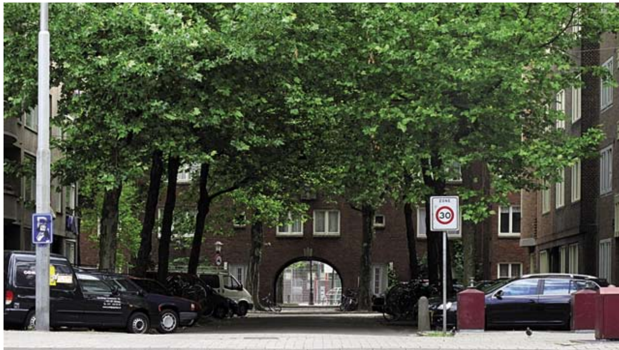
Diamantbuurt, veiliger dan de krantenkoppen suggereren (Foto: Peter Lange)

Zowel Het Parool als De Telegraaf gaf de afgelopen maand ruim aandacht aan de criminele activiteiten van de Van Wougroep. Koppen als 'Van Wougroep lijkt opnieuw betrokken bij drugshandelen 'Tuig Diamantbuurt protesteert' suggereren dat er heel wat aan de hand is in de buurt van de Van Woustraat. Is er voor bewoners reden om zich zorgen te maken?