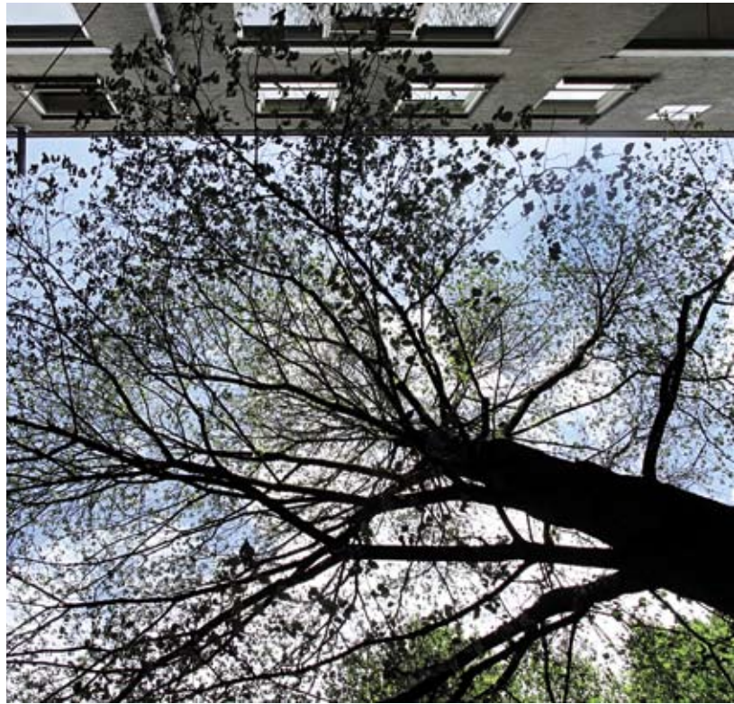
'De ontluiking van de bladeren komt dit jaar laat op gang'.

De bladeren van de iep willen dit voorjaar niet snel ontluiken. Veel iepen in Amsterdam zijn vatbaar voor de iepenziekte, maar daar heeft het niet mee te maken dat de iepen nog bijna kaal zijn. De zaadvorming speelt wel een rol. Gelukkig staat die de bladvorming niet in de weg en krijgt de iep ook dit jaar haar blad gewoon weer terug.