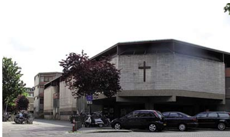
Het Afrikahuis op de hoek van de Van Ostadestraat en de Henrick de Keijserstraat

topstuk van de Forumbeweging en daardoor van evident belang voor de Nederlandse bouwkunst en voor Amsterdam in het bijzonder. Zowel het exterieur als het interieur van het complex zijn voor een groot deel in de oorspronkelijke staat gebleven en zijn het daarom waard beschermd te worden.