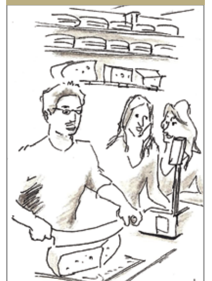
Het Kaasboertje G. Doustraat