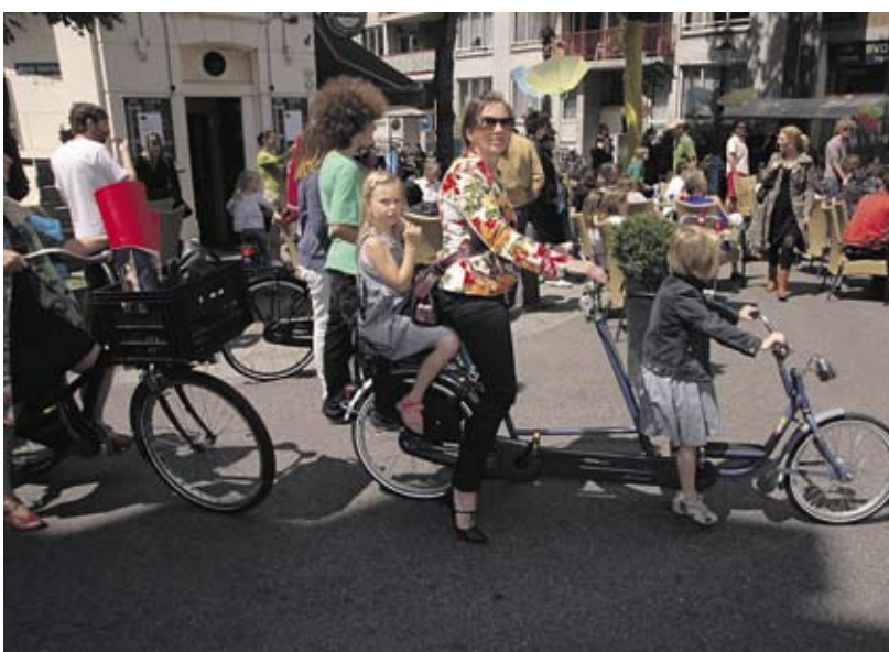
De Pijp maakt Muziek!