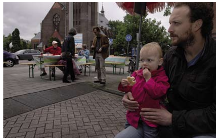
Optredens tijdens De Pijp maakt Muziek! Op het plein Tweede Jacob van Campenstraat/Gerard Doustraat en t.o. Vredeskerk op zondag 21 juni