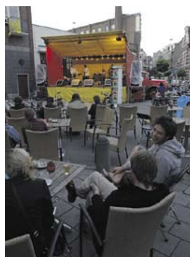
De Pijp maakt Muziek!