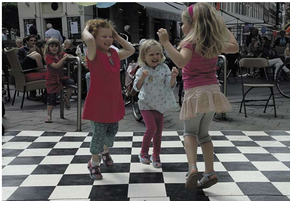
De Pijp maakt Muziek!

Ma t/m vrij 9.00-17.00u; di tot 19.30 uur