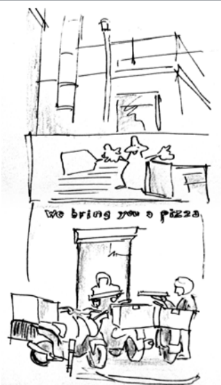
Pizza Donna G. Doustraat / J. van Campenstraat