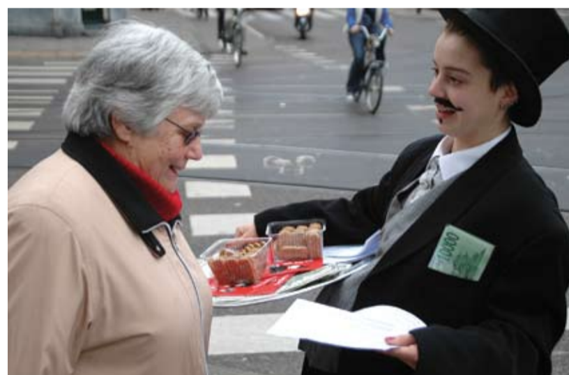
Actievoerders verkleed als speculanten geven informatie en delen speculaasjes uit op de Ceintuurbaan.