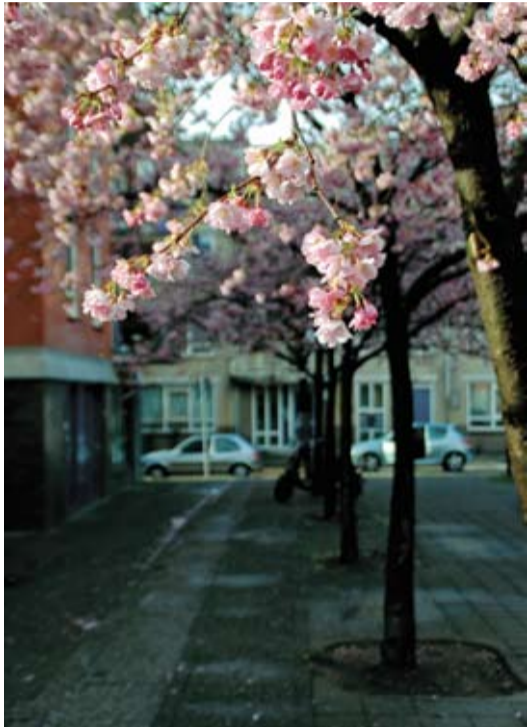
De eerste bloesem op het Dora Tamaraplein (ook de laatste als het plein opnieuw wordt ingericht?)