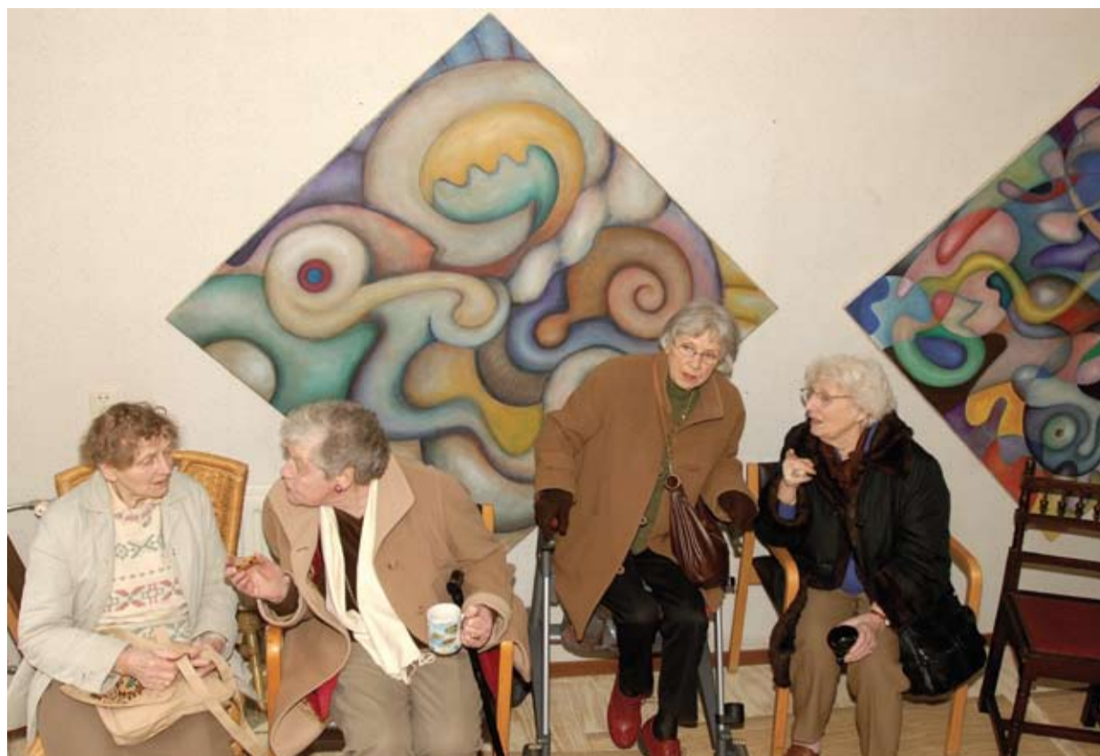
Bezoekers open dag in gekraakte bejaardenwoning in de Uiterwaardenstraat.

De bewoners willen ook weten wat er met de voormalige kantoren van zorginstelling Puur Zuid gebeurt. Deze kantoren maken onderdeel uit