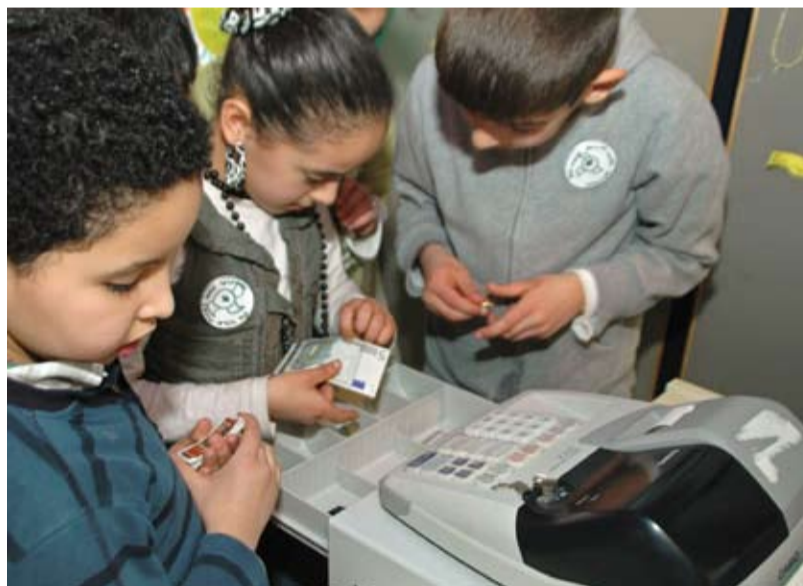
Opening van 'De Van Alles Wat Winkel' in de Rustenburgerstraat 236-238 op 27 maart.