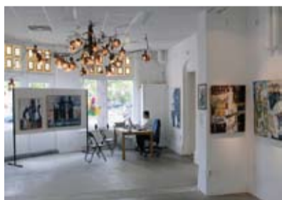
Platform de Levante

Cooter en was vertegenwoordigd op Art Amsterdam.