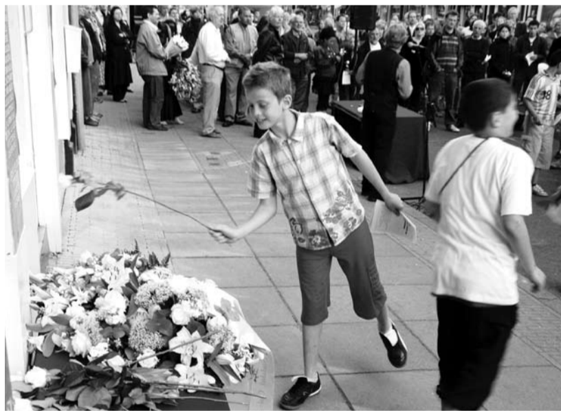
Jaarlijkse 4 mei herdenking in de Van Woustraat. Kinderen leggen bloemen bij de gedenkplaat aan de gevel van de voormalige ijszaak Coco.

Tegen inlevering van deze bon ontvangt u een tweede bolletje ijs gratis.