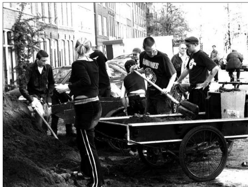
Ruim twintig vrijwilligers van de Kraakgroep de Pijp en andere bewoners staken op 22 april hun handen uit de mouwen tijdens geveltuinendag. 9 teams trokken met een bakfiets de buurt in om bij bewoners geveltuinen uit te graven en daarna met aarde vol te storten. Vele kubieke meters aarde werd met bakfietsen vervoerd. Voor een groenere buurt stelden zij die - en zichzelf - graag ter beschikking.

Aanmelden kan bij Lilian Voshaar van Natuur- en milieuteam De Pijp tussen 14.00 en 18.00 uur, ma t/m don. 400 45 03 of mail naar l.voshaar.nmt@wijkcentrumceintuur.nl . U kunt hier ook een geveltuin opgeven als u denkt dat deze aan een Make-Over toe is.