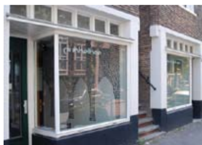
Dubbelbee galerie, buiten