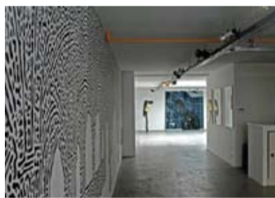
Dubbelbee galerie, binnen