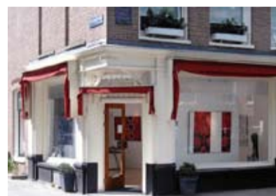
FEEL Contemporary Art Gallery, buiten