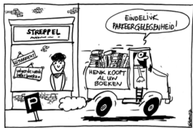
Illustratie: Steven Diemel