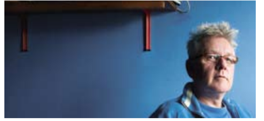
Geef je op! Atelierroute De Pijp p. 4, 5

JAARGANG 37 | NUMMER 3 | MEI 2007 | VERSCHIJNT ACHT KEER PER JAAR