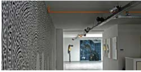
Galleries in de Pijp p. 4, 5