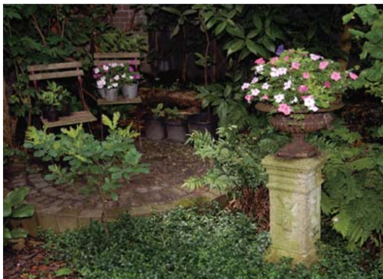
Amstedijk, onbestemd hoekje liefdevol omgetoverd tot romantisch stukje tuin.

Hoewel het weer er niet goed uitzag en er regen dreigde te gaan vallen, besloot ik zaterdag 16 juni