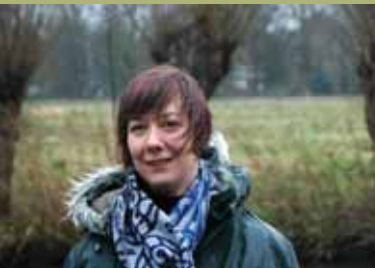
Trudie Jongen

vermindert. We hebben een paadje langs het water aangelegd, waarop zelfs een bankje van het stadsdeel verschenen is. Het stadsdeel participeert in het grote onderhoud zoals bomen kappen en levert houtsnippers voor het pad. Er wordt in opdracht van het Stadsdeel Oud Zuid gewerkt, die een bepaald aantal uren uitbetaalt aan het wijkcentrum. Zuid West om hier mee de vrijwilligers te ondersteunen en om bijvoorbeeld bollen of een hark te kopen en nieuwe medebeheerders te vinden. Een enkele bootbewoner is vandaag de dag nog actief.