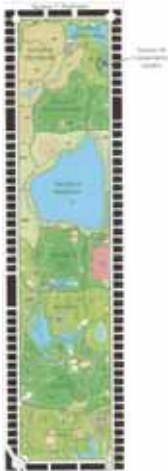
Central Park - Zone Map

Autoverkeer in het park is ten strengste verboden. Alleen politie en onderhoudsmensen mogen in auto's door het park rijden. Nergens in het park zijn er hekken,